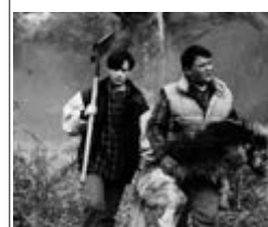
КЛАДОВИЩЕ ДОМАШНІХ ТВАРИН 2, НОВИЙ, СР, 01:00

Американець Форд живе в невеликому будиночку в лісовій глушині, намагаючись сховатися від хворобливих спогадів про війну. До нього приходить турист Ковач, і все йде добре, доки американець не виявляє, що гість - сербський солдат, який жадає помсти.