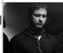
ЗАКОНОСЛУХНЯНИЙ ГРОМАДЯНИН, ІСТV, Пт, 23:25

Після смерті дружини ветеринар Чейз Метьюз і його 13-річний син Джеф вирішують почати нове життя. Вони переїжджають у глухе містечко Ладлоу. Тут Джеф знайомиться з підлітком на ім'я Дрю. Як з'ясується згодом, новому приятелю живе неспокоєм. Хлопець має проблеми з вітчизною, який до того ж служить шерифом. Гас чіпляється до пасинка з найменшого приводу, всліваючи занадто над хлопцем. У міт особливі люті і жорстокості, він вбиває пса Дрю.