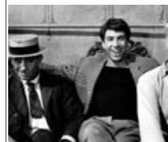
ЗОЛОТЕ ТЕЛЯ, Нд, 19:00

Дія розгортається через 10 років після подій, описаних у першій частині знаменитої саги. Республіка дедалі глибше занурюється в суперечності й хаос. Рух сепаративістів, представлений сотнями планет і могутнім альянсом корпорацій, може стати новою загрозою для Галактики.