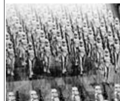
ЗОРЯНІ ВІЙНИ. АТАКА КЛОНІВ, НОВИЙ, Нд, 18:00

На жителя Філадельфії Клайда Шелтона і його сім'ю нападають грабники, в наслідок чого вся його сім'я гине. Клайду тільки й залишається сподіватися на справедливість судової системи, що вбивці понесуть заслужене покарання. Але всі його надії повністю розвіюються і головний вбивця в результаті виявляється на волі. Страшне почуття помсти повністю оволодіває Клайдом і він оголошує жорстоку війну не тільки головному вбивцям, але і всій судовій системі.