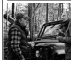
СЕЗОН УБИВЦЬ, ІСТV, ВТ, 23:35

Американець Форд живе в невеликому будиночку в лісовій глушині, намагаючись сховатися від хворобливих спогадів про війну. До нього приходить турист Ковач, і все йде добре, доки американець не виявляє, що гість - сербський солдат, який жадає помсти.