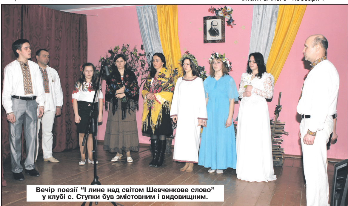
Вечір поезії "І лине над світом Шевченкове слово" у клубі с. Ступки був змістовним і видовищним.

З повагою — колектив Байковецької сільської ради.