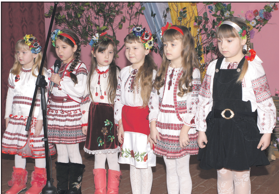
Наймолодші учасниці урочистостей з нагоди 200-річчя від дня народження Т. Г. Шевченка у клубі с. Ступки.

2014 рік визнаний роком Шевченка. У Ступківській бібліотеці-філії оформлено постійно діючу книжкову ліюстровану виставку "Ім'я, що єднає народи". Читачі бібліотеки можуть ознайомитися з літературою про цікаві факти з життя Кобзаря, про його подорож нашим краєм, і вкотре перечитати вічного "Кобзаря".