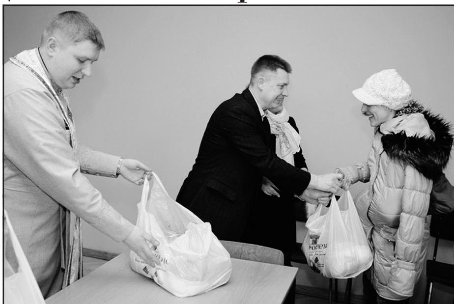
Упродовж передвеликоднього тижня понад 1400 одиноких та малозабезпечених мешканців Тернопілля отримали пасхальні подарункові набори.

У рамках благодійної ініціативи “Допоможи ближньому! Допоможи Україні!”, яку традиційно організовує корпорація “Агропродсервіс”, упродовж передвеликоднього тижня понад 1400 одиноких та малозабезпечених мешканців Тернопілля отримали пасхальні подарункові набори. Представники корпорації особисто навідувалися до людей і вітали їх зі світлим святом Христового Воскресіння.