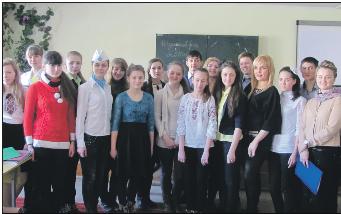
Учасники конкурсу молодіжних волонтерських проектів у Великобірківському БТШ.

Волонтерський рух є головним напрямком діяльності шкільного учнівського самоврядування. Цей рух базується на спільності інтересів, бажань, ідей учнів й передбачає реалізацію поставлених цілей та самореалізацію учнів. Діяльність школярів-волонтерів відбувається на засадах власної волі. Ця діяльність є неприбутковою, добровільною, корисною для інших людей та суспільства.