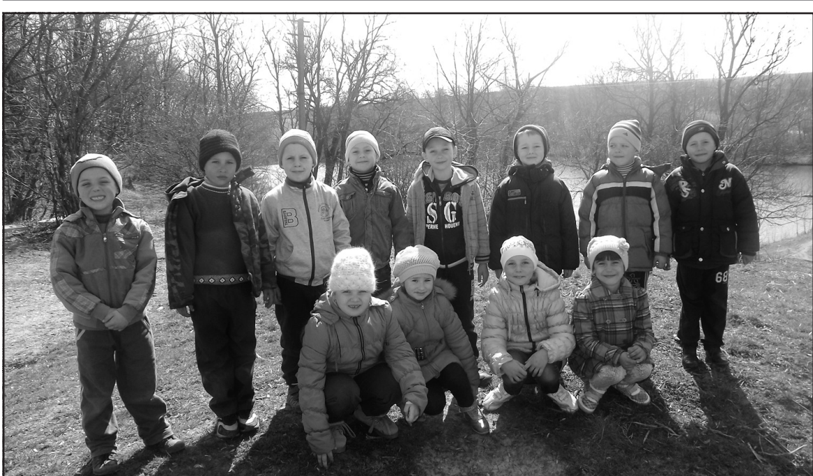
Першокласники НВК “Грабовецька ЗОШ І-ІІ ступенів — ДНЗ” — учасники проекту “Рідний край”.