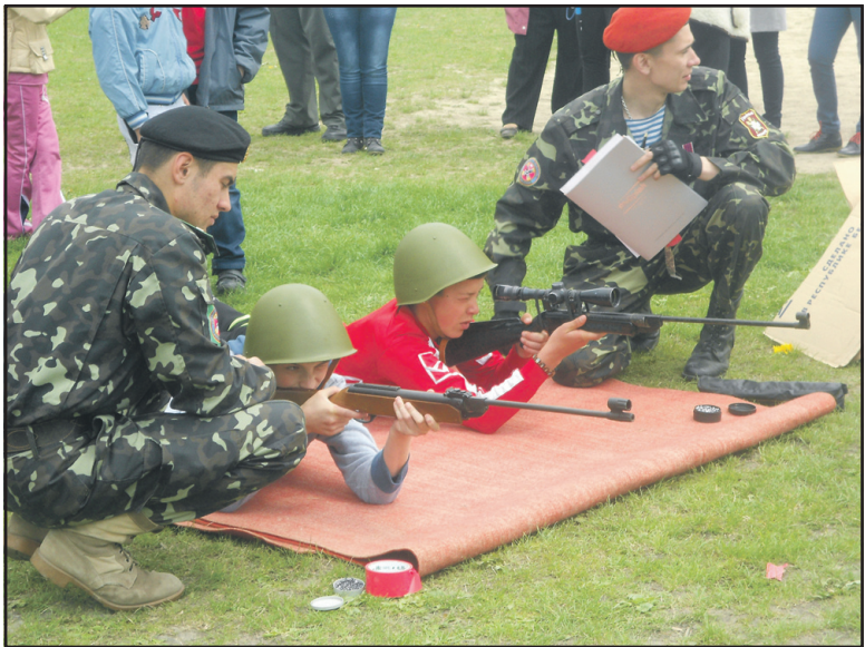
Білецькі школярі під наглядом козаків-екологів вправляються у стрільбі з пневматичної зброї.

Усі учні, навіть найменші, розуміють, що Україна нині у важкому стані, що її хочуть розчленувати, позбавити незалежності. І робиться це завдяки так званому "старшому брату" під російським триколом. Але, як сонце світить у голубизні неба, так і Україна буде вільною та соборною. Адже у сучасних умовах людям краще жити у мирі. Це розуміють навіть діти.