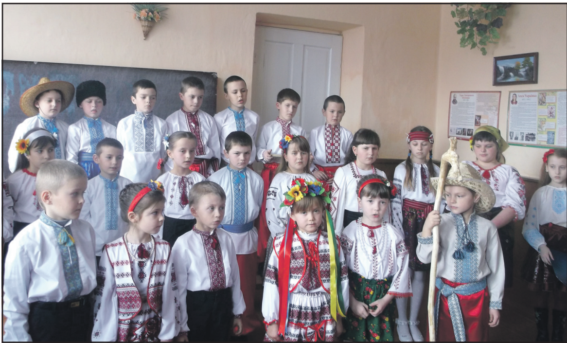
Учасники відзначення 200-річчя з дня народження Т.Г. Шевченка в Ігровицькій ЗОШ І-ІІ ст.