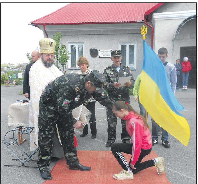
Так урочисто відбувалася посвята у козаки.