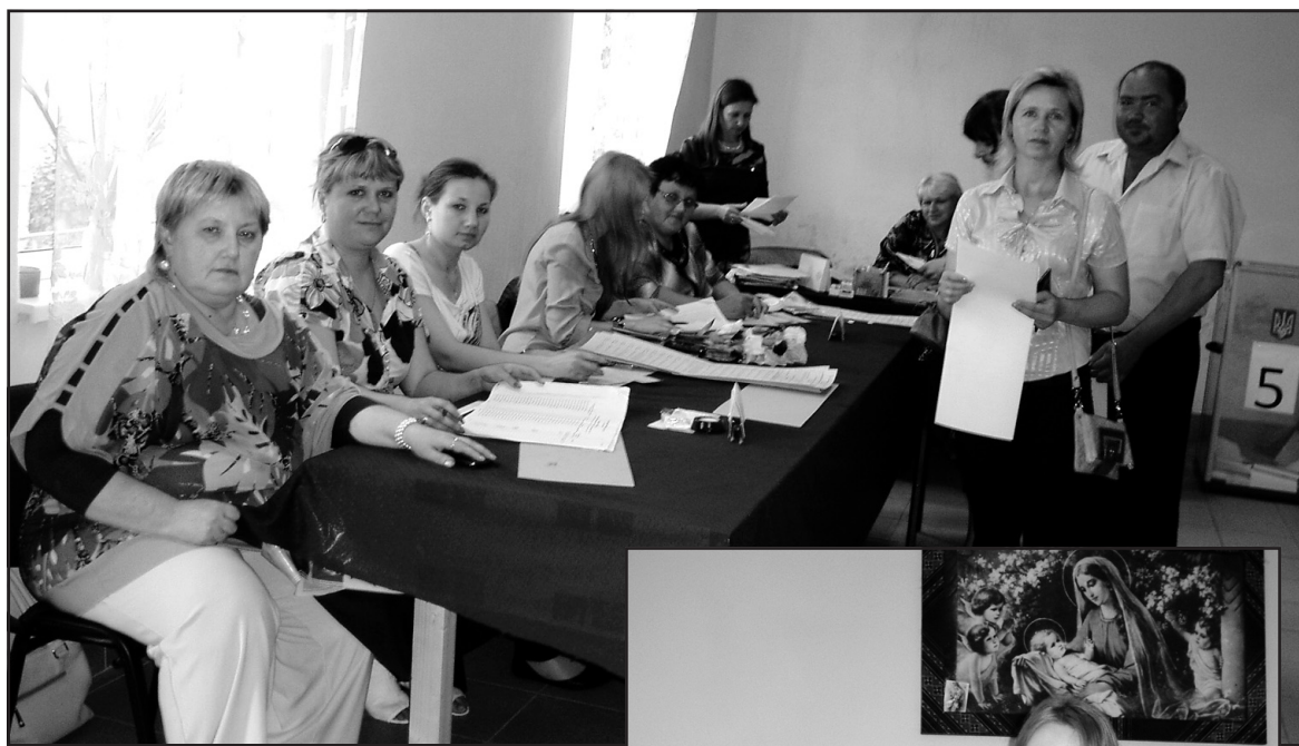
На виборчій дільниці №610951 с. Чернелів-Руський у день голосування 25 травня 2014 р.

Порядок передачі даних до ЦВК такий: округами, отримавши всі без винятку протоколи ДВК, переконавшись у їх коректності та відповідності закону, складають свої протоколи про підсумки голосування у межах округу, потім ці протоколи транспортують до ЦВК, яка розглядатиме їх на засіданнях у колегіальному режимі. Після надходження перших протоколів ОВК