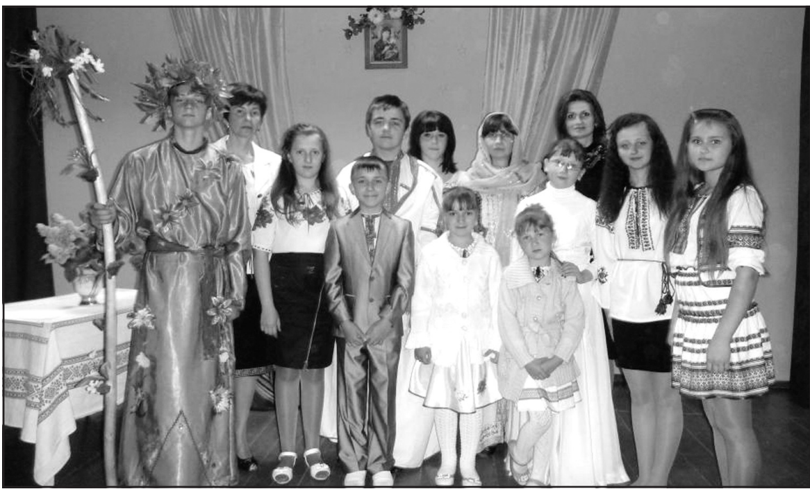
Під час відзначення Дня матері у клубі села Ступки.