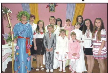
День матері у Ступках.