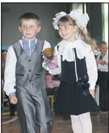
Фоторепортаж з Останнього дзвінка у Товстолузі.

www.trrada.te.ua - веб-сторінка Тернопільської районної ради