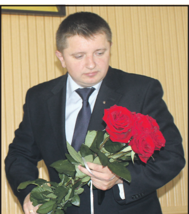
Андрій Строевус призначений головою Тернопільської РДА.