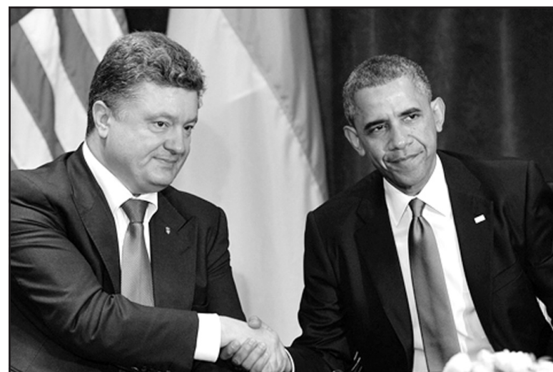
Президент України Петро Порошенко під час зустрічі з Президентом США Бараком Обамою, 4 червня 2014 р.

На думку Петра Порошенка, необхідно зволікати з підписанням