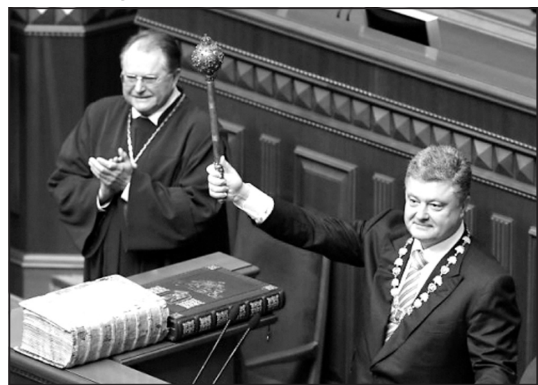
Президент України Петро Порошенко отримав офіційні символи Глави держави — Знак Президента України, Печатку і Булаву.

Голова Центральної виборчої комісії Михайло Охендовський вручив Петру Порошенку Посвідчення Президента України. Зго-