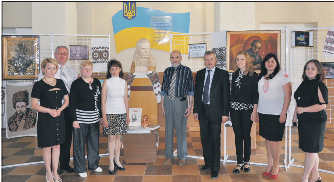
Організатори та учасники виставки образотворчого і декоративно-прикладного мистецтва у Тернопільському районному будинку культури з нагоди 200-річчя з дня народження Т. Шевченка.