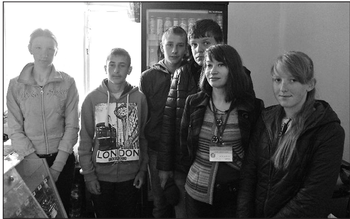
Учні Йосипівської школи під час екскурсії, організованої Тернопільським міськрайонним центром зайнятості.