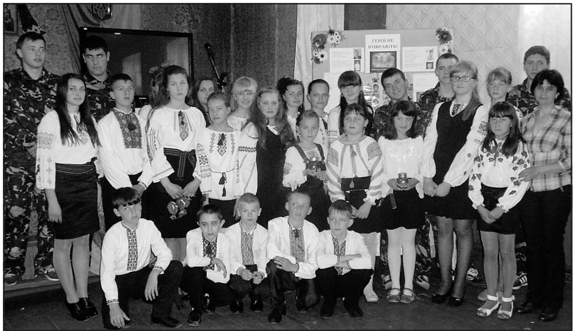
Учасники інформаційно-просвітницької години у Довжанківській ЗОШ І-ІІІ ст.

Вічна, світла пам'ять героям нашої держави, справжнім її синам, порядним і чесним, відвага і совість яких не могли бути іншими, — вони не поступилися, захищаючи свободу України. Тому стояли до останнього, — за дітей і батьків, за кожного з нас. Нам треба продовжувати справу і боротьбу наших героїв. Не забуваймо, яку ціну вони заплатили, щоб ми жили у вільній державі.