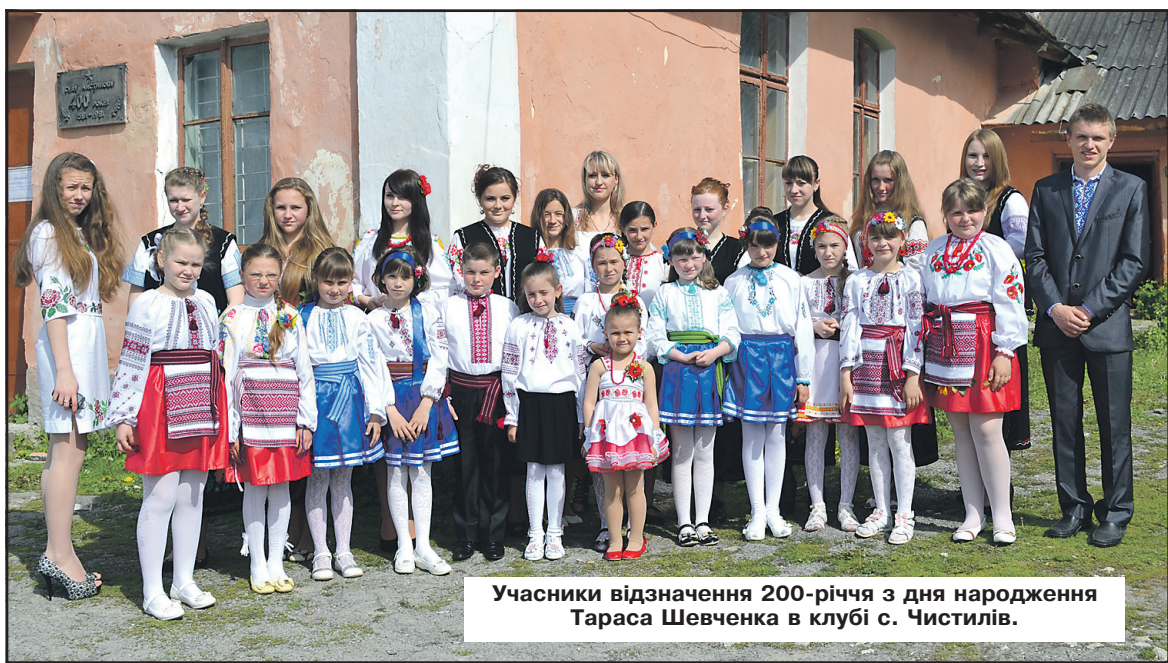
Учасники відзначення 200-річчя з дня народження Тараса Шевченка в клубі с. Чистилів.