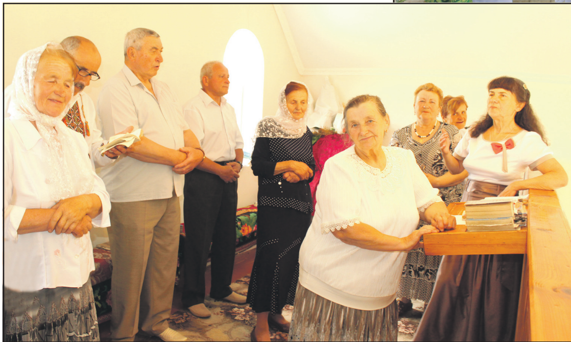
Церковний хор храму Пресвятої Трійці на масиві Гаї Чумакові.

День храмового празника церкви Пресвятої Трійці у центрі масиву Гаї Ходорівські завершили вечором молоді.