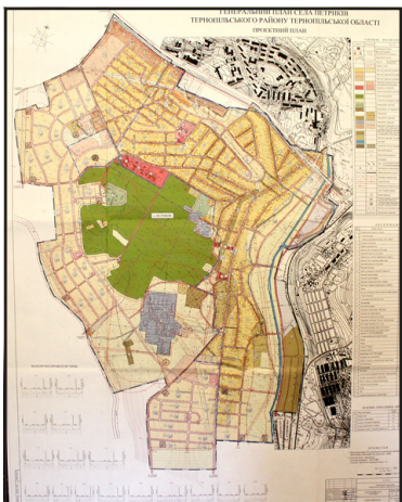
Затверджено генеральний план с. Петриків.