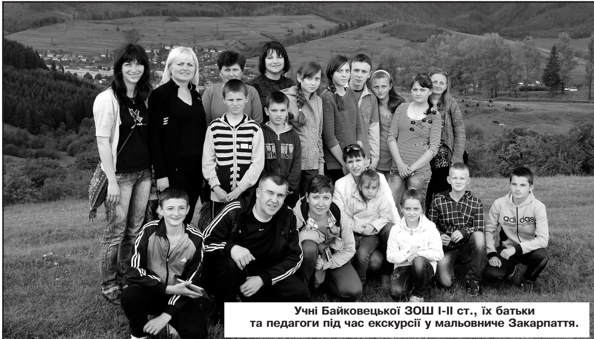
Учні Байковецької ЗОШ I-II ст., їх батьки та педагоги під час екскурсії у мальовниче Закарпаття.