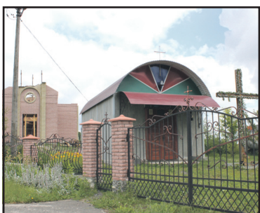
"Гаї Чумакові: кроки зростання" — у випуску "Байківці і байківчани".