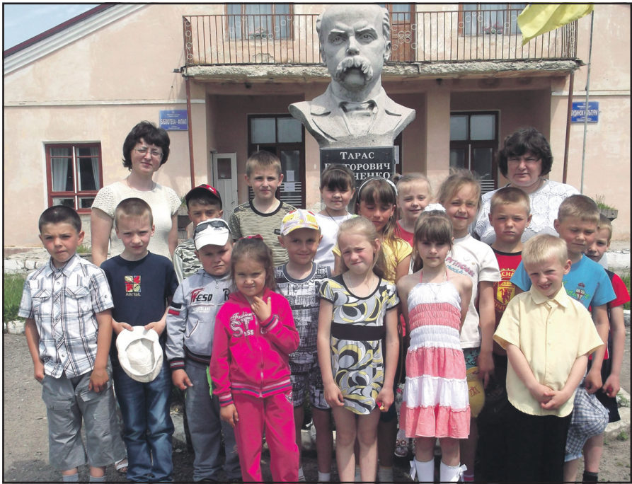
Учні початкових класів та педагоги загальноосвітньої школи І ст.- дитячого садка с. Забойки відвідали місцеву бібліотеку-філію.

Маленькі відвідувачі побували у великих просторих приміщеннях читального залу і книжкового фонду, побачили книжкові виставки, "полічиці-цікавинки", "полічки-поради", полічки із новинками літератури. Учнів 1-2 класів найбільше зацікавили періодичні видання "Барвінок", "Зайчик", "Зернятко". Учні 3-4 класів краще сприймали інформацію про абетковий, систематичний каталог, краєзнавчу і систематичну картотеку статей, дізналися про роль каталогів у роботі бібліотеки. Корисним для них стало ознайомлення з книжково-ілюстраційною виставкою "Відкрий для себе рідний край" про культуру, мистецтво, літературу, знаних земляків, зокрема, гордість Тернопільського району — співачку Солюмію Крушельницьку.