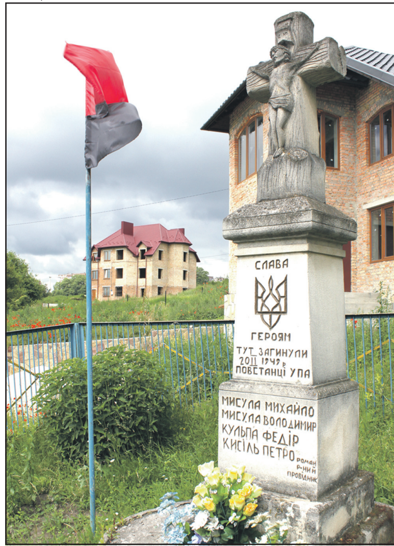
Пам'ятник загиблим повстанцям УПА.