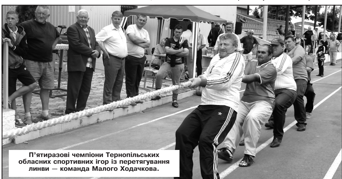
П'ятиразові чемпіони Тернопільських обласних спортивних ігор із перетягування лінви – команда Малего Ходачкова.