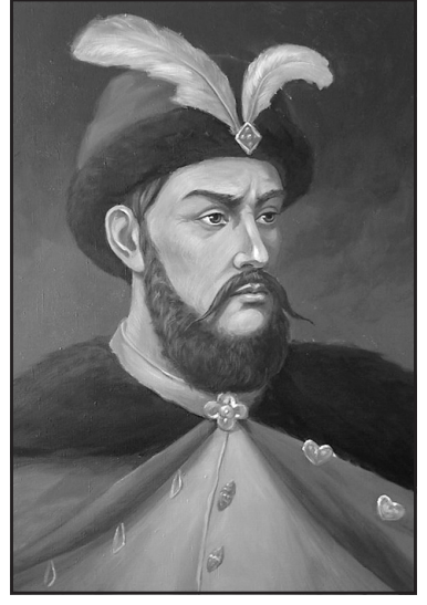
Гетьман Петро Дорошенко.

у Чернігові українські театральні вистави. Доля молодшої лінії роду Дорошенків, члени якої називалися ще й Никоновими, також була пов'язана з Гетьманщиною. Григорій і Василь, сини Никона, молодшого сина гетьмана Михайла, 1676 року переїхали з Правобережжя до Янпільської сотні Батуринського полка. Там опинилися і нащадки їхнього брата Якова. Дорошенки осідали село Дорошівку і Дорошенків хутір та увійшли до складу місцевої сотенної старшини. З них Василь був янпільським