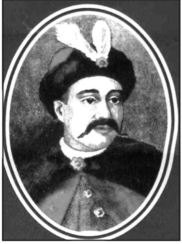
Засновник роду гетьман Михайло Дорошенко.

ту по створенню університетів у Кам'янці-Подільському та Києві, Всеукраїнської бібліотеки (нині — Національна бібліотека України ім. Вернадського), Української опери тощо. Саме Петро Якович був офіційним наступником гетьмана Скоропадського на випадок його смерті, тяжкої хвороби чи перебування за кордоном. Заслуги Дорошенка були настільки значущими і загально визнаними, що після повалення гетьманату Директорія залишила за ним керівництво згаданим Управлінням. У складі українського уряду Петро Якович переїхав до Вінниці, згодом до Одеси, де в липні 1919 р. його розстріляли більшовики.