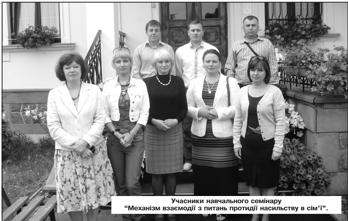
Учасники навчального семінару "Механізм взаємодії з питань протидії насильству в сім'ї".