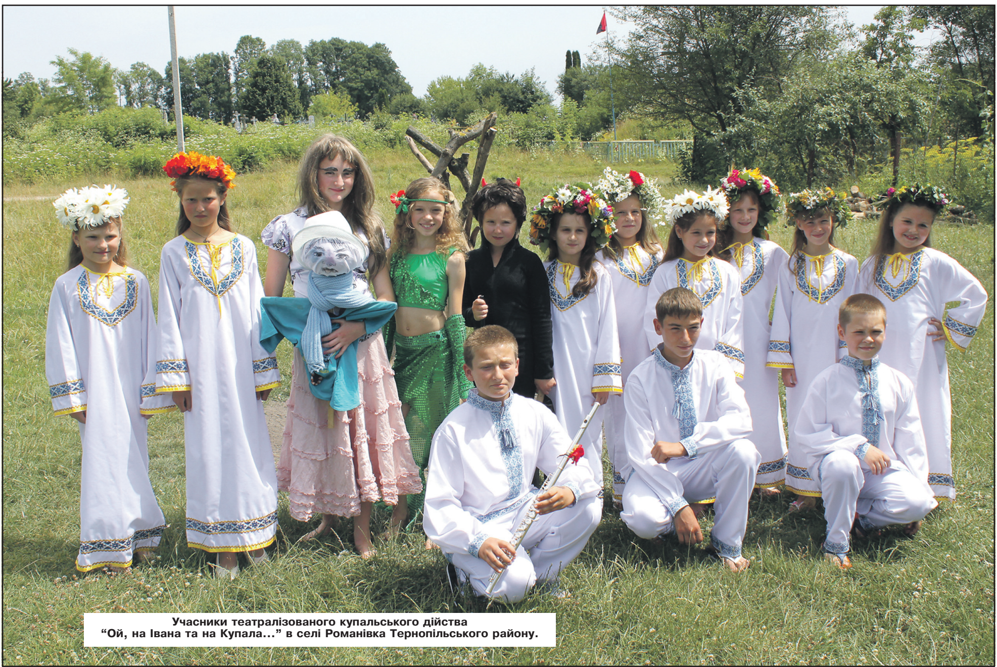
Учасники театралізованого купальського дійства "Ой, на Івана та на Купала..." в селі Романівка Тернопільського району.