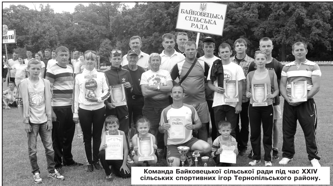
Команда Байковецької сільської ради під час XXIV сільських спортивних ігор Тернопільського району.