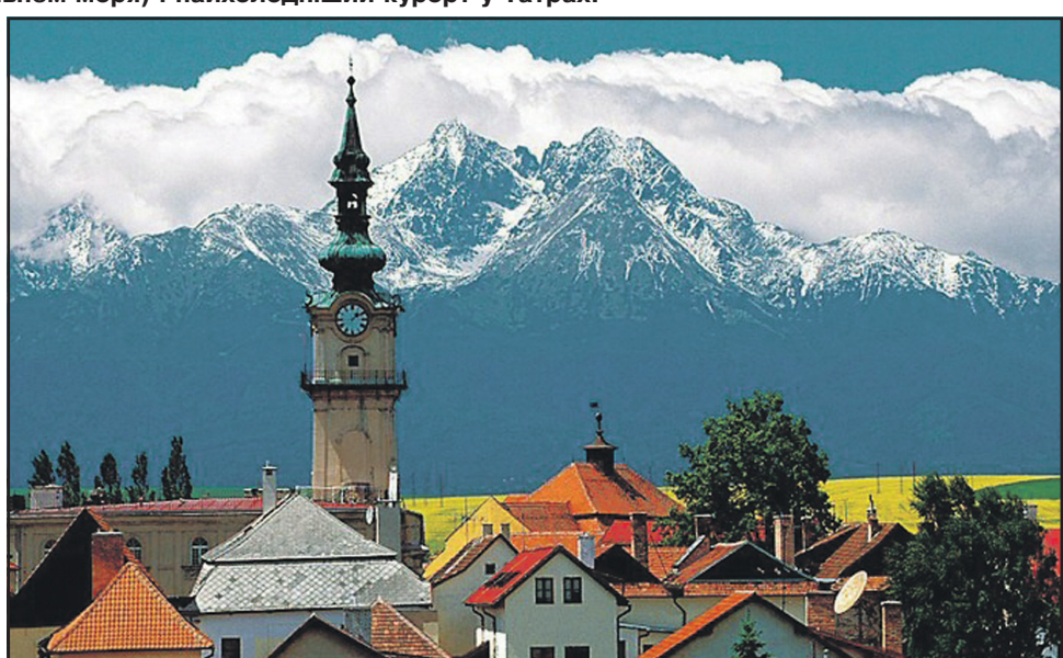
Панорама словацького міста Попрад на фоні гір Татр.

вузол Словаччини, вважається "брамою" у Високі Татри. Тут народився чинний президент Словаччини Андрій Кіска. Саме на околиці Попраду виготовляють пральні машини "Whirlpool". У місті працює 16 дитсадків, 12 початкових шкіл, 13 середніх шкіл, 4 гімназії, тут розташовані філії чотирьох факультетів трьох словацьких університетів. Мова спілкування – словацька, німецька. До слова, німецька мова у Євросоюзі користується більшим авторитетом, ніж англійська.