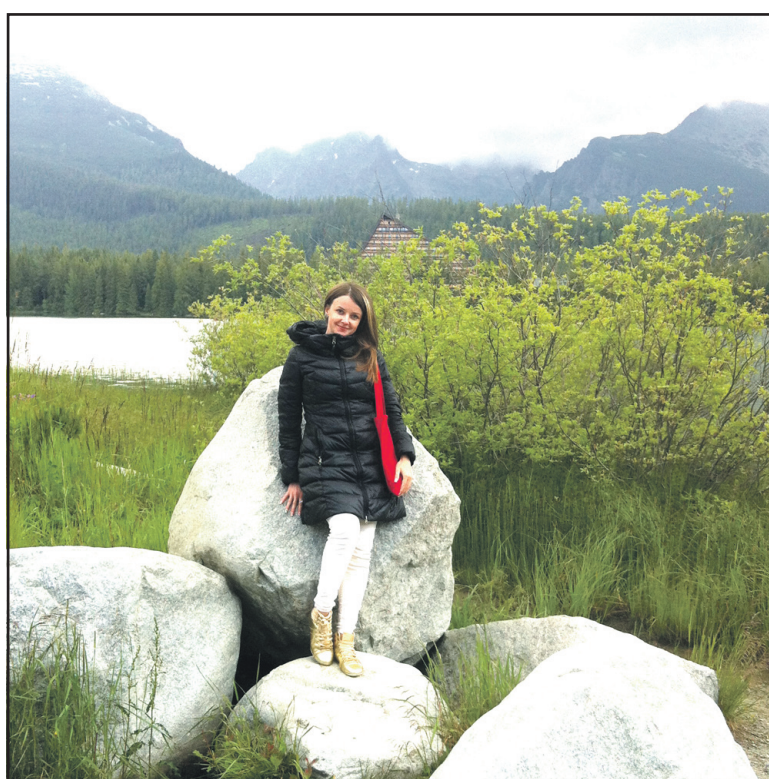
На території Штребського плеса в Словаччині – найвищий (1350 м над рівнем моря) і найхолодніший курорт у Татрах.

Раніше Попрад був селом, але після розпаду Чехословаччини у 1993 році на Чехію і Словаччину, Словаччина обрала напрямком туристичної розбудови, з часом Попрад отримав статус міста. Саме завдяки зміні політики відкриття віз, тобто збільшення видачі віз для українців, тут так багато наших туристів. Нині Попрад – важливий туристичний центр і транспортний