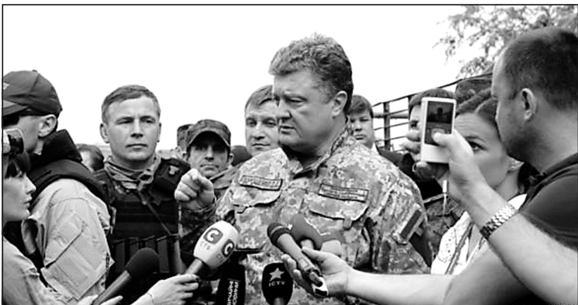
Президент України Петро Порошенко у Слов'янську.