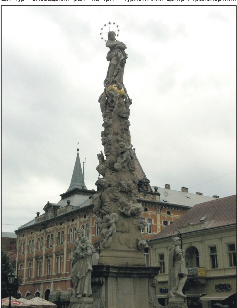
Поширений в країнах Східної Європи тип сакрального пам'ятника – Чумний стовп, встановлений на честь припинення чуми на головній вулиці другого за величиною міста Словаччини – Кошице.

Висновок про подорож: мандрівкою задоволена, мрію, щоб українці взяли приклад у словацьких сусідів і таки розпочали "жити по-новому".