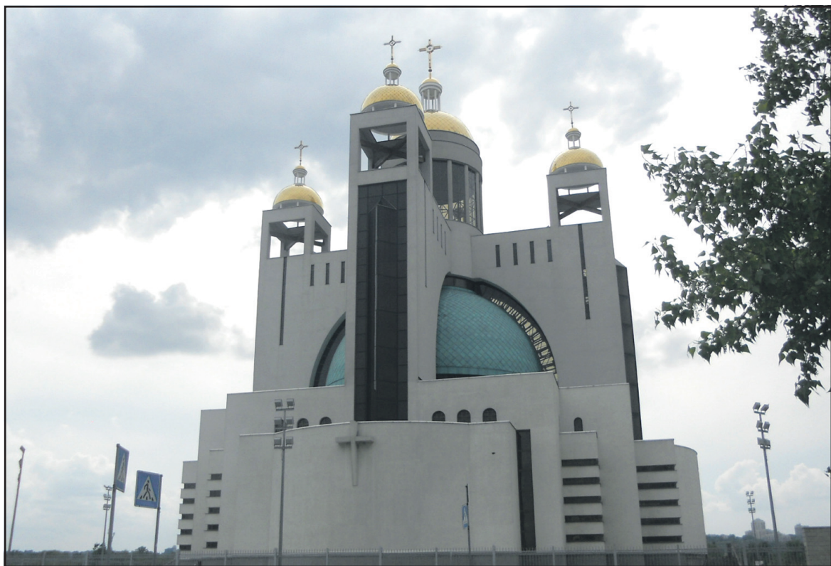
Патріарший Собор Воскресіння Христового УГКЦ — на лівому березі Дніпра у Києві.

Управління Пенсійного фонду України в Тернопільському районі просить отримувачів пенсій своєчасно повідомляти органи, що призначають та виплачують пенсію, про прийняття на роботу, звільнення з роботи, зміни в складі сім'ї, зміни місця проживання та інші обставини, що можуть вплинути на пенсійне забезпечення. Тел. для довідок: 53-50-72, 53-51-54.