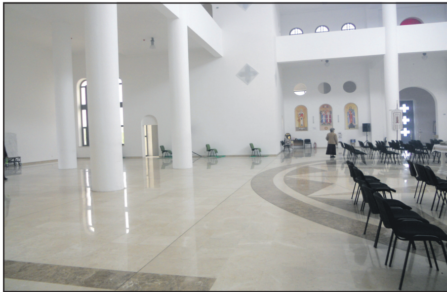
Середній храм Патріаршого Собору вміщає 1,5 тисячі вірян.