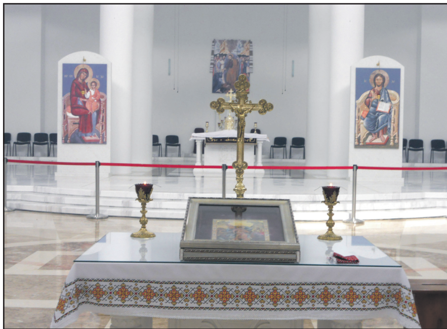
Горне місце — Небесний престол Христа.

10 жовтня 2004 р. було освячено та встановлено п'ять хрестів Собору. В освяченні взяли участь усі єпископи УГКЦ чотирьох континентів світу. Того дня був піднятий і встановлений найбільший хрест