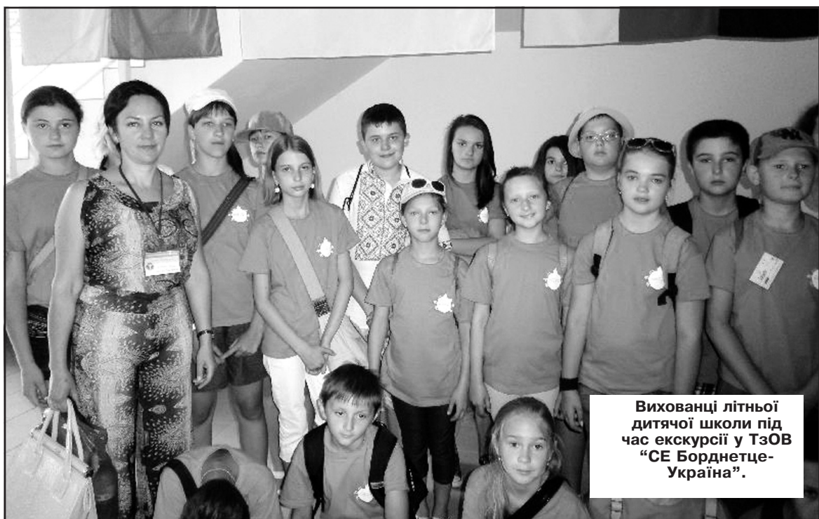
Вихованці літньої дитячої школи під час екскурсії у ТзОВ "СЕ Борднетце-Україна".