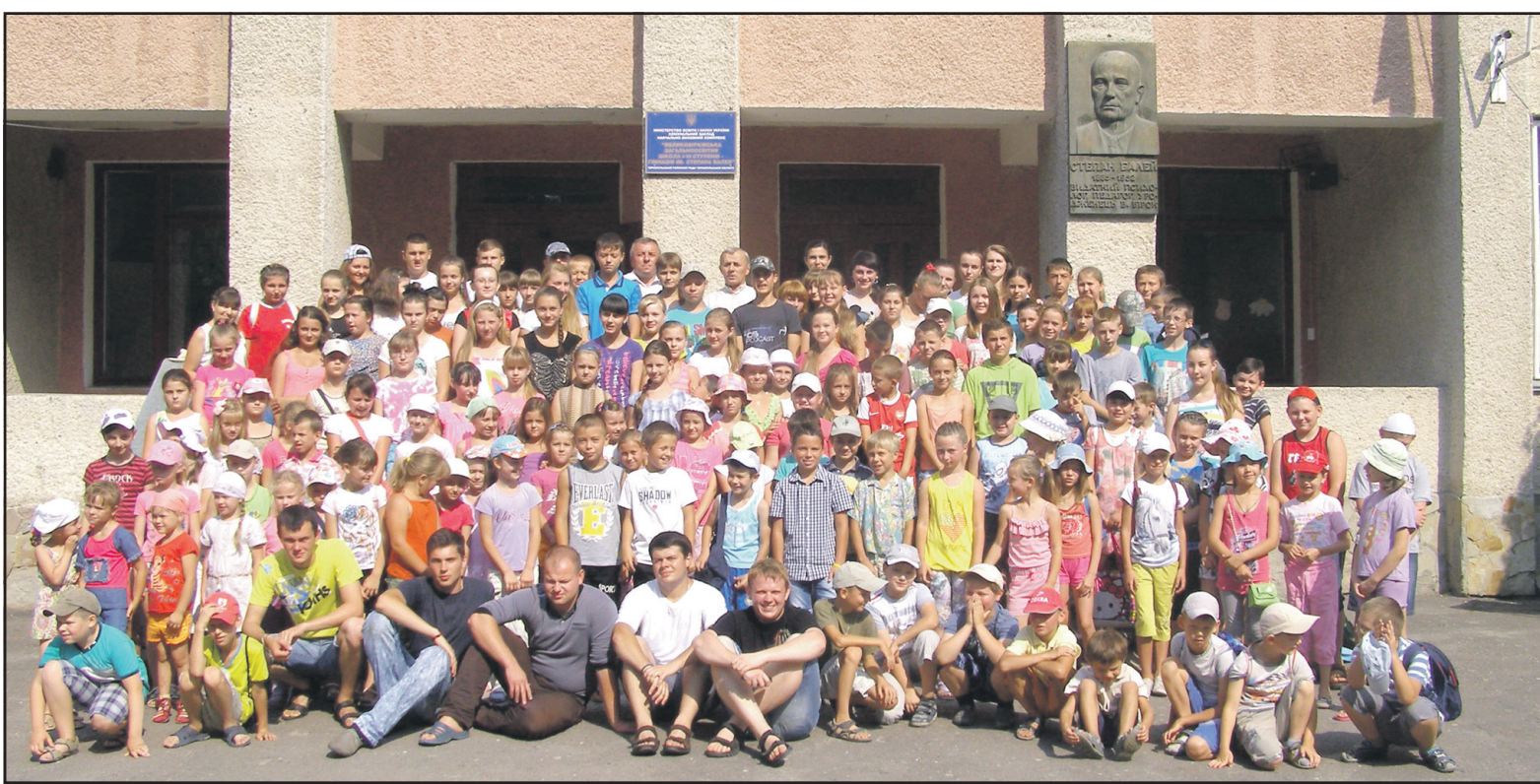
Учасники "Веселих канікул з Богом" на подвір'ї НВК "Великоб'рківська ЗОШ I-III ступенів — гімназія імені Степана Балея".