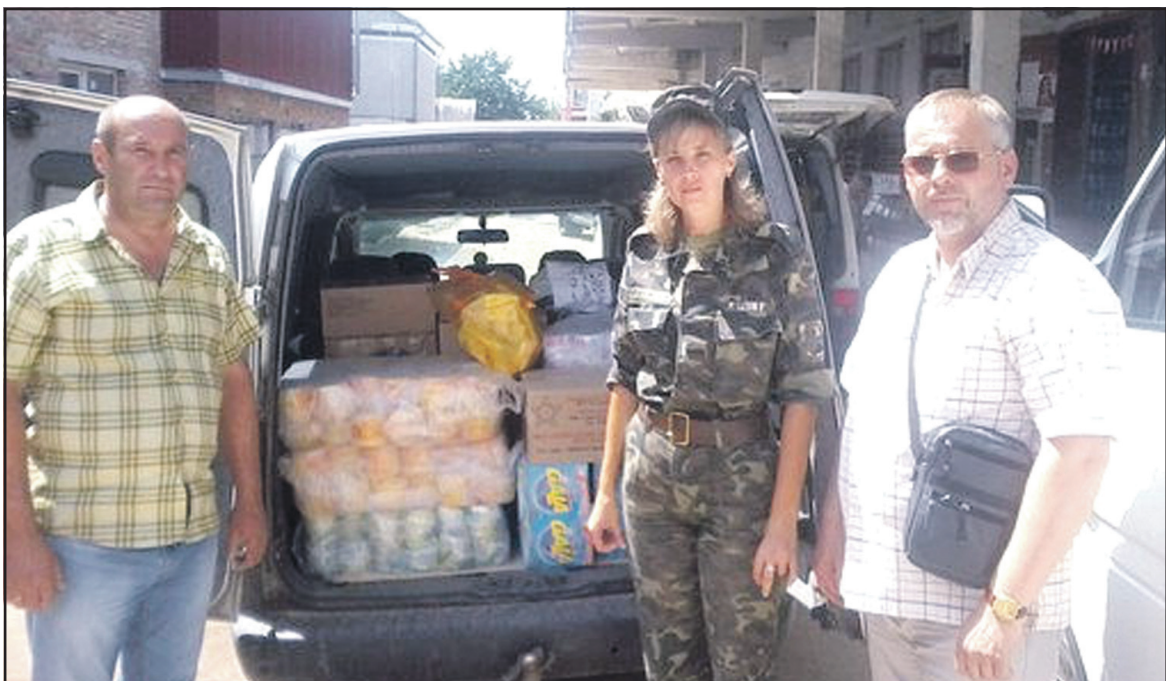
29 липня ц. р. з Тернополя виїхав автобус із предметами першої необхідності та харчовими продуктами для батальйону територіальної оборони Тернопільської області, який перебуває в східних регіонах України.

Діти відпочивали та оздоровлювалися протягом 21 дня в дитячому стаціонарному оздо-