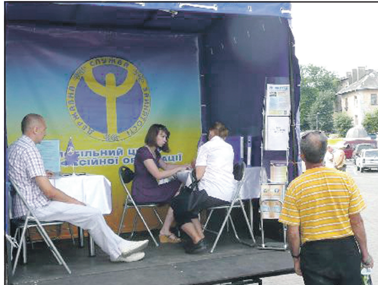
Мобільний центр МРЦЗ на території залізничного вокзалу станції "Тернопіль".

Не залишилися без уваги питання інших громадян, зокрема, про можливість працевлаштування осіб з обмеженими можливостями. Усі бажаючі отримали інформаційні буклети та листівки. З більш детальною інформацією можна ознайомитись у найближчих центрах зайнятості або скористатись можливостями інтернет-ресурсів служби зайнятості ( http://www.dcz.gov.ua , http://www.trud.gov.ua ).