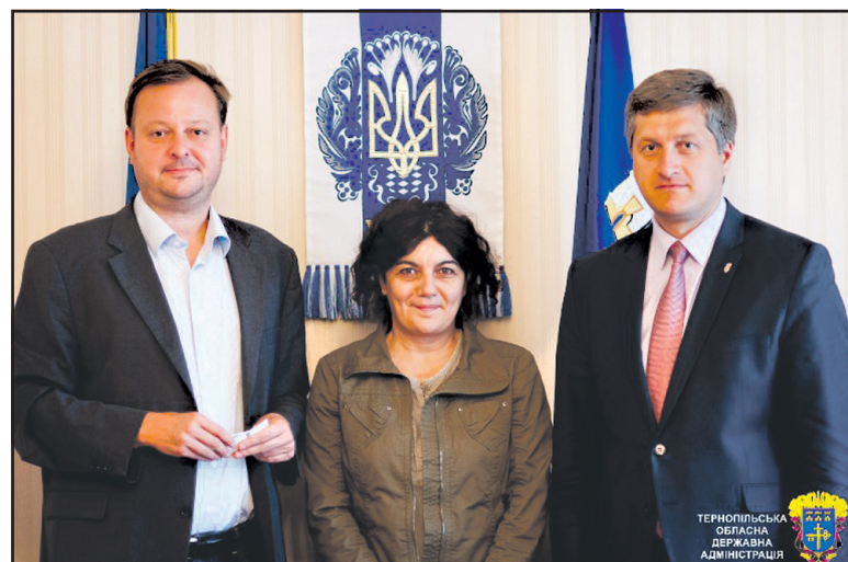
Голова Тернопільської ОДА Олег Сиротюк (справа) з представниками ОБСЄ.