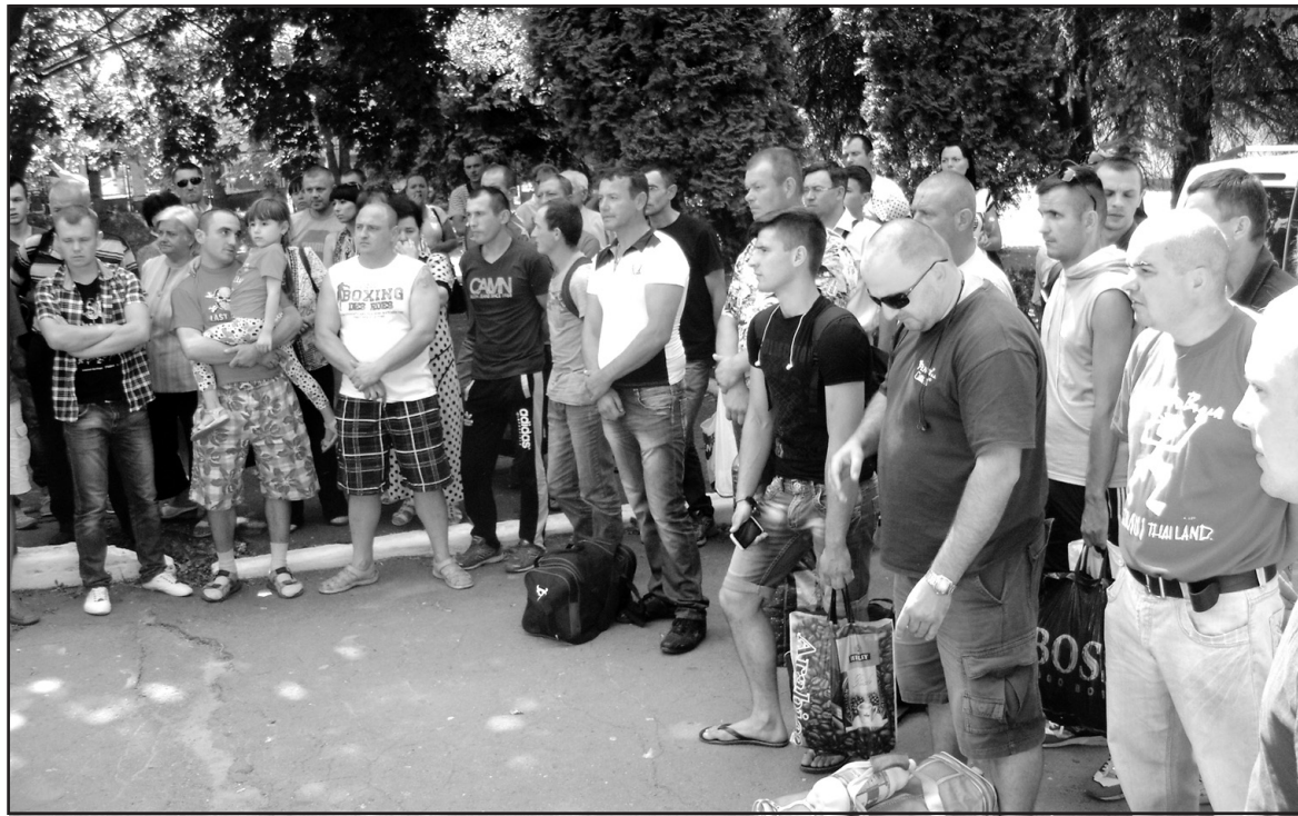
Мобілізованих Тернопільщини відправляють на навчання у військові частини Збройних сил України.

— У першу чергу викликають у військкомат фахівців, які проходили військову службу. Серед їх числа є багато добровольців, які свідомо йдуть захищати Вітчизну. Всі мобілізовані відправляються у військові навчальні частини, де проходять бойове зладження, відновлюватимуть свої військові навички. Хочу заспокоїти рідних і близьких, що на цей час жодного