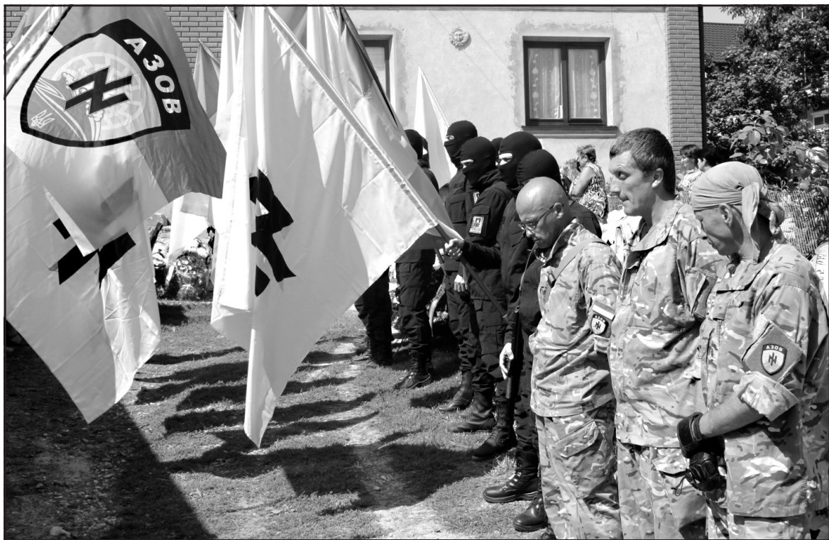
Бійці спецбатальйону МВС України "Азов" прибули у Великий Глибочок провести в останню дорогу свого бойового побратима.