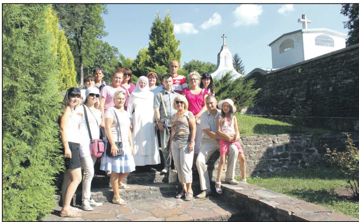
Працівники управління з експлуатації майнового комплексу Тернопільської обласної ради на території монастиря Сестер Непорочно Зачаття Пресвятої Діви Марії у Язлівці Бучацького району.

Мури і будівлі цих величезних споруд, цілючі джерела поряд з ними, що б'ють життєдайною водою, природа та щирість людей у цих місцинах викликають неймовірні відчуття, створюють неповторний настрій, залишають теплі спогади на все життя. Якщо ви хочете подорожувати, почніть зі святих місць. Гортаючи сторінки історії козацької звитяги, навчаючись шанувати минуле, торкаючись сакральних пам'яток, надихаючись на дальший духовний розвиток і самовдосконалення, а це те, чого маємо навчитися прийдешні покоління.