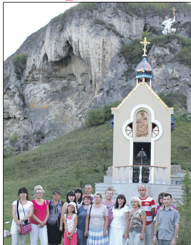
Учасники екскурсії біля підніжжя Травертинових скель в Рукомиші Бучацького району.

Рукомиш — це одне цікаве місце в околицях Бучача. Це маленьке село з населенням всього 400 мешканців, відоме завдяки давньому скельному монастирю на березі річки Стрипа. Вважається, що перші монахи з'явилися тут наприкінці XIII століття, рятуючись від татаро-монгольської навали, що охопила Київську Русь. Начебто тоді на вершині гори ченці збудували капличку Св. Бориса і Гліба і видовбали дві печери: одну — для богослужіння, іншу — для помешкання. Місце, в якому знаходиться монастир, це так звані Травертинові скелі — величезне родовище травертину — матеріалу, придатного для виробництва облицювальних виробів. Родовище відкрили працівники тресту "Київгеологія" у 1975 році, але, враховуючи значення місця для місцевих мешканців, розро-