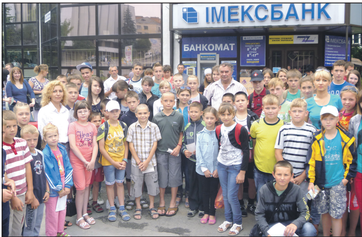
Школярі Тернопільського району та їх наставники на площі Героїв Євромайдану в Тернополі перед відправленням в оздоровчий табір.