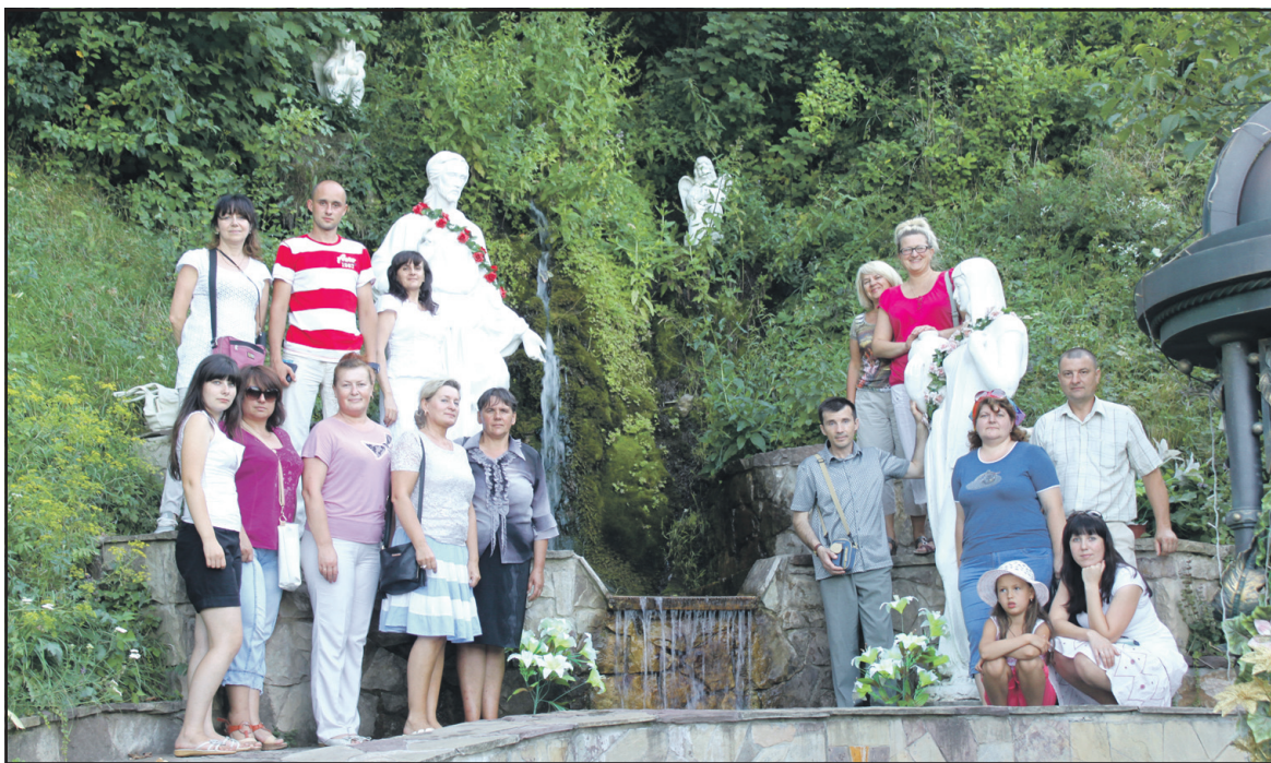
Природне джерело і водоспад біля скельного монастиря XIII ст. у с. Рукомиш Бучацького району.