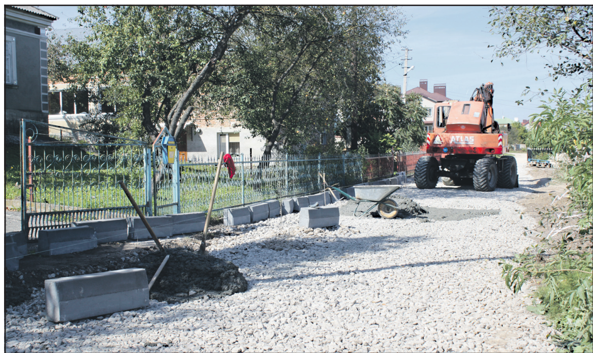
Триває капітальний ремонт вулиці Трудова у с. Байківці.