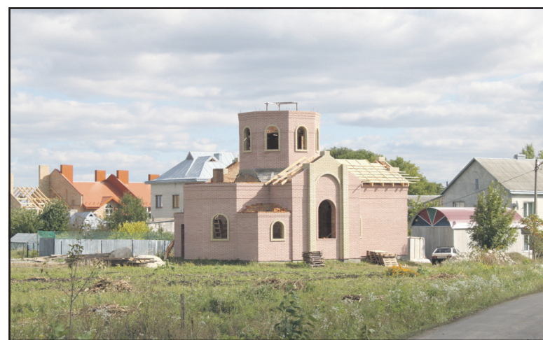
У церкві Преображення Господнього на масиві Гаї Чумакові в Байківцях завершують перекриття даху.