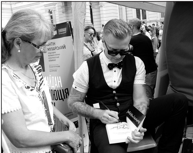
Письменник, актор і телеведучий Антін Мухарський під час автограф-сесії на подвір'ї Палацу Потоцьких у Львові, 12 вересня 2014 року.

шкода, що зараз немає стратегічного бачення повернення Криму до складу України. Поряд із цим Рефат Чубаров зазначив: “Можливо, нашому суспільству доведеться ще більше себе обмежувати. Вся країна має відчувати себе у стані війни. Здійснювати заходи в єдиному пориві”.