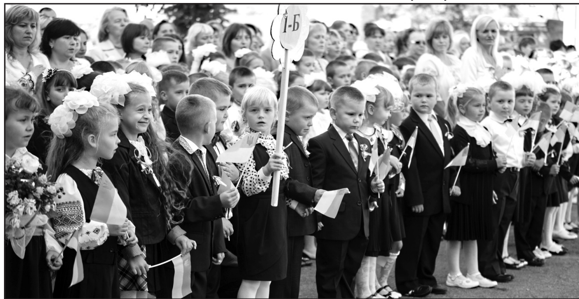
Першокласники Великогаївської ЗОШ I-III ст. на урочистій лінійці з нагоди ПершOVERесня.