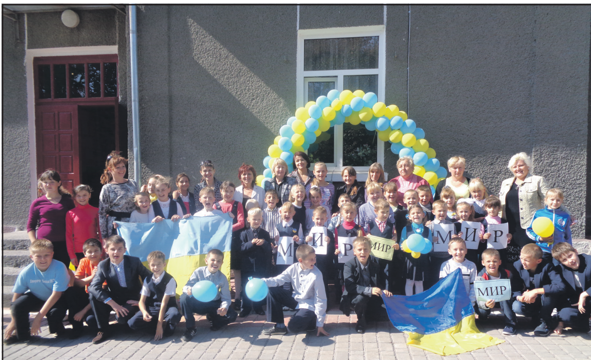
Учні та вчителі Байковецької школи відзначили Тиждень миру.