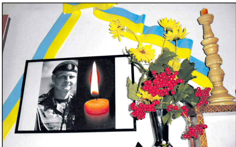
Куточок пам'яті Володимира Гарматія у Жовтневій школі.