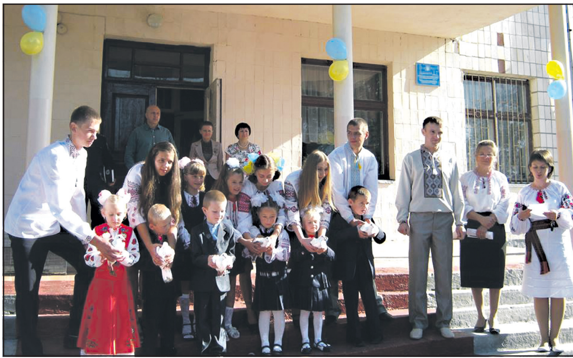
1 вересня учні Довжанківської ЗОШ I-III ст. випустили в небо білих голубів.