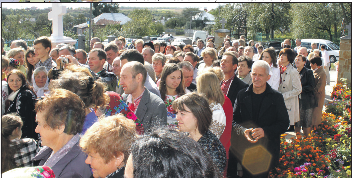
Під час освячення води на подвір'ї церкви Різдва Пресвятої Богородиці.