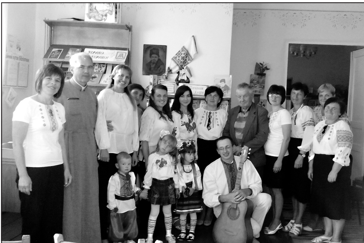
Учасники громадського форуму "Незалежність, демократія, воля — паралель між минулим і сучасним України" у бібліотеці-філії с. Забойки.