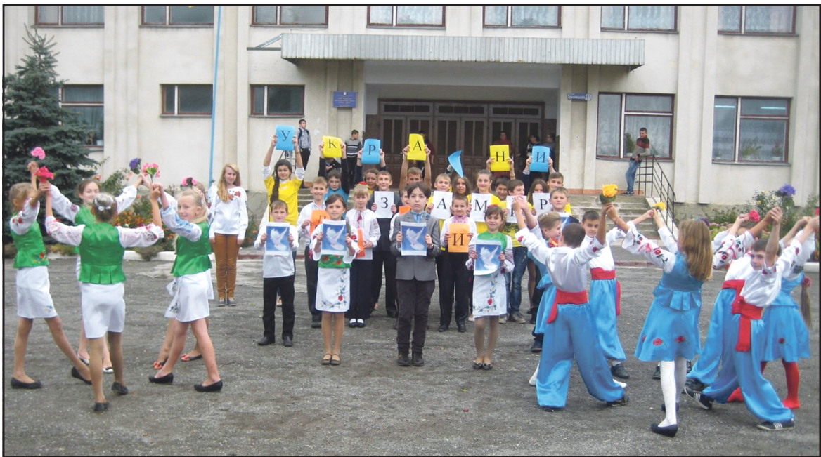
Лідери учнівського самоврядування НВК "Лозівська ЗОШ І-ІІІ ст. — ДНЗ", учасники та організатори флешмобу "Діти України за мир".

Голубко біла, ти лети у світ, Хай буде мир у небі голубому! Неси всім щастя, передай привіт Ти нашим хлопцям, що на сході.