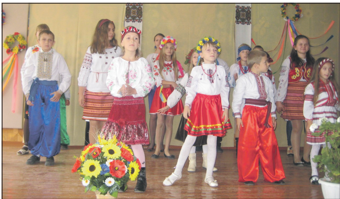
Учасники конкурсу українського національного костюма "У нашому краї цвітуть вишиванки" у НВК "Лозівська ЗОШ І-ІІІ ст. — ДНЗ".