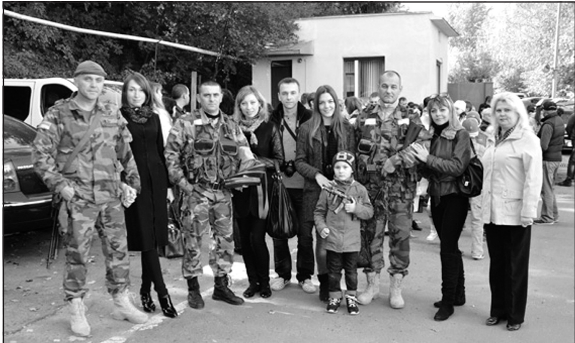
Учасники АТО з Тернополя зі своїми рідними і близькими.

Усі бійці, які повернулися із зони АТО, вважають, що за ці останні місяці Україна та українці дуже змінилися. Люди згуртувалися і нарешті зрозуміли, що все в цьому житті залежить від них самих, усе в їхніх руках.