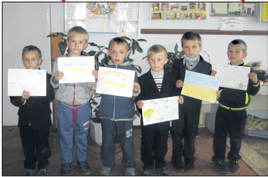
Учні 1-го класу створили малюнки солдатам на передовій.

Людина створена природою для миру, а не для війни, народже- на для радості, а не для горя... Франсуа Рабле.