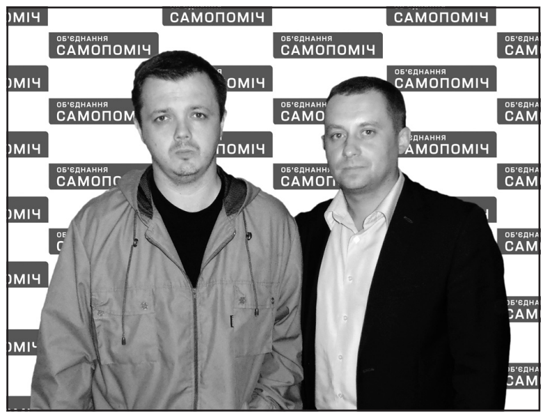
Легендарний командир батальйону “Донбас” Семен Семенченко (зліва) підтримує на цьогорічних парламентських виборах кандидата в депутати до Верховної Ради України по 165 виборчому округу Олега Захарківа.

Як зазначив Семен Семенченко, нині кожен повинен бути готовим захищати Україну та свою сім'ю. “Ми проводимо оперативні курси військової справи, формуватимемо на місцях добровольчі партизанські загони, — зазначив Семен Семенченко. — До речі, з ініціативи Олега Захарківа