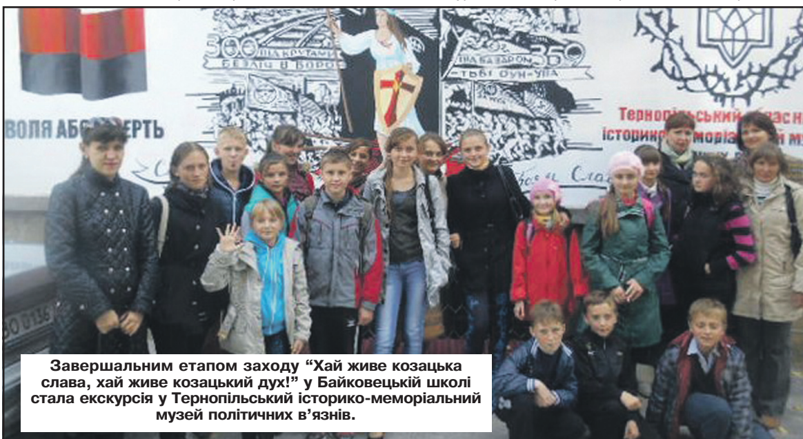
Завершальним етапом заходу "Хай живе козацька слава, хай живе козацький дух!" у Байковецькій школі стала екскурсія у Тернопільський історико-меморіальний музей політичних в'язнів.