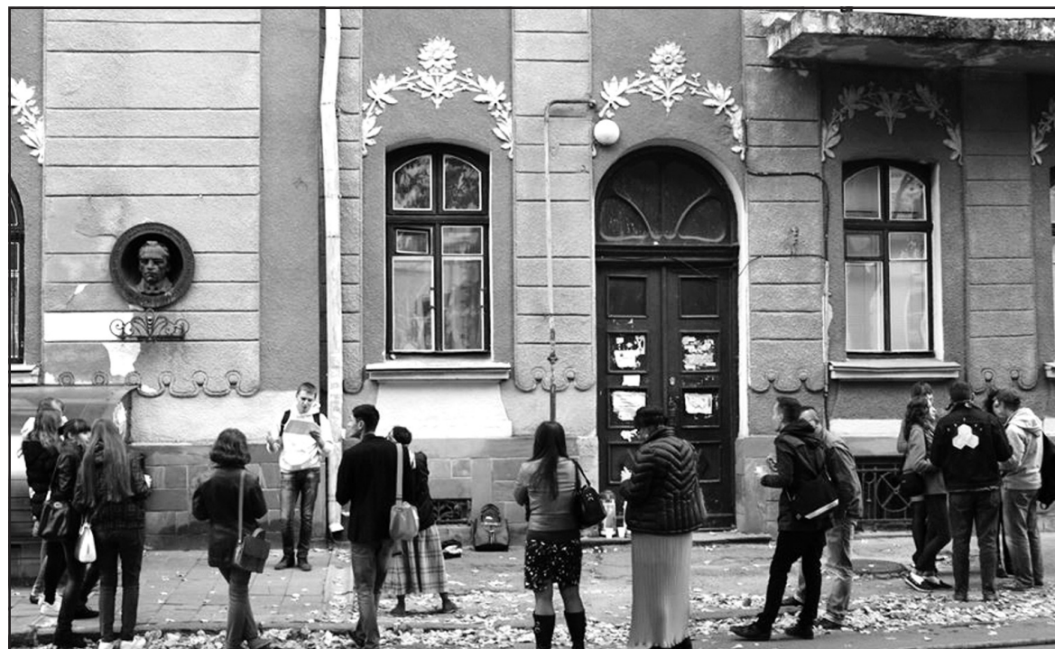
У цьому будинку на вул. Камінна, 1, у м. Тернополі 8 жовтня 1884 р. народився письменник Юліан Опільський.

А було все так. Надвечір 8 жовтня журналісти, письменники, поети, творча молодь Файного міста прийшли (хоч і не зовсім чисельно, але зацікавлено — ред.) на попередньо оголошений у мережі Facebook "Пікнік з Опільським". Локація заходу — біля будинку, де рівно 130 років тому народився Юліан Опільський, за адресою: вул. Камінна, 1. Кожен отримав віддруковані уривки з творів Юліана Опільського, теплий чай і печиво. Вшанували пам'ять Опільського не традиційними сумними промова-