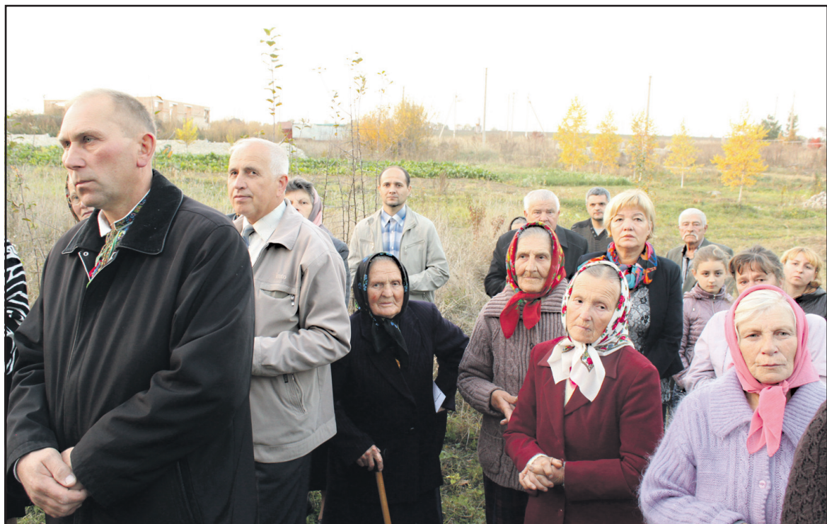
Громада с. Байківці під час панахиди.