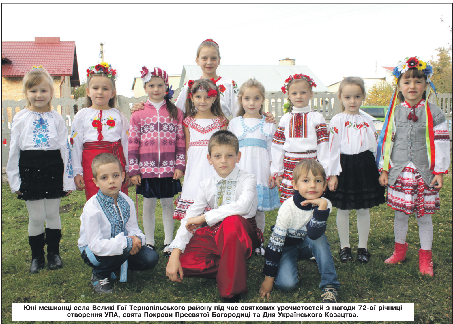
Юні мешканці села Великі Гаї Тернопільського району під час святкових урочистостей з нагоди 72-ої річниці створення УПА, свята Покрови Пресвятої Богородиці та Дня Українського Козацтва.