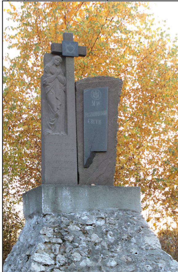
Пам'ятник учаснику Української Повстанської Армії Євгену Розвадовському на північній околиці масиву Гаї Ходорівські в Байківцях.

Порошенко своїм указом переніс святкування Дня захисника України з 23 лютого на 14 жовтня. Покров Богородиці є символом і покровом борців за незалежну Україну, яку, на жаль, знову доводиться захищати ціною людських життів. У наших силах тут сьогодні є звернення з молитвою, щоб Божа Мати простягла свій Покров над нашою вільною, незалежною, соборною Українською державою.