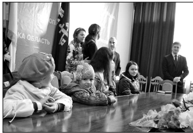
Голова Тернопільської обласної державної адміністрації Олег Сиротюк та заступник голови ОДА Леонід Бицюра під час зустрічі з дітьми, переселеними із зони АТО.