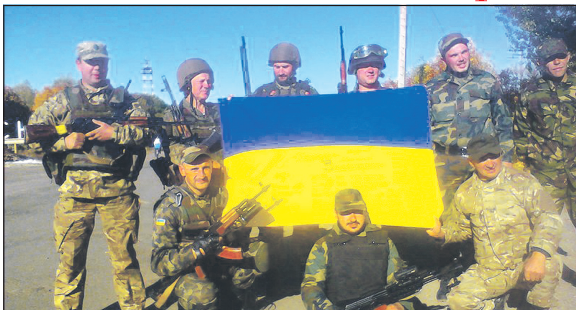
Активісти волонтерського руху "Руслан".