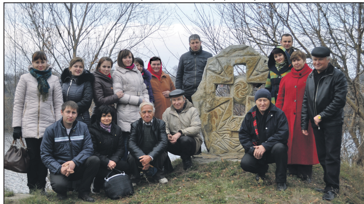
Вчителі фізики Тернопільського району біля пам'ятного знака примирення українського та польського народів, м. Липовець Вінницької області.

ний економічний університет), яка розповіла про те, що училище готує робітничі кадри за 11 інтегрованими професіями, є центром освітнього округу, науково-методичною лабораторією, яка здійснює пошук, розробку, впровадження нового змісту та технологій освіти і виховання, сприяє творчому розвитку особистості. В училищі щорічно навчаються в середньому 750 учнів, з якими працюють 116 викладачів та майстрів виробничого навчання. Відрадно, що тут мають змогу здобувати освіту діти з особливими потребами, до послуг яких сучасна навчально-методична база, довідчені педагоги, перекладачі-дактилологи, психологи, соціальні працівники. В училищі забезпечено рівний доступ усіх учнів для здобуття якісної професійної підготовки. У 2009 році заклад отримав звання "Флагман освіти України". Він є активним учасником міжнародних, всеукраїнських, обласних конференцій, виставок і конкурсів.