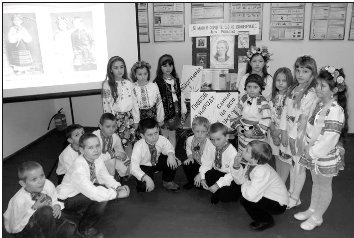
Виховна година “Я маю в серці те, що не вмирає” у Дубівецькій ЗОШ І-ІІ ст., присвячена 143-й річниці від дня народження Лесі Українки.