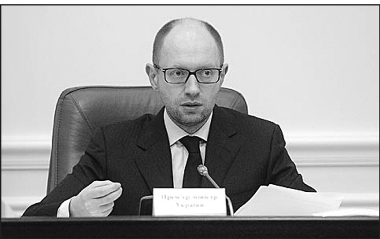
Прем'єр-міністр України Арсеній Яценюк: "Децентралізація влади – це масштабна реформа, спрямована на збереження єдності та унітарності України, яка передає на місця – в області, міста і райони – якнайширший обсяг повноважень і грошових ресурсів, необхідних для розвитку регіонів".