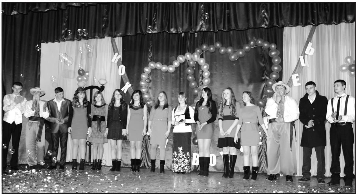
Учасники свята з нагоди Дня святого Валентина на сцені будинку культури с. Забойки.