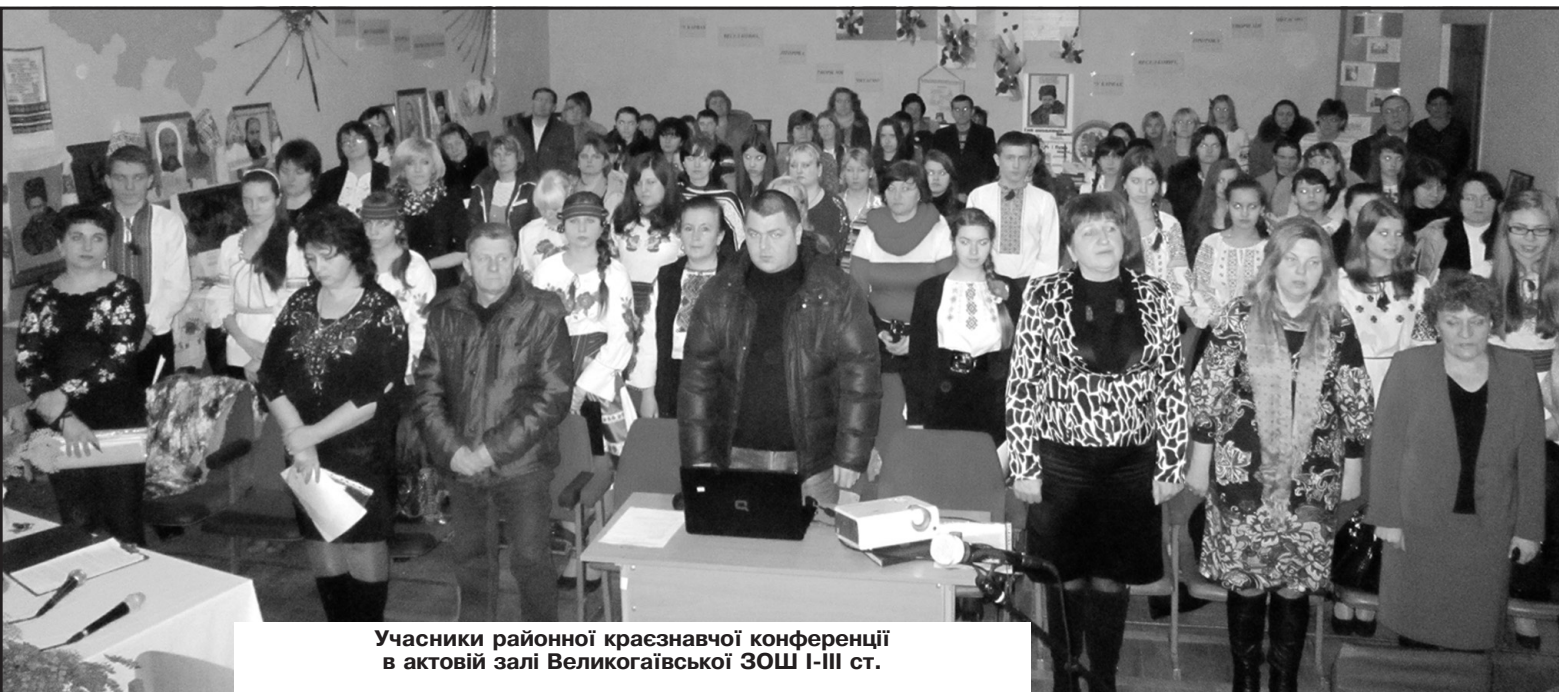
Учасники районної краєзнавчої конференції в актовій залі Великогаївської ЗОШ І-ІІІ ст.

Зичимо здоров'я, щастя, довголіття, Настрою веселого на повне століття, Щоб життя було веселим, радісним, багатим, І щоб кожен день прожитий Вам здавався святом.