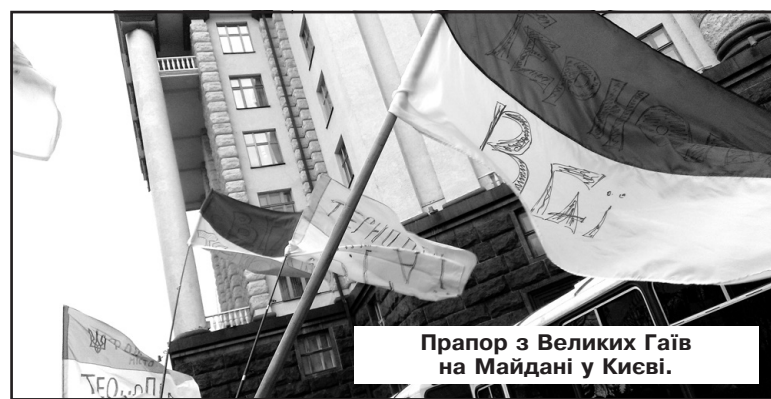
Прапор з Великих Гаїв на Майдані у Києві.

У це важко повірити, але прапор України — реліквія нашої сім'ї — повернувся... додому. У грудні наші сини поїхали на Євромайдан у Київ. Взяли з дому велике полотнище синьо-жовтого стягу. Коли через деякий час поверталися назад, прапор залишили на площі, щоб нагадував усім про село Великі Гаї. Ще й маркером зверху написали: "Тернопіль — Великі Гаї". Уявіть собі, вчора на в'їзді до села хтось встановив наш прапор у бардюрний виступ (його всі знають) посеред дороги. Можете уявити вираз обличчя молодшого сина, коли він там пройжджав і побачив сімейну реліквію, яка майорить на вітрі! Адже відтоді минуло трохи часу... Полотнище ще й досі пахне димом. Але яка це для нас тепер дорога святина. Після Великого Українського Жалю за полеглими було таке відчуття, що додому повернулася рідна дитина. Слава Україні! Героям слава!