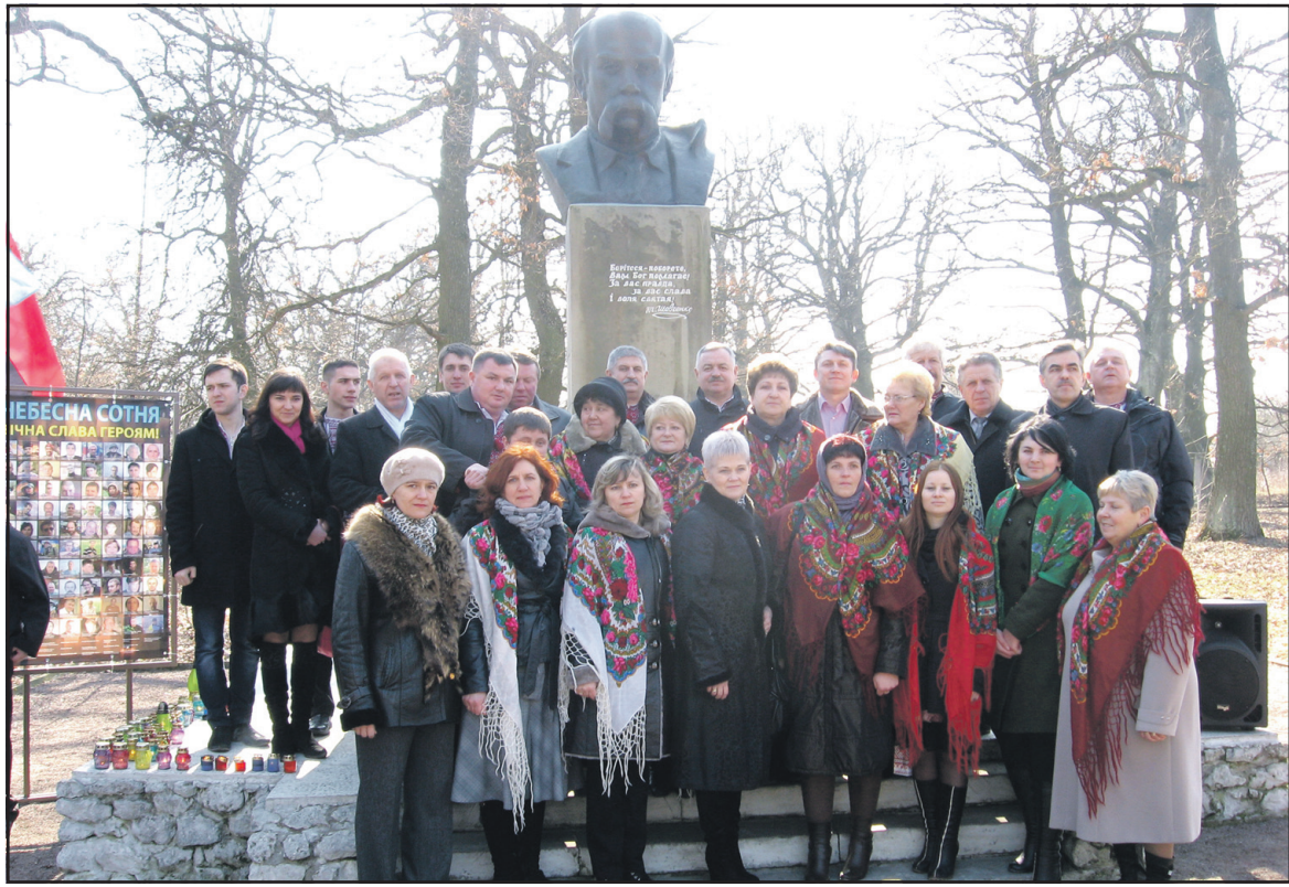
Учасники відзначення 200-річчя з дня народження Тараса Шевченка у Великих Гаях.