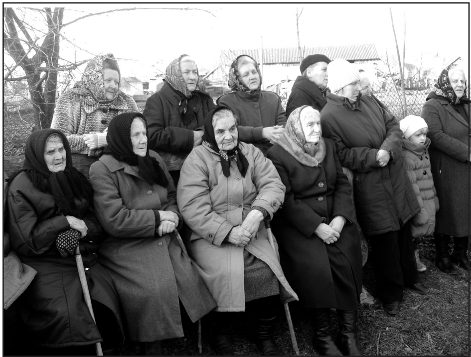
Це важлива подія для старшого покоління баворівчан.