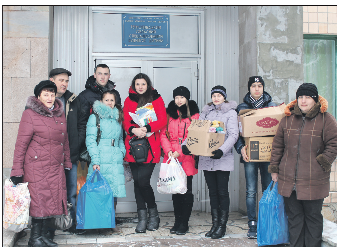
Учні 11 класу Острівської ЗОШ І-ІІІ ст. разом зі своїми наставниками відвідали Тернопільський обласний спеціалізований будинок дитини.