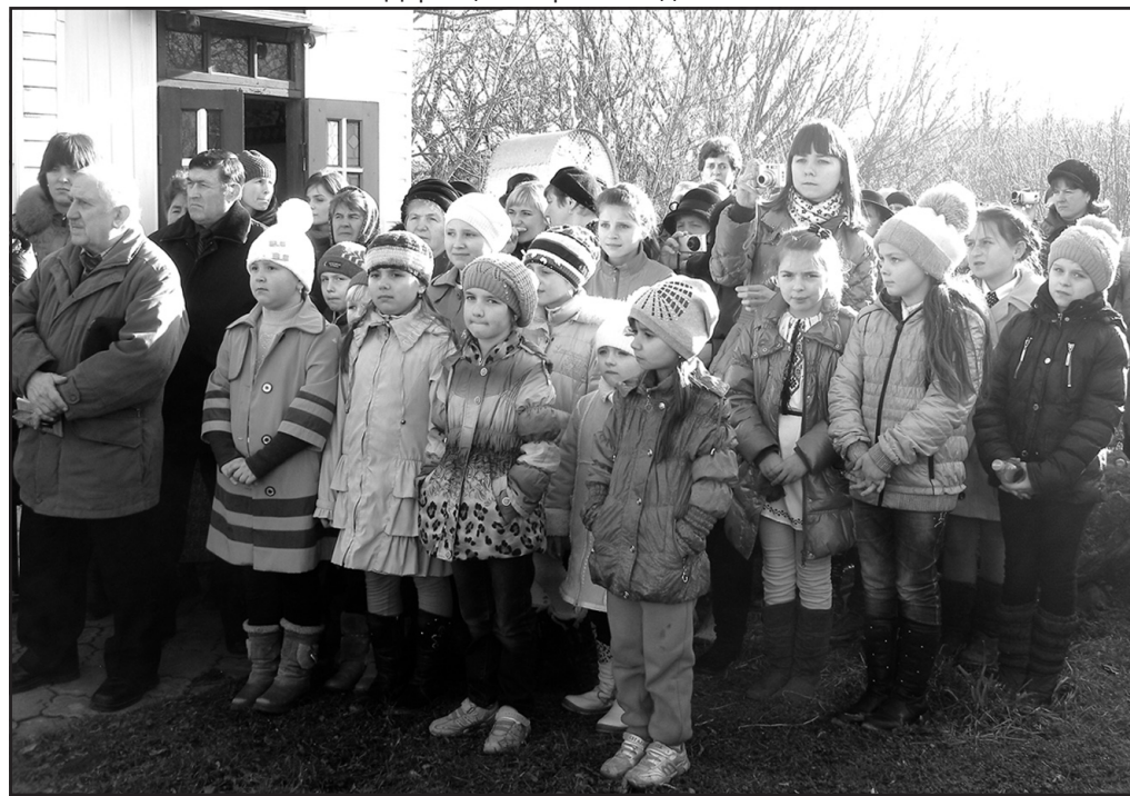
Юні учасники та глядачі.