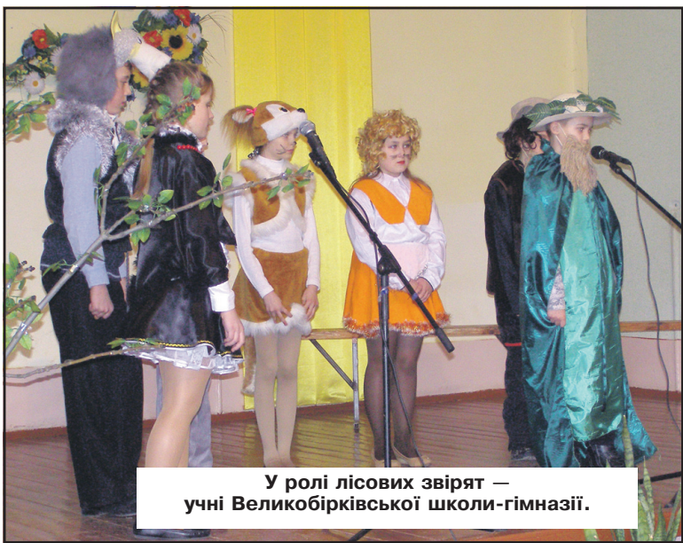
У ролі лісових звірят — учні Великобірівської школи-гімназії.