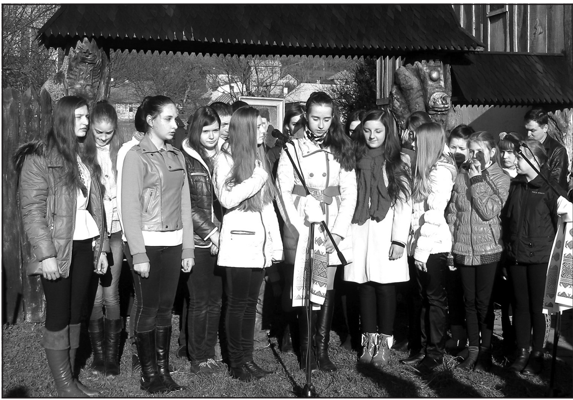
Вірші та пісні на слова Тараса Шевченка виконують учні Баворівської школи.

На завершення шевченківського свята баворівчани виконали гімн "Ще не вмерла Україна". До підніжжя пам'ятника Великому Кобзарю вдячні нащадки поклали букети живих квітів і запалили свічки пам'яті.