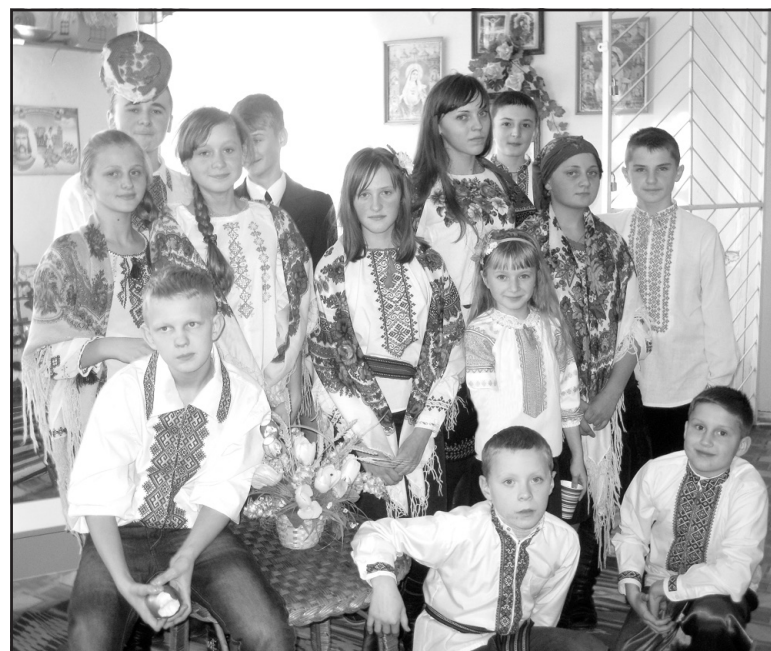
Учасники театралізованого дійства на Андрія, учні Байковецької ЗОШ I-II ст.