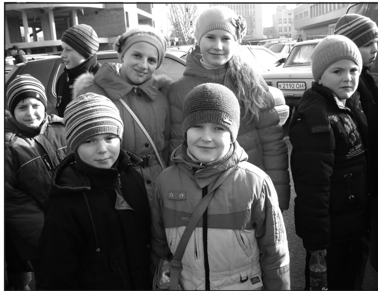
Цирк цікавий і малечі, і старшокласникам.

Малечу розважали повітряні гімнасти, "фаєрмен", "дівчина-змія", дует клоунів "Маніво", балет "Гранд", додали чудового настрою гра з хула-хупами, лазерне шоу. Під час вистави діти мали змогу побачити пітонів, гігантського папугу Ара, котів, дикобразів, яструба, блакитного пещця, лисицю, камерунських козлів, ламу, пелікана, голубів-якобінів, з захопленням подивились шоу Тауерських воронів. "Мені дуже