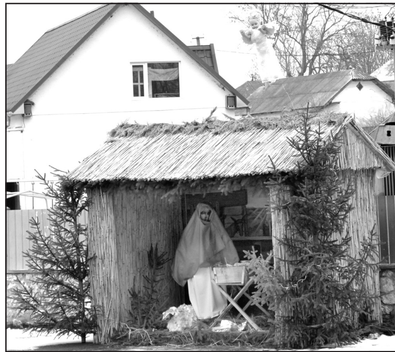
Різдвяна шопка в центрі с. Байківці.