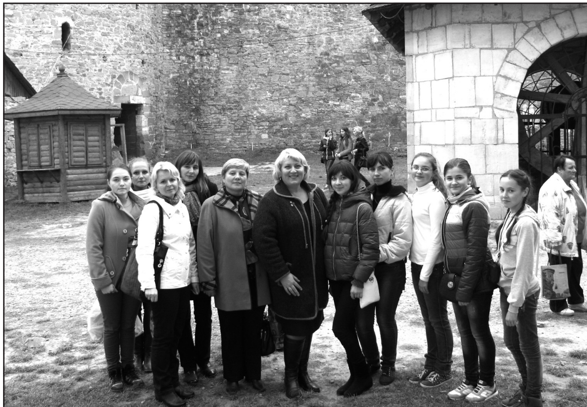
Хотинську фортецю відвідали педагоги та старшокласники Почапинської школи.

український народний герой Устим Кармелюк. У Чорній (кутовій) башті є криниця завглибшки 40 м і діаметром 5 м, видовбана у скелі.