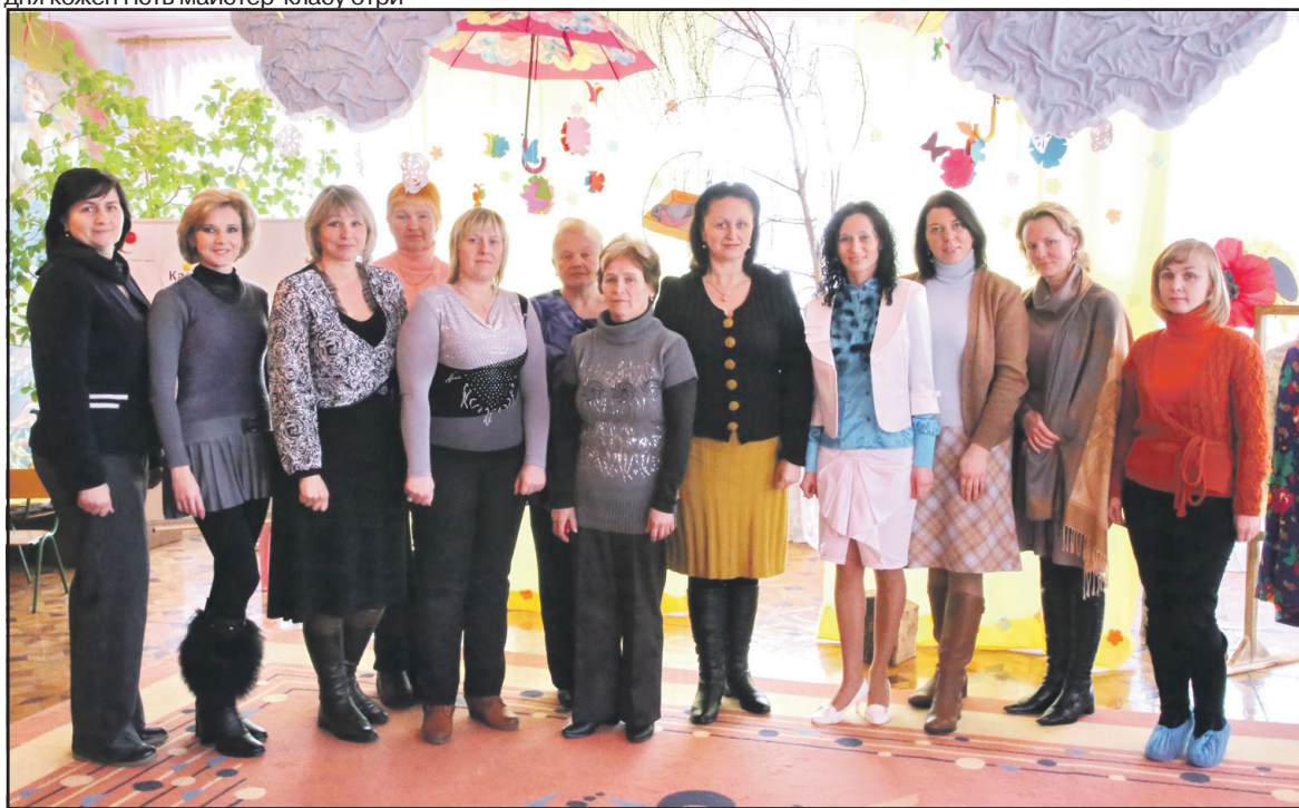
Учасники обласного семінару в дитячому садку "Теремок" с. Мишковичі.

мав у подарунок першу видану поетичну збірку Галини Бутениць "Літературні хвилини про мораль для дитини".