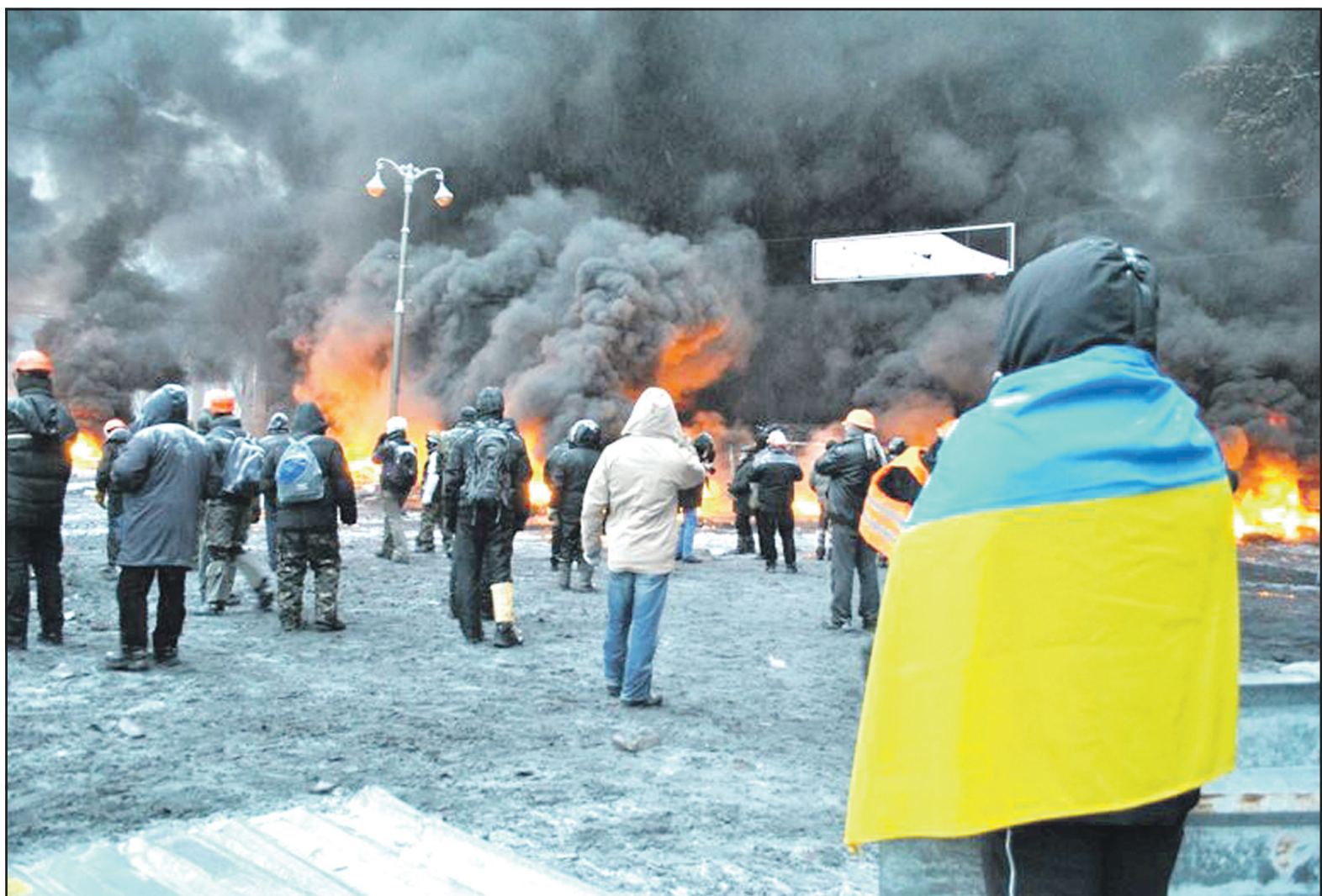
22 січня 2014 року, Київ, вулиця Грушевського.

Засідання Кабінету Міністрів уранці 22 січня, як засвідчила трансляція телеканалу СТБ, пройшло швидко. Прем'єр-міністр Микола Азаров подякував міліціонерам за правильні дії на вулиці Грушевського, сказав, що вони заслуговують похвали, матеріальних компенсацій та вирішення житлових проблем, а мітингувальників на майдані назвав "терористами" і "злочинцями". 22 січня Микола Азаров підписав постанову Кабінету Міністрів, яка дозволяє спецпризначенцям застосовувати водомети для розгону мітингів без обмежень температурного режиму і значно розширює перелік спецзасобів протидії мітингувальникам. Втім, і ті спецзасоби, які застосовували спецпризначенці під час зачистки вулиці Грушевського, є доволі ефективними: у першого вбитого лікарі констатували 3 кульові поранення в шию, одне — у голову, один — у легені; у друго-