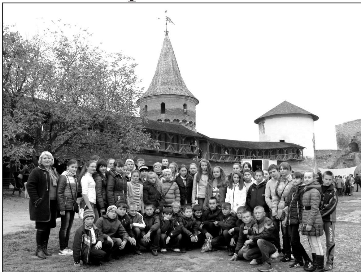
Педагоги та учні Почапинської ЗОШ І-ІІІ ст. на території Кам'янець-Подільської фортеці.

Але головною метою нашої поїздки була Стара фортеця. Це візитна картка міста. Кам'янець-Подільська фортеця є, мабуть, одним з найпопулярніших серед всіх туристичних об'єктів України. Недаремно у 2007 році вона увійшла до переможців проекту "Сім чудес України". Перші згадки про фортецю походять із XII ст. Літопис приписує будівництво кам'яного замку литовським князям Коріатовичам, які в середині XIV ст. заволодали Поділлям, а близько 1374 року зробили Кам'янець столицею свого князівства. Тому на початку XVI ст. було зведено і перебудовано 12 башт Старого замку. Безліч битв відбулось під його стінами, але лише двічі фортеця не встояла перед атаками ворогів. Цікаво, що кожна з башт Кам'янець-Подільської фортеці має свою назву й історію. Так, найвища башта названа Папською тому, що була збудована на кошті, надіслані Папою Римським Юлієм II. Ще її називають Кармелюковою, бо в ній тричі був ув'язнений