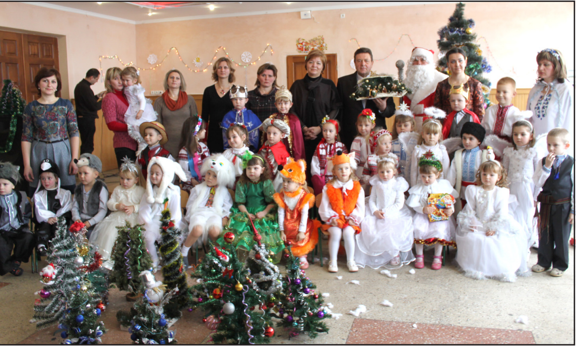
Учасники театралізованого дійства “Різдвяна казка” в будинку культури с. Байківці. 17 січня 2014 року.