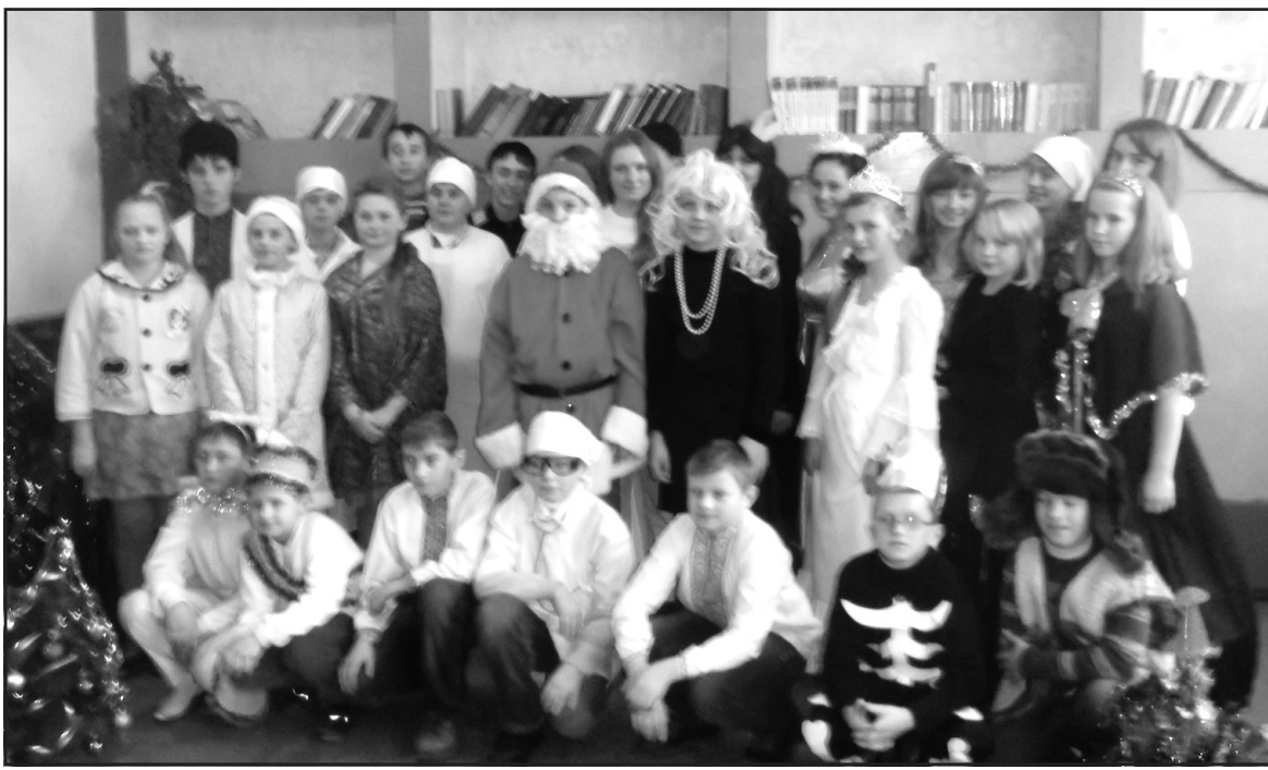
Учасники новорічного дійства в Ігровицькій ЗОШ І-II ступенів.