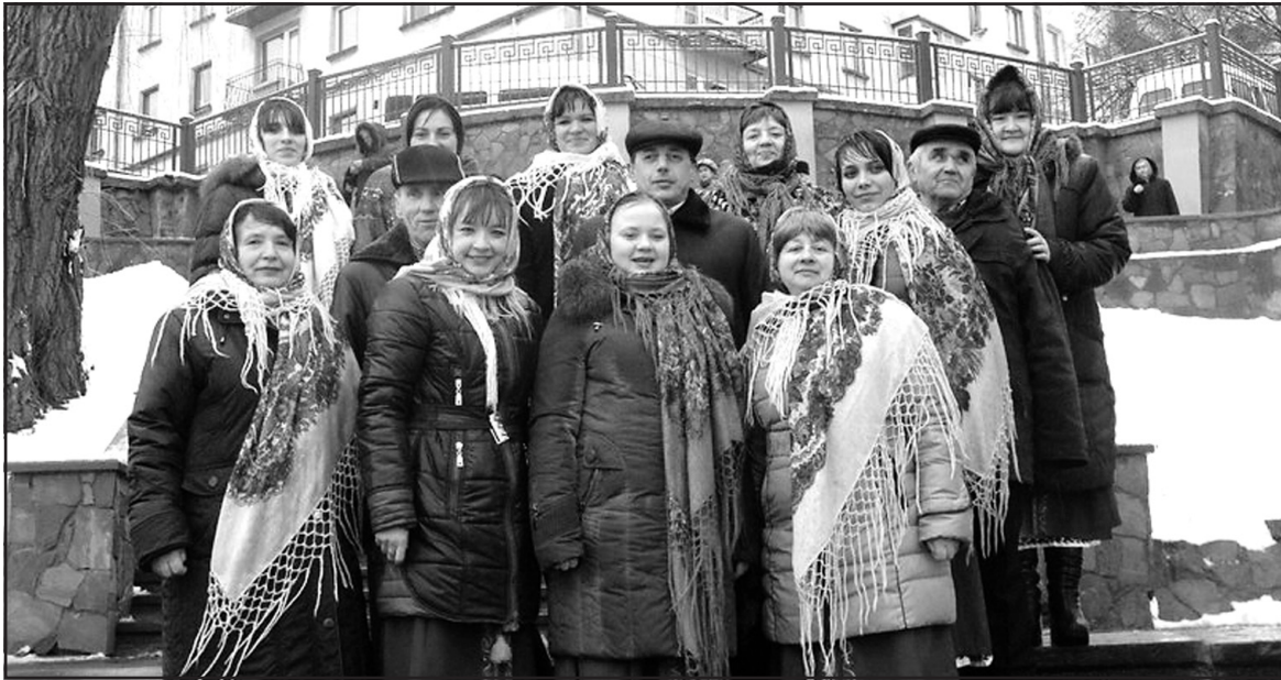
Народний самодіяльний фольклорно-етнографічний колектив "Горлиця" БК с. Лозова Тернопільського району.