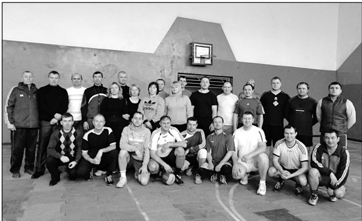
Учасники та організатори 18-тих Спортивних ігор працівників освіти Тернопільського району.