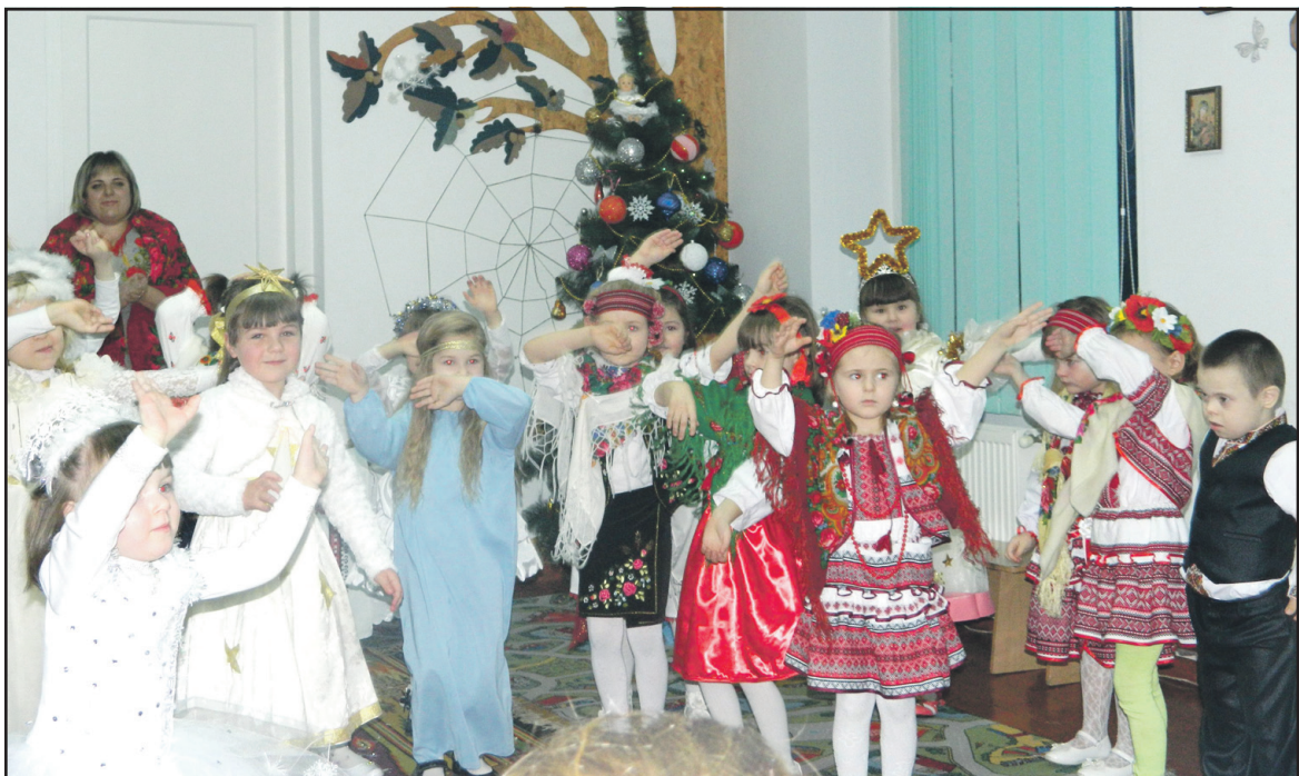
Новорічні заходи — вітха для малечі.