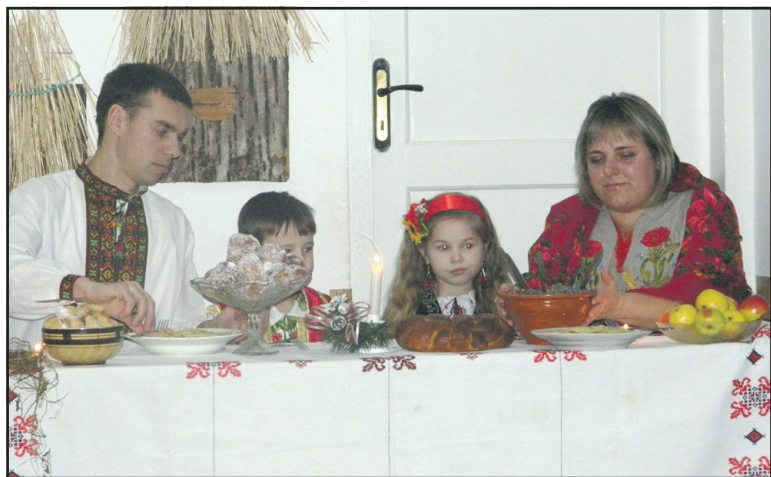
Так у "Сонечку" була відображена сцена Святої вечері.

Під час виступів діти декламували віршики, колядували, співали різдвяних пісень, танцювали і