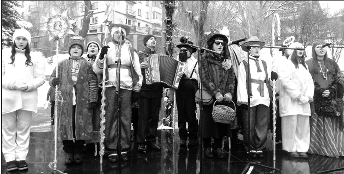
Дитячий фольклорно-етнографічний колектив із с. Чернелів-Руський.

Представники кожного району продемонстрували традиції різдвяно-новорічного циклу свят. “Хай буде благословенним Різдво Христове, хай добрі думки зійдуться вдячними справами, хай ніколи не згасає над Вашою долею і над долею України яскрава Зірка Вифлеєму” — ці добрі слова подарували присутнім ведучі свята Андрій Оленін і Леся Наконечна.