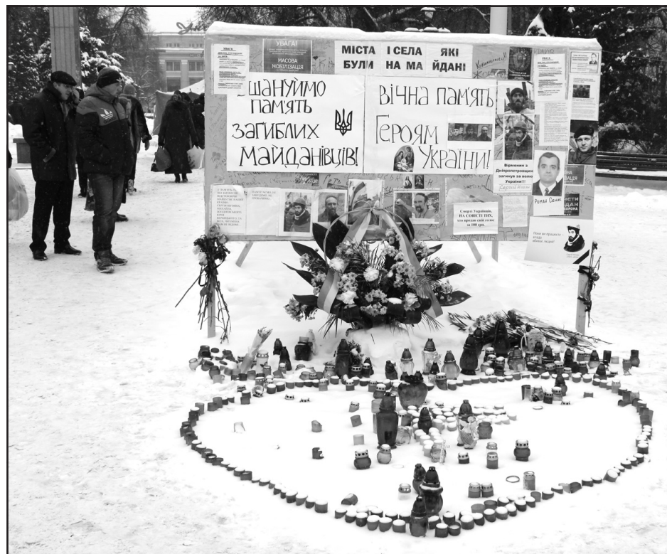
Біля "Стіни слави" на Театральному майдані в Тернополі люди запалюють свічки пам'яті загиблих на Євромайдані в Києві.

(без урахування тих людей, які опинилися в райвідділах міліції та лікарнях). Наразі, згідно з даними Євромайдан SOS, розшукується 27 осіб. Жодних зрушень у пошуках одного з лідерів Автомайдану Дмитра Булатова. Не знайшли навіть його автівки. Як заявили учасники Автомайдану, перед зникненням Булатов мав зустрітися із невідомим інформатором. Міністерство внутрішніх справ відкріло кримінальне провадження у зв'язку зі зникненням активіста. Активісти громадського руху Автомайдан за будь-які вістки про місцезнаходження свого колеги Дмитра