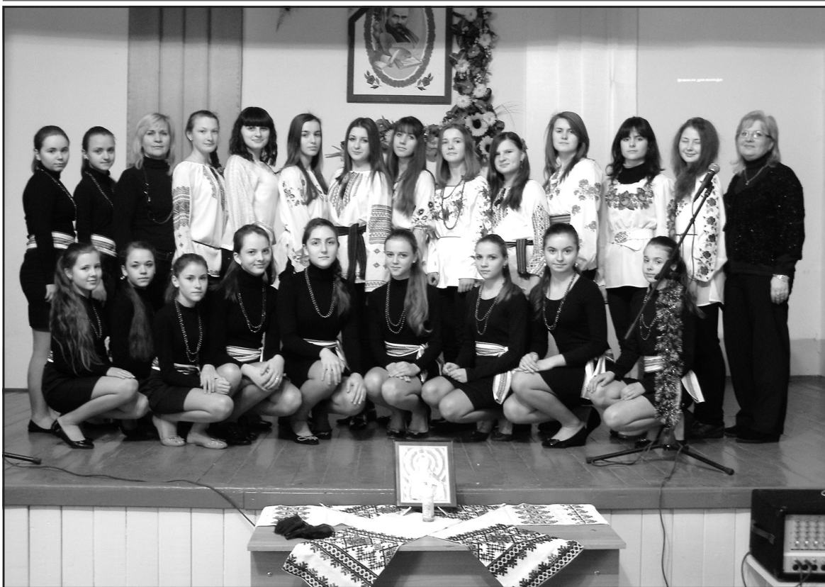
У НВК "Великобіроківська ЗОШ I-III ст.-гімназія ім. Степана Балея" старшокласники провели "Годину пам'яті Героїв Крут".