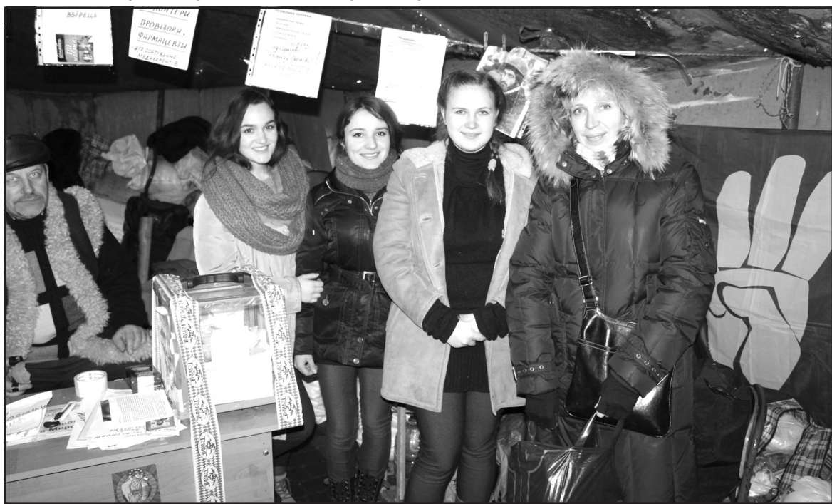
Волонтери ГО "Майдан" в Тернополі — майбутні медики.

Від 9 год. ранку суботи 25 січня, як повідомляє оголошення на дверях, цілодобовий прийом громадян у приймальні голови Тернопільської райдержадміністрації проводять депутати Тернопільської обласної ради, районної і сільських рад". Як зазначив депутат Тернопільської обласної ради Мирон Кузик, громада Тернопільського району має змогу поставити питання своїм обранцям та отримати на них відповіді. "Відбувається процес повернення народовладдя в Україні, — зазначив Мирон Кузик. — Після безчинств, які вчиняв і продовжує чинити владний режим, повстала вся Україна. Сьогодні кожен повинен засвідчити свою громадянську позицію".