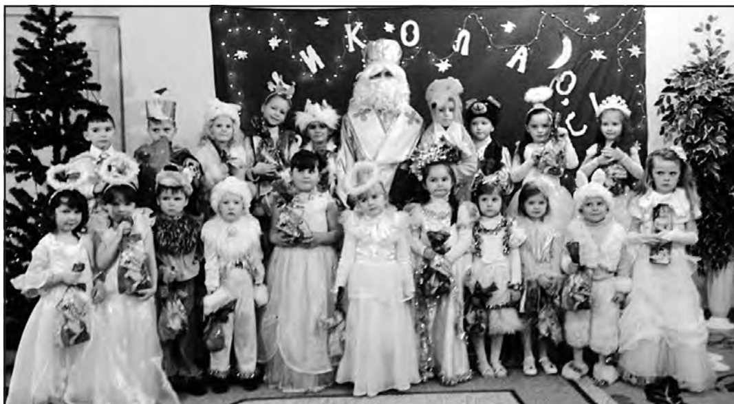
Так у Малоходачківському дитячому садку "Сонечко" зустрічали Миколая.

Малюки Малоходачківського дошкільно-го закладу "Сонечко" теж із нетерпінням чекали Дня святого Миколая. До цього свята вихователі, батьки та діти готувалися заздалегідь. Вихователі дитячого садка розробили сценарії святкових ранків для молодшої та старшої груп "Миколаю, прийді до нас!"