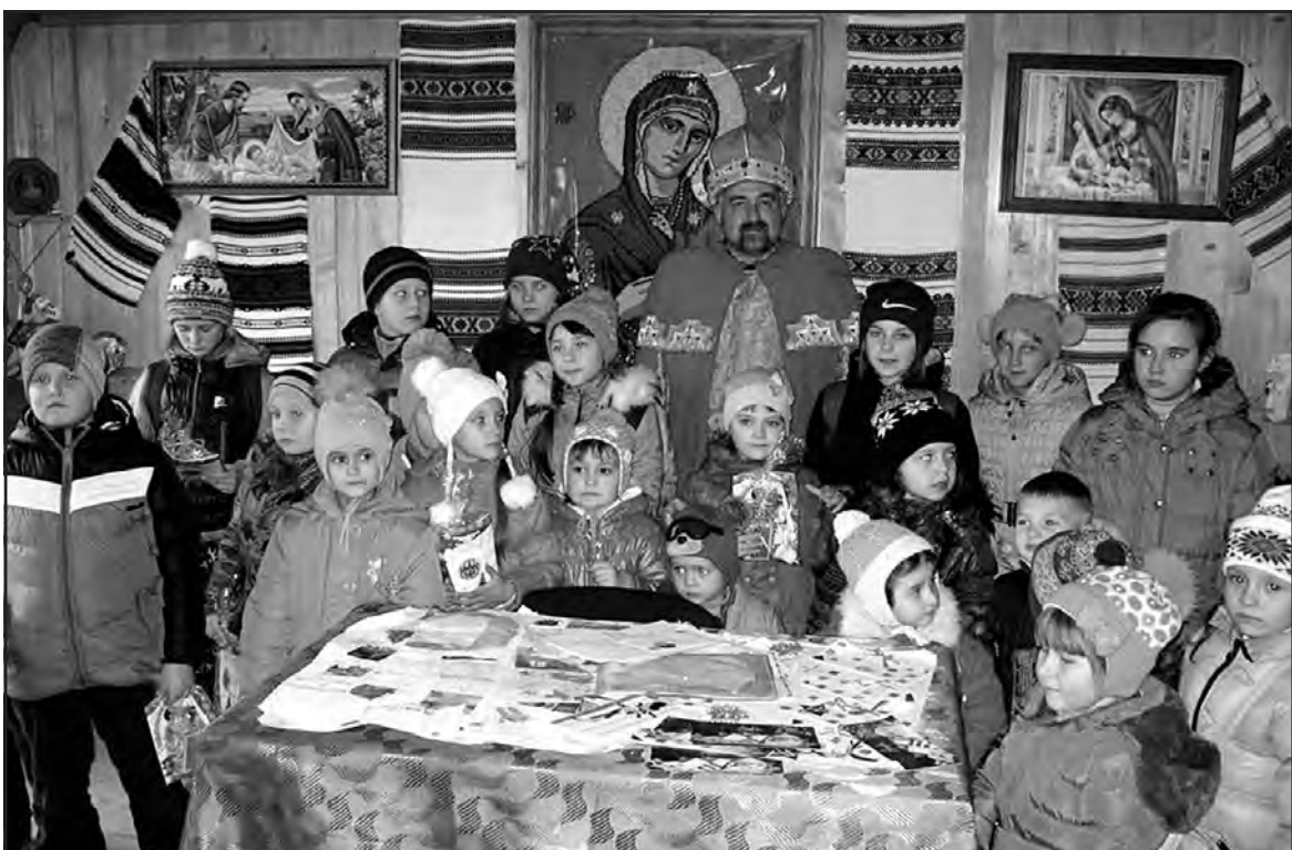
Школярі Довжанківської ЗОШ I-III ст. у гостях у святого Миколая.