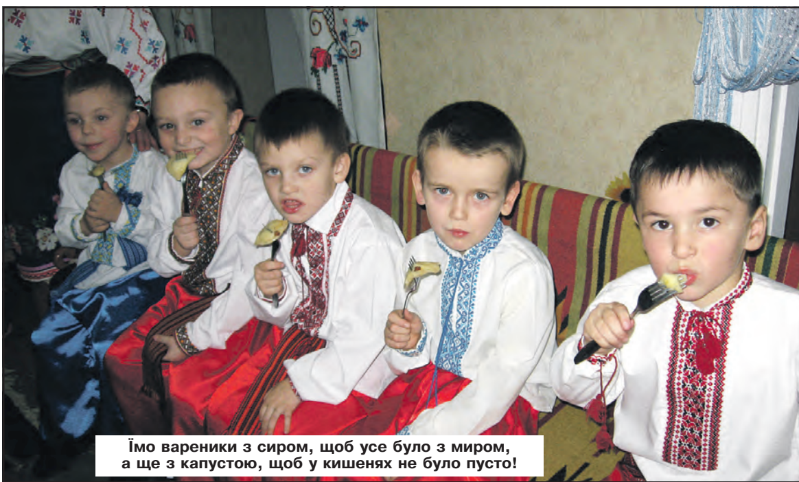
Імо вареники з сиром, щоб усе було з миром, а ще з капустою, щоб у кишнях не було пусто!