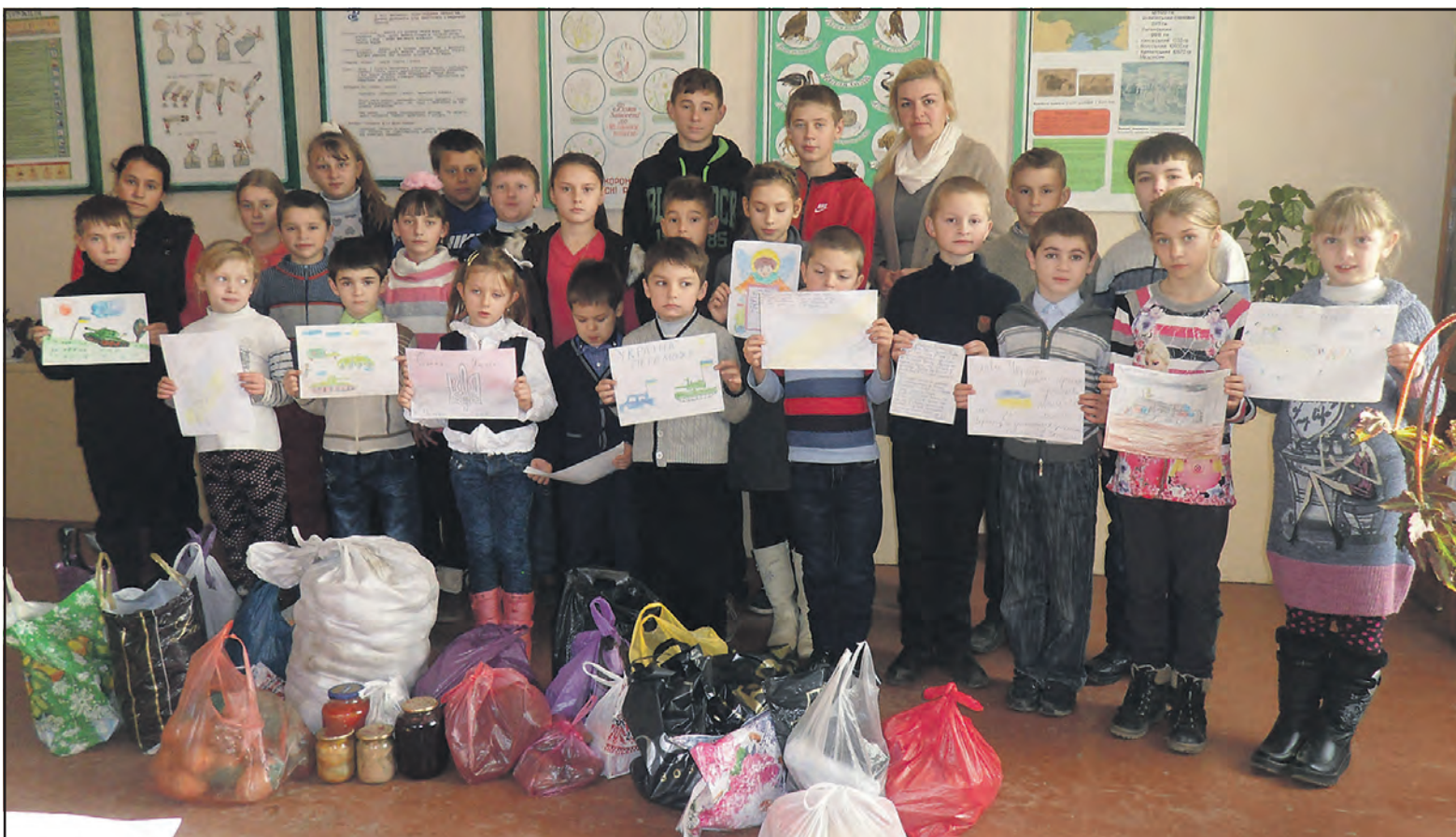
Петриківські школярі зібрали продукти для воїнів АТО та намалювали малюнки.