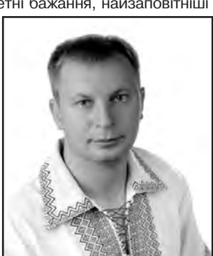
Степан БАРНА, голова Тернопільської облдержадміністрації.