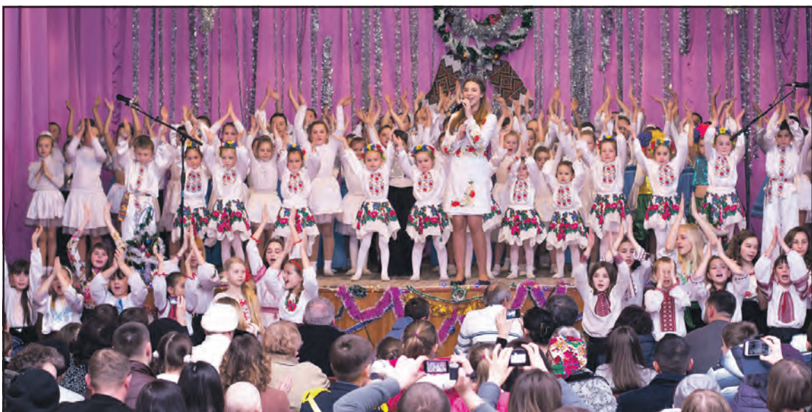
Заклучні акорди театралізованого дійства “Новорічний калейдоскоп”, яке підготували учні та викладачі Острівської музичної школи.

До слова, бажаючих стати глядачами дивовижного концерту було дуже багато: коли свято почалося, у великій глядацькій залі Тернопільського районного будинку культури вільних місць вже не залишилося. Присутні погодилися, що це дійство варте показу на вищому рівні. На два тижні учні та викладачі пішли на канікули. 11 січня 2016-го з новими силами Острівська музична школа розпочне другий семестр навчання.