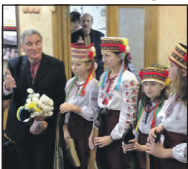
“Сонце, що дає нам волю” — урочистості з нагоди 147-річчя “Просвіти”.