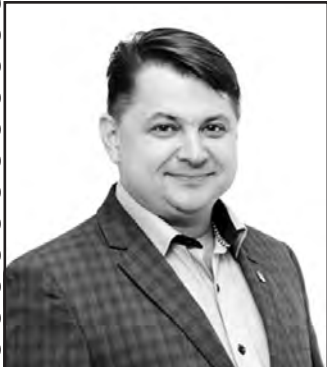
Віктор ОВЧАРУК, голова Тернопільської обласної ради.

Здоров'я, щастя Вам, достатку, веселих і радісних свят та смачної куті!