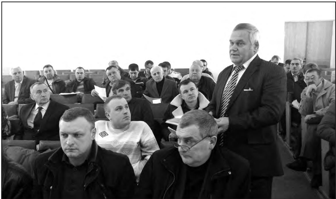
Депутат Богдан Ящик ініціював звернення до Кабінету Міністрів України про незгоду з ліквідацією управління Пенсійного фонду України в Тернопільському районі шляхом приєднання до управління Пенсійного фонду України в м. Тернополі.