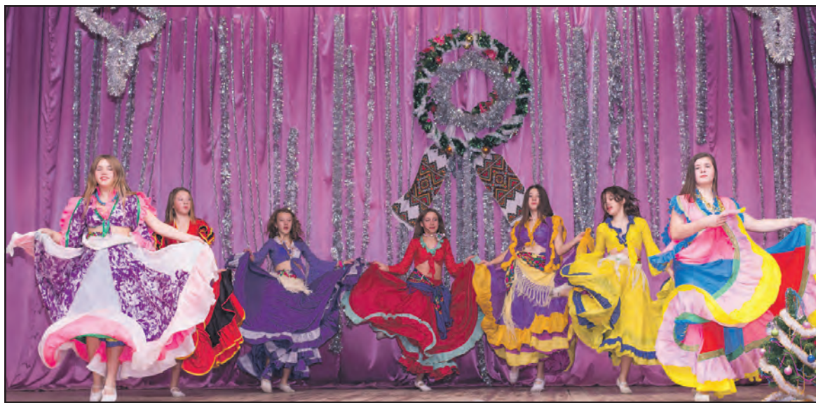
У вихорі танцю на сцені Тернопільського районного будинку культури учні Острівської музичної школи.