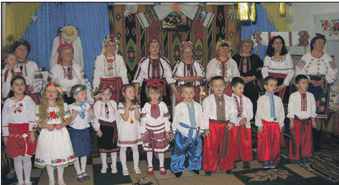
Організатори та учасники передріздвяного свята у НВК "Дичківська ЗОШ І-ІІ ст.-ДНЗ".

Але на цьому святкове дійство не завершилось. Усіх гостинно запросили до щедро накрытого столу. Чого тут тільки не було! Вареники з картоплею, сиром, капустою, вишнями, сливами, пампушки, вергуни, ланамці з маком, духмяний узвар. Усі пригощалися з дарів української землі та доброти серця дичківських господинь. Діти, вихователі, гості, усі батьки пішли додому ситі, а столи вгиналися від правдивих (не супермаркетівських) страв. Подумалось: "Хто щедро ділиться, тому не убуває".