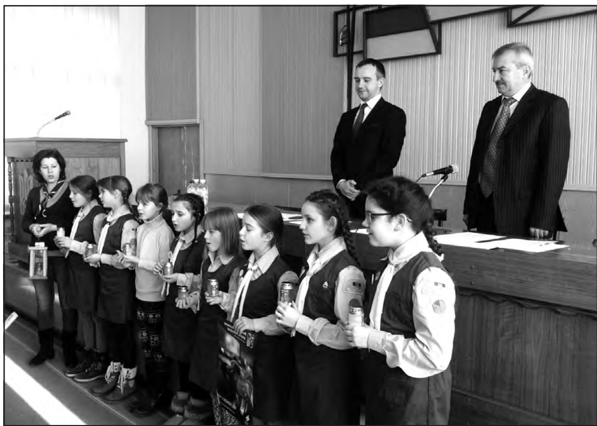
Представники Всеукраїнської національної організації “Пласт” у Тернополі передали учасникам сесії Тернопільської районної ради Вифлеємський вогонь.

державним бюджетом, місцевим і обласним, у 100-відсотковому розмірі залишили у бюджетах органів місцевого самоврядування. Структура доходів бюджету Тернопільського району на 2016 рік практично не змінилася. Але у 2015 році 60% податків з доходів фізичних осіб, які надходили у районний бюджет, з 2016 року за такою ж ставкою надходять у бюджети об’єднаних територіальних громад із центрами у с. Байківці та с. Великі Гаї. На їхній території розташовані підприємства, звідки раніше надходило найбільше податків у районний бюджет, що становить 50% доходів. Через це, приміром, з бюджету байковецької громади буде