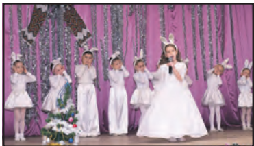
“Новорічний калейдоскоп”, або Казка лише починається.