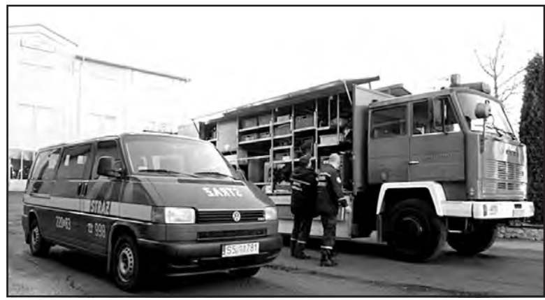
Тернопільські рятувальники отримали спецавтомобілі від колег із Польщі.

Уже багато років триває плідна співпраця між тернопільськими рятувальниками та вогнеборцями з Шльонського воєводства Республіки Польща. 21 грудня поляки подарували українським колегам спецтехніку, яку ще донедавна використовували за призначенням в своїх підрозділах.