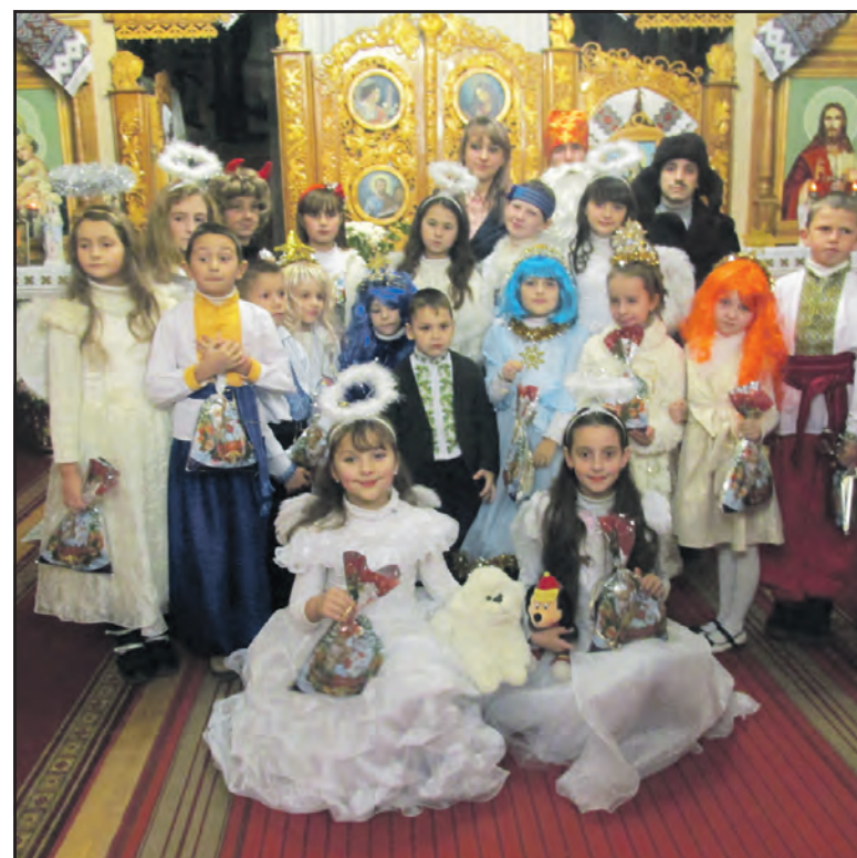
У церкві Архистратига Михаїла с. Чистилів діти представили театралізоване дійство.