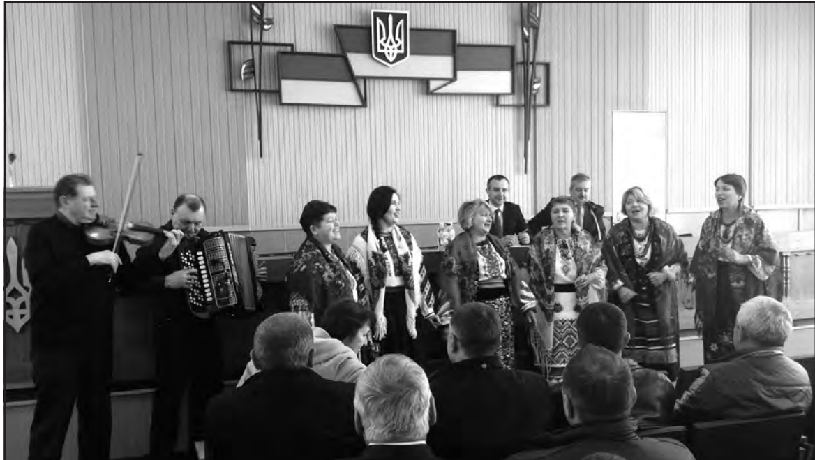
У сесійній залі Тернопільської районної ради 29 грудня звучали новорічні вітання та різдвяна коляда.

5 січня 2016 року відбулося друге пленарне засідання другої сесії Тернопільської районної ради. Деталі у наступному номері газети “Подільське слово”.