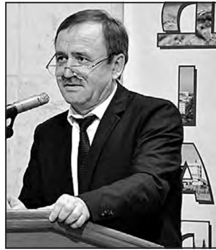
Перший заступник міністра регіонального розвитку, будівництва та ЖКГ України В'ячеслав Негода.

“Ми працюємо з державними інститутами і донорськими організаціями, спонукаючи їх надати