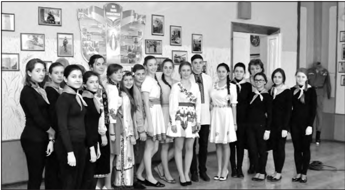
Великоглибочецькі школярі шанують честь і славу героїв України.