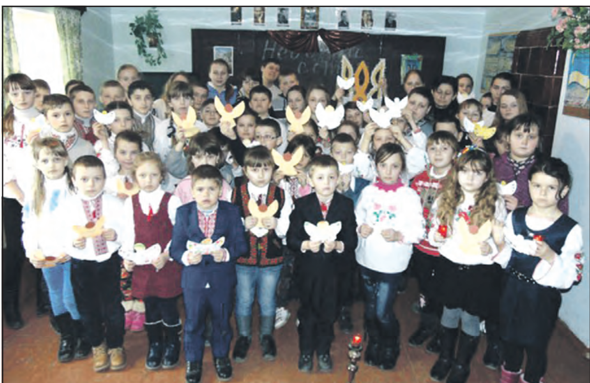
У дні вшанування Героїв Небесної Сотні учні Прошівської ЗОШ I-II ступенів взяли участь у патріотичному флешмобі "Вони тримають небо". Діти 1-4 класів виготовили ангеліків, які символізують чисті душі загиблих, а учні 5-9 класів вшанували їх пам'ять поезією, присвяченою Революції Гідності. Завершили флешмоб виконанням пісні-реквієму "Плине кача.." і запаленням свічок пам'яті.