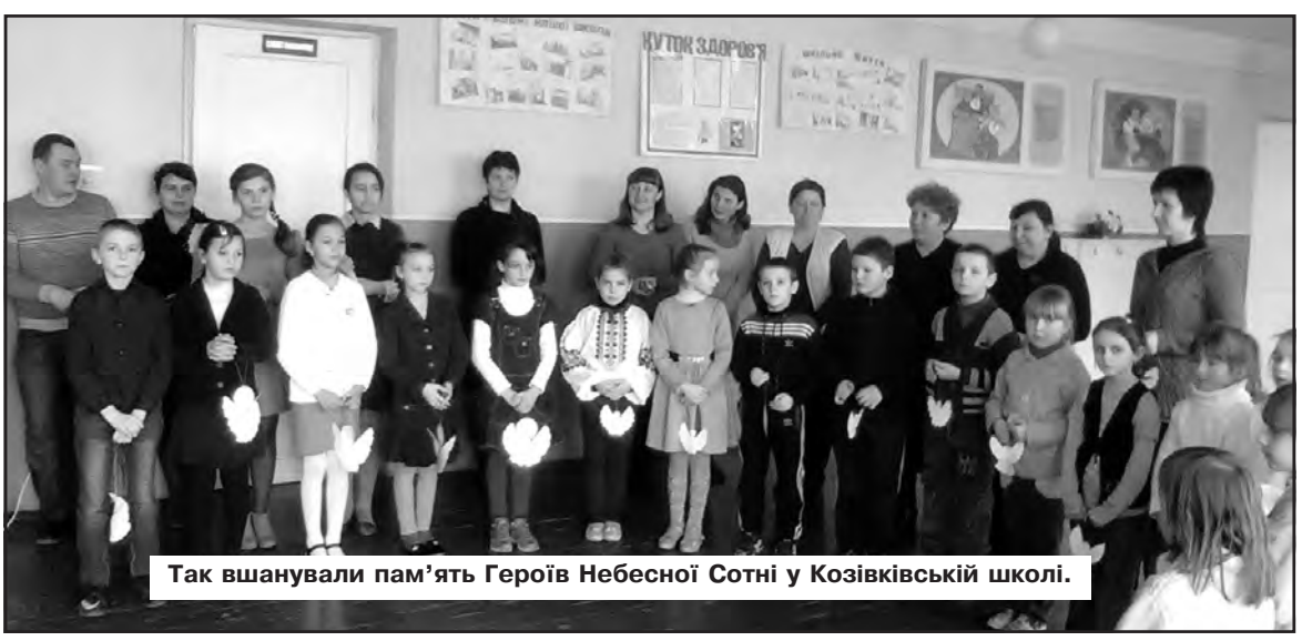
Так вшанували пам'ять Героїв Небесної Сотні у Козівківській школі.