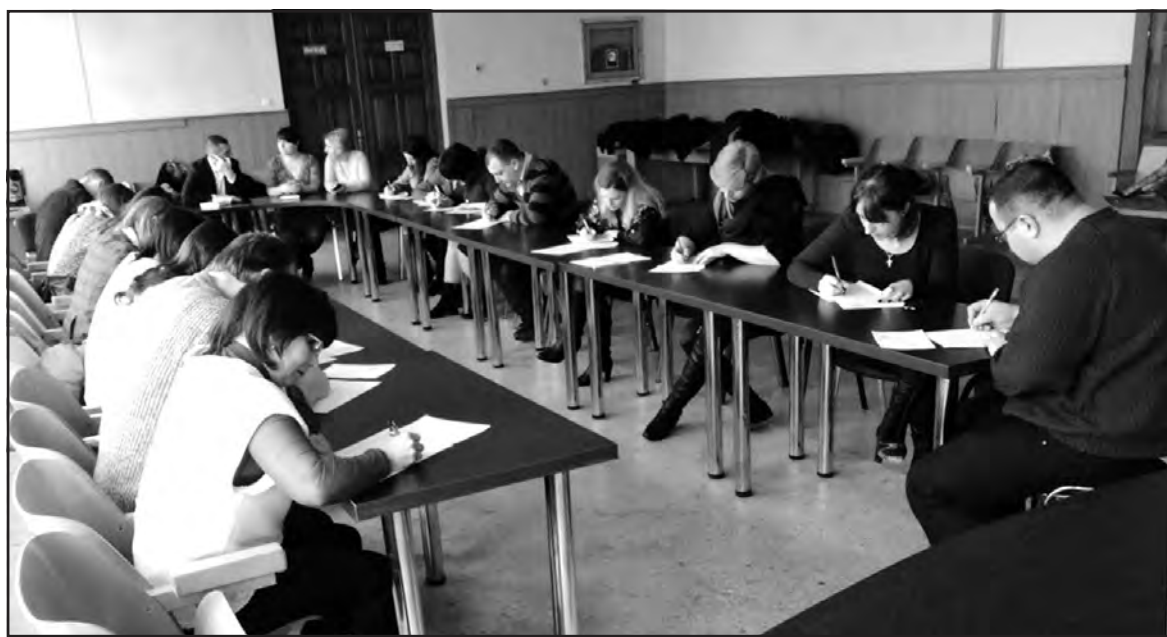
Учасники конкурсного відбору на заміщення вакантних посад посадових осіб місцевого самоврядування Байковецької сільської ради, 24 лютого 2016 року.