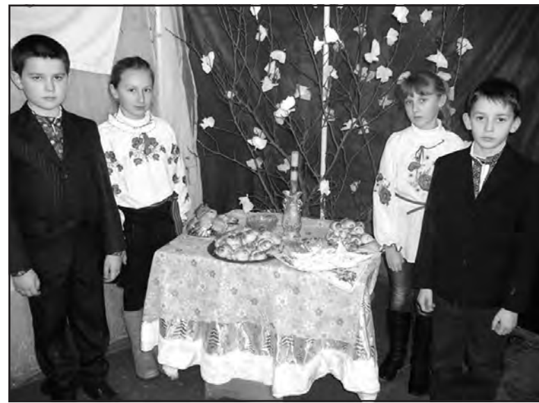
Учні Стегниківської ЗОШ I-II ст. вивчали традицію виготовлення обрядового печива — “жайворонків”.

Продовження у наступному випуску “Об'єднаної громади”.