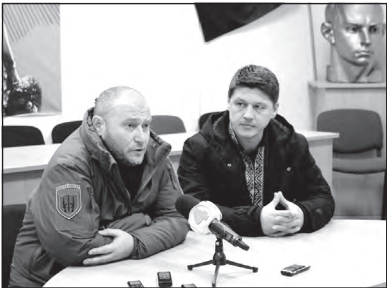
Лідер Національного руху "Державницька ініціатива Яроша" (ДІЯ) Дмитро Ярош (зліва) та керівник громадсько-політичної платформи руху "ДІЯ" Андрій Шараскін під час прес-конференції у Тернополі.