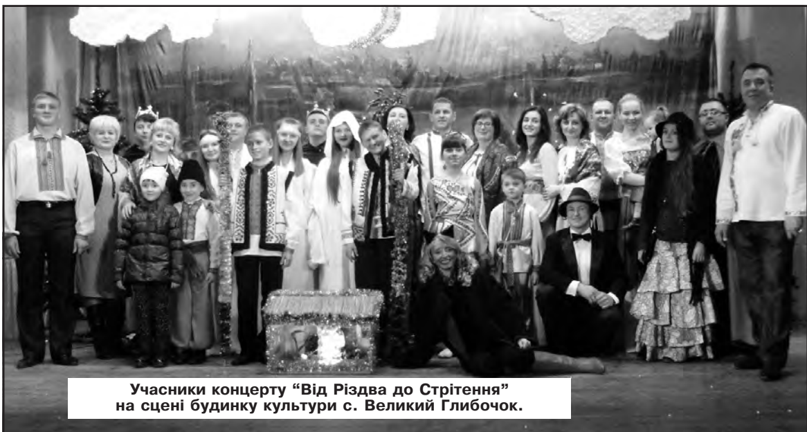
Учасники концерту "Від Різдва до Стрітіння" на сцені будинку культури с. Великий Глибочок.