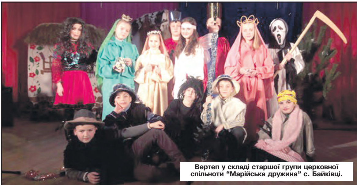
Вертеп у складі старшої групи церковної спільноти “Марійська дружина” с. Байківці.