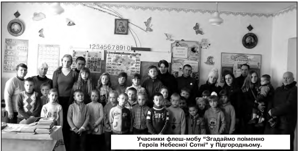
Учасники флеш-мобу "Згадаймо поіменно Героїв Небесної Сотні" у Підгородньому.