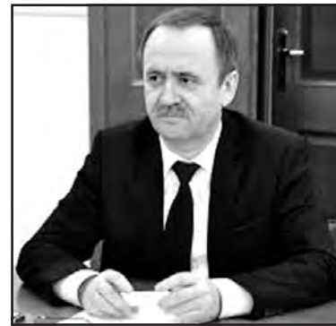
Перший заступник міністра регіонального розвитку, будівництва та ЖКГ України В'ячеслав Негода.

Для отримання в 2016 році субвенції з державного бюджету об'єднані територіальні громади повинні мати план соціально-економічного розвитку — документ, який громади розробляли і раніше. Отже, спеціальних методичних рекомендацій від уряду для отримання субвенції громади не потребують. Про це сказав перший заступник міністра регіонального розвитку, будівництва та житлово-комунального господарства України В'ячеслав Негода.