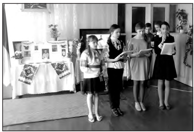
Учні старших класів присвятили Героям патріотичну поезію.

Небесна Сотня — так назвали вбитих героїв. Їм та всім українцям, які загинули за Україну, в НВК "Козівківська ЗОШ І-ІІ ст. - ДНЗ" 19 лютого було проведено флеш-моб, присвячений вшануванню Героїв Небесної Сотні. Дійство розпочалося молитвою. Учні НВК, вчителі, батьки та всі присутні молилися до Господа за вбитих героїв, просили Бога кріпити наш народ у боротьбі з ворогом, який хоче підступно відібрати в нас право на життя, право на волю, неза-