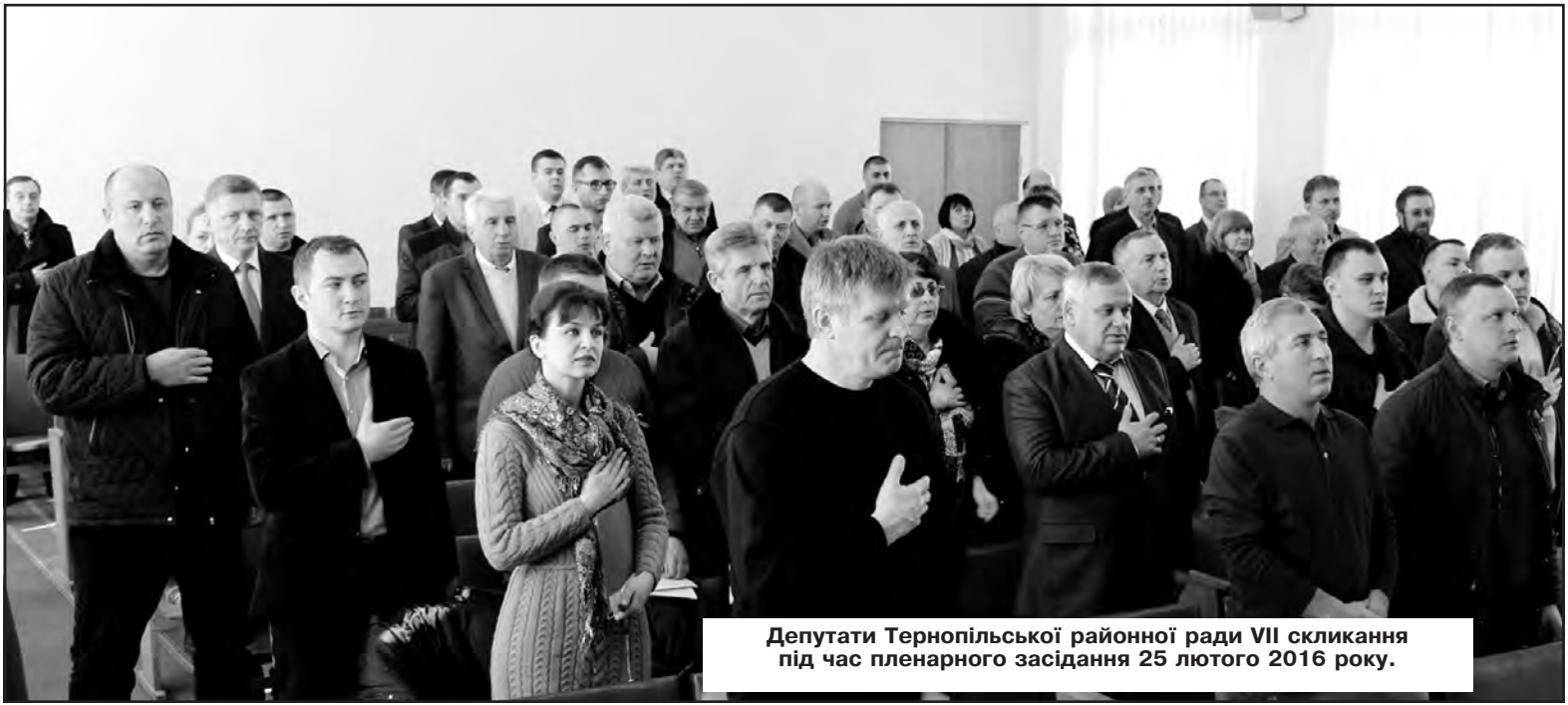
Депутати Тернопільської районної ради VII скликання під час пленарного засідання 25 лютого 2016 року.

Хай квітнуть дні яскравим цвітом І будуть в них сердечність і тепло, Щоб у житті було чому радіти, А смутку у душі ніколи не було.