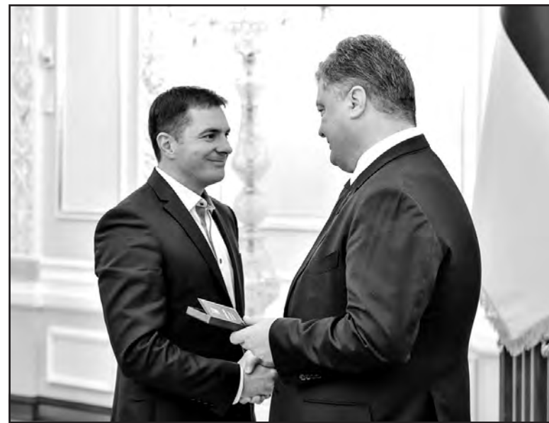
Президент України Петро Порошенко вручає орден "За мужність" ІІІ ступеня Гаї-Шевченківському сільському голові Богдану Бричу.