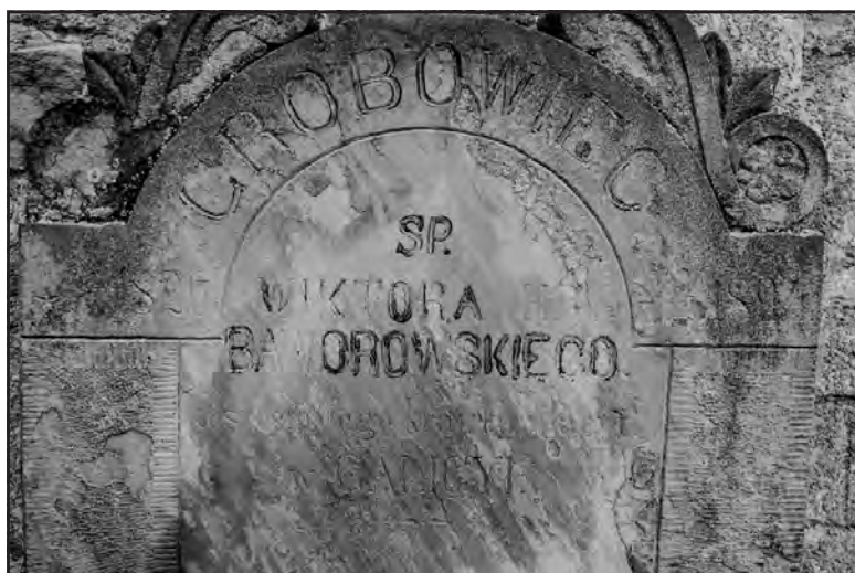
Надгробна плита Віктора Баворовського збереглася до наших днів у стіні костелу Успіння Святої Богородиці у Баворові, де похована родина Баворовських.

кував свої переклади, друком вийшли тільки "Оберон", "Дон Жуан" і "Дума про Мазепу". Окрім художньої літератури, улюбленим предметом його досліджень була лінгвістика. Зокрема, його приваблювало вивчення польських народних говірок, у рукописах залишилося кілька словників різних говірок. Спостереження, зібрані з життя, мандрівок у літературі, формулював у епіграмах, афоризмах, коротеньких віршах".