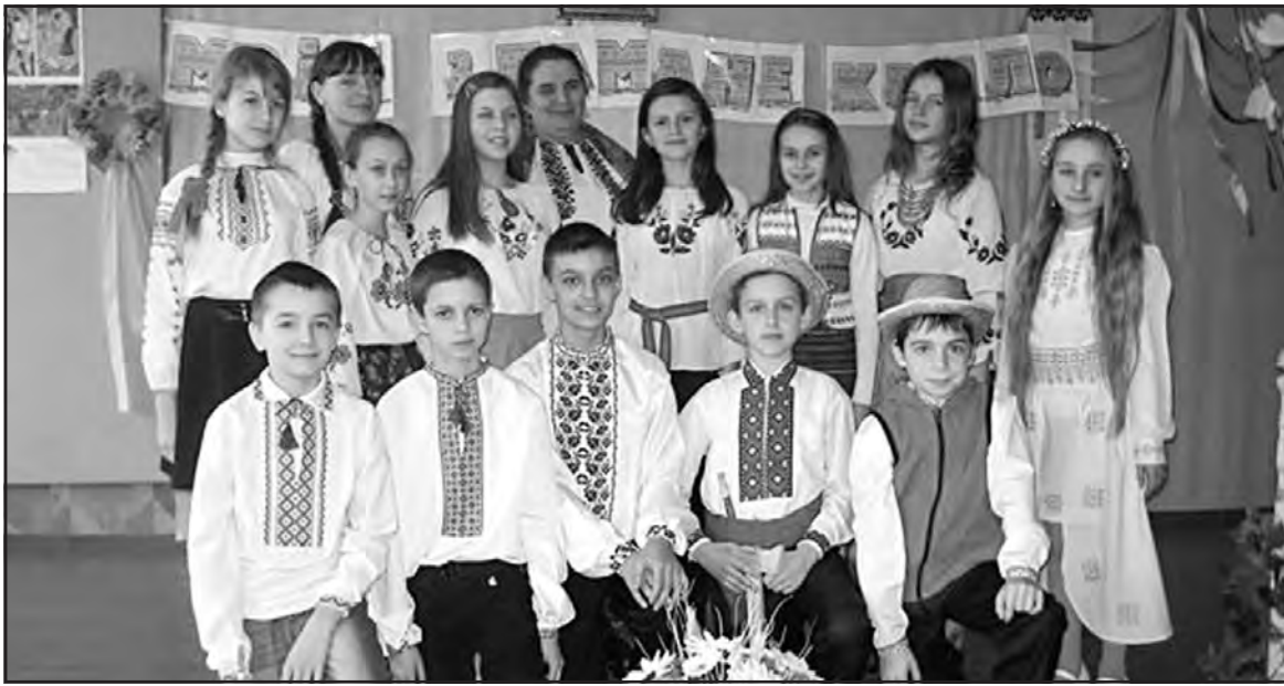
Учні Лозівської ЗОШ І-ІІІ ст.-ДНЗ під час урочистостей з нагоди Міжнародного дня рідної мови.