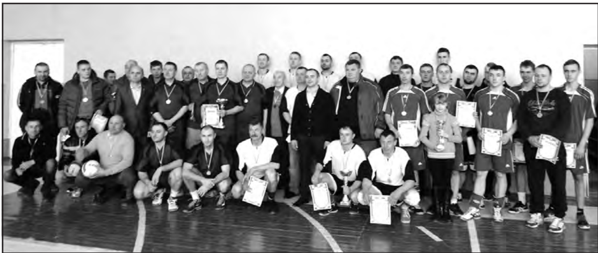
Команди сіл Плотича та Великі Гаї з організаторами змагань.