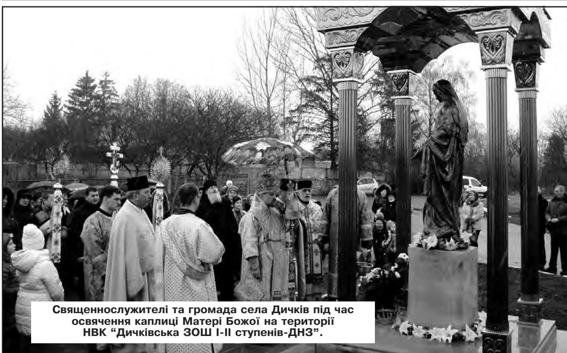
Священнослужителі та громада села Дичків під час освячення каплиці Матері Божої на території НВК “Дичківська ЗОШ І-ІІ ступенів-ДНЗ”.