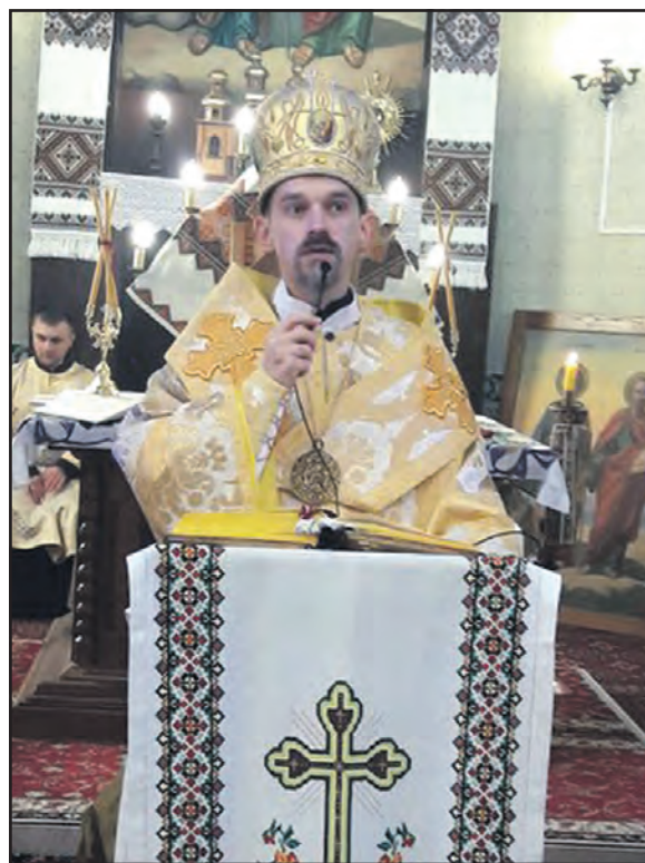
Єпископ-помічник Тернопільсько-Зборівський УГКЦ Теодор Мартинюк у храмі святих Петра і Павла в Лозовій, 6 березня 2016 р.

В першу неділю березня церква святих Петра і Павла в Лозовій була вщент заповнена людьми. Парафіяни зібрались велелюдно, аби отримати благословення від єпископа Теодора Мартинюка.