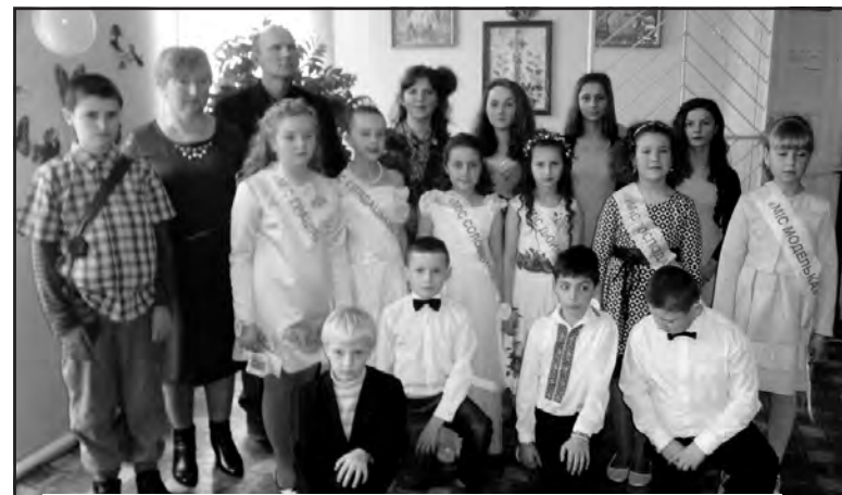
Під час конкурсу “Міс дюймовочка-2016” у Байковецькій ЗОШ І-ІІ ст., 5 березня 2016 р.