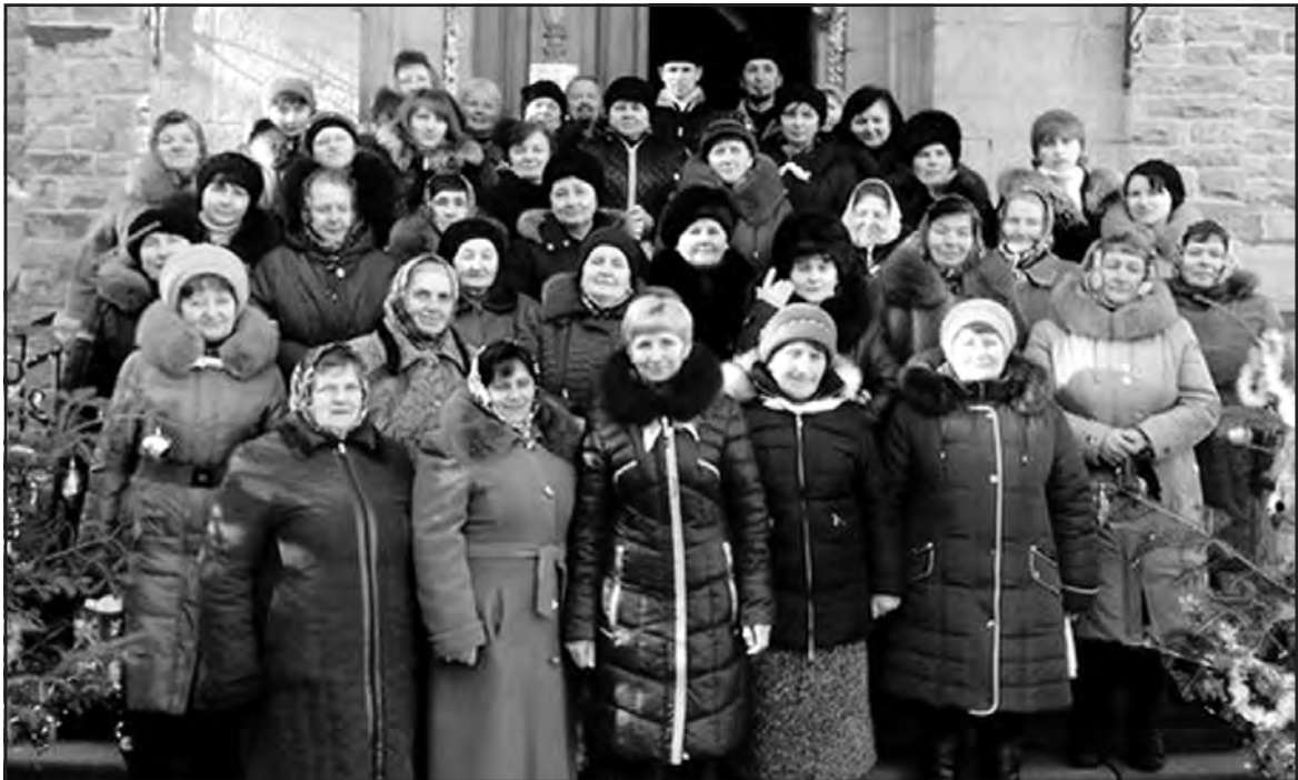
Члени спільноти “Матері в молитві” церкви Вознесіння Господнього села Настасів.