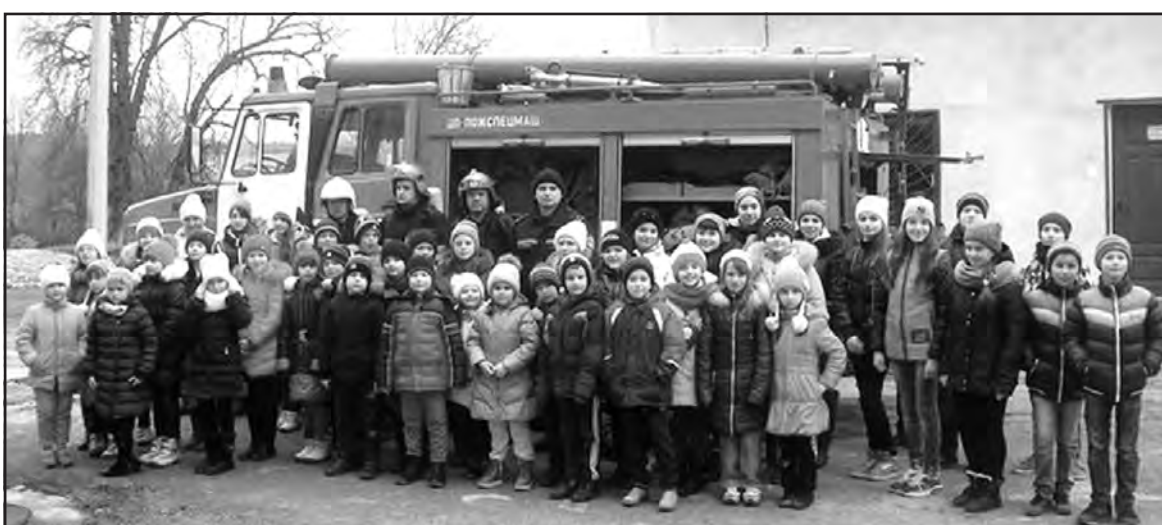
Учасники акції “Запобігти. Врятувати. Допомогти” у Шляхтинецькій ЗОШ І-ІІ ст. ім. О. Барвінського.