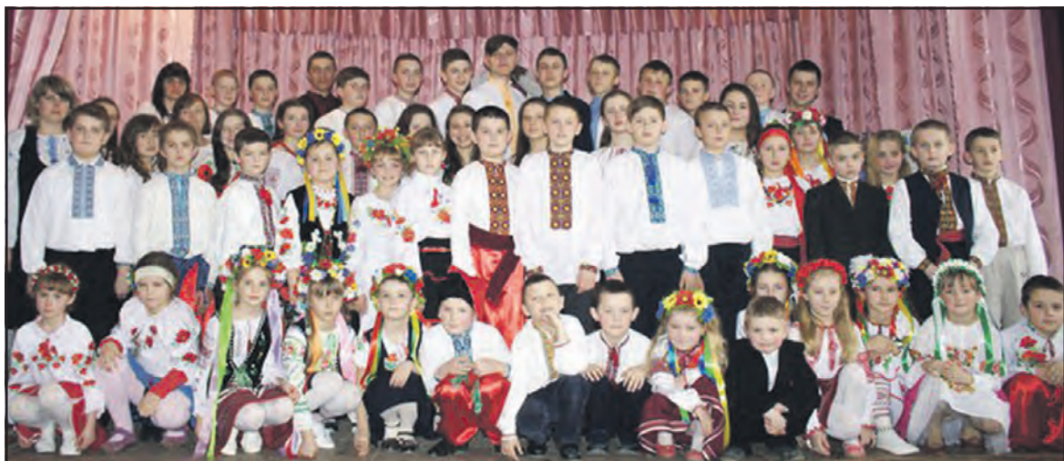
Учасники мистецького заходу з нагоди дня народження Кобзаря у будинку культури села Стегниківці, 9 березня 2016 року.