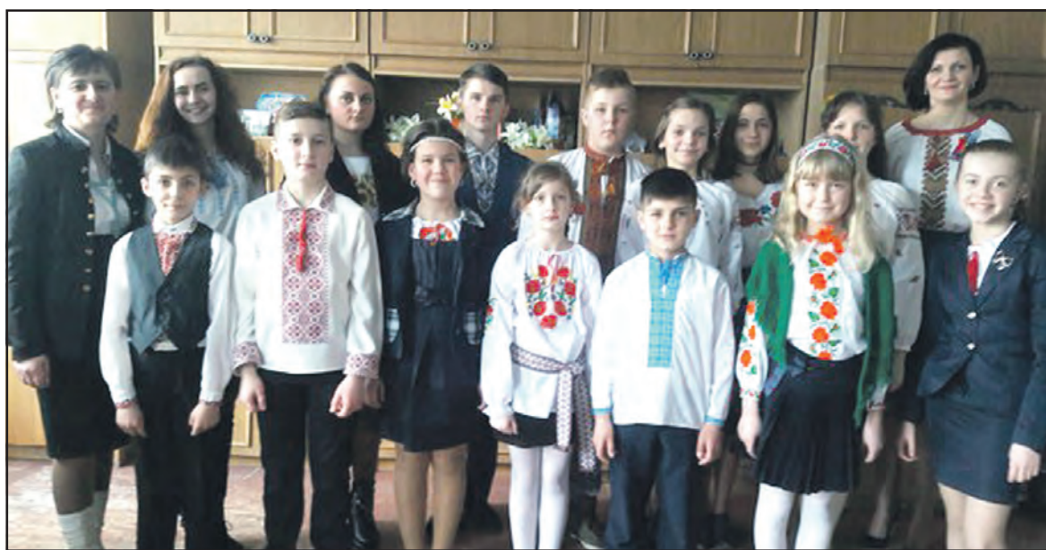
Учасники літературно-музичного вечора “Слава Героям! Слава Україні і її пророкові!” у с. Байківці.