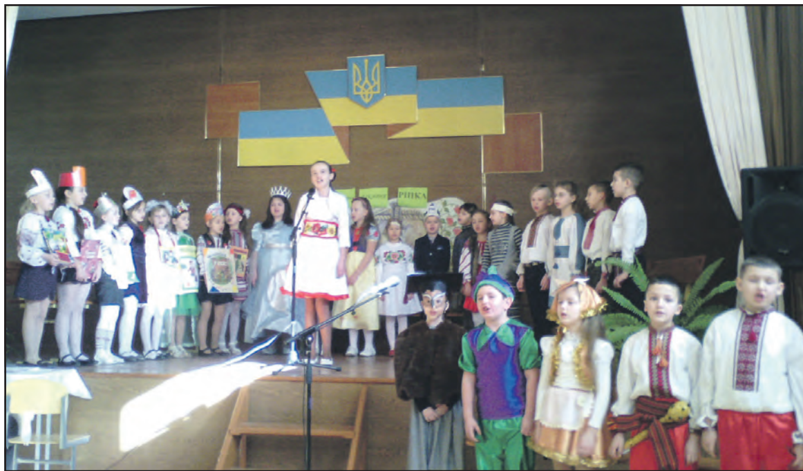
Учні Великогаївської ЗОШ I-III ступенів представили учасникам семінару "Подорож у бібліотеку".

За матеріалами творчої групи шкільних бібліотекарів Тернопільського району.