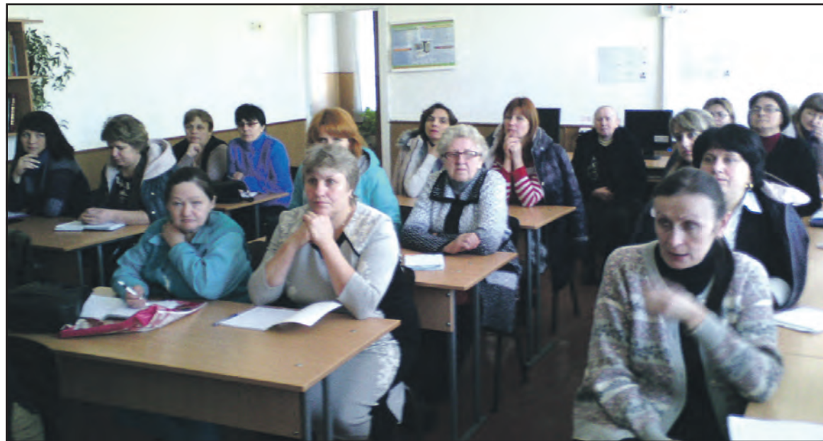
Шкільні бібліотекарі Тернопільського району під час семінару на базі Великогаївської ЗОШ I-III ст.