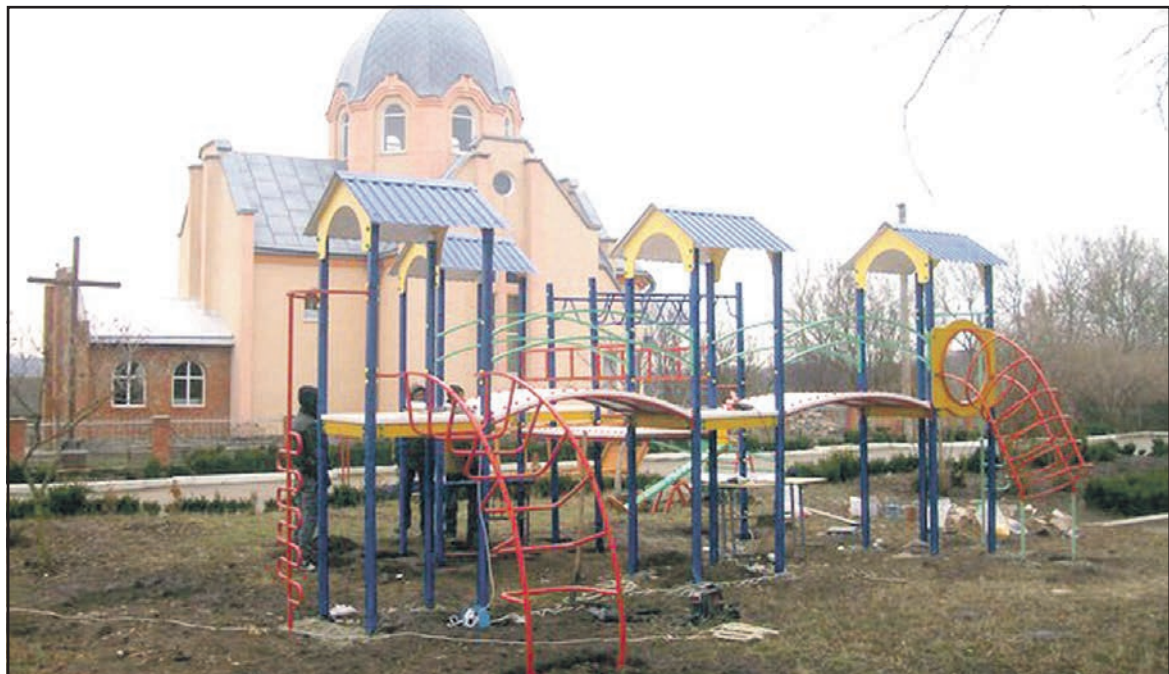
Дитячий спортивно-ігровий комплекс у с. Лозова Байковецької сільської ради об'єднаної територіальної громади.