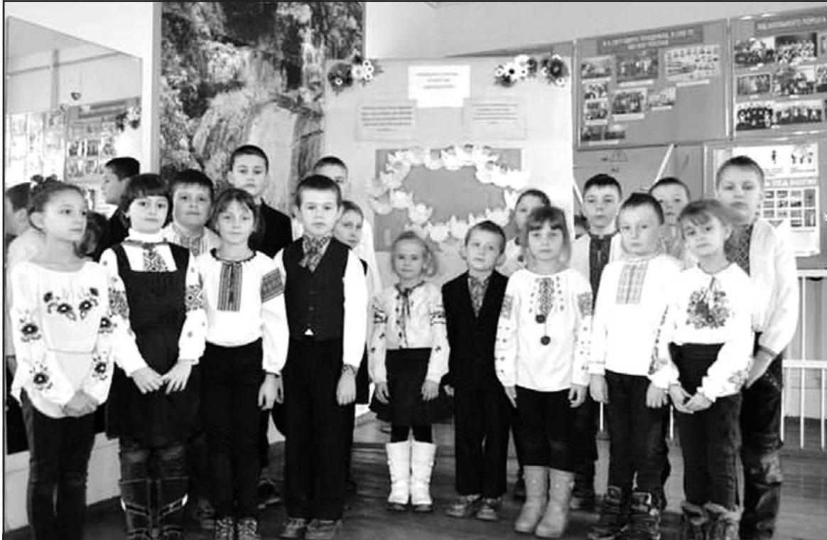
Учні початкових класів Довжанківської ЗОШ І-ІІІ ст. — учасники флеш-мобу.