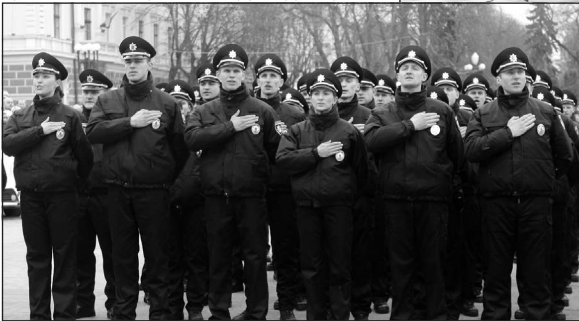
209 патрульних поліцейських прийняли присягу на вірність народові України 12 березня ц. р. на Театральному майдані у Тернополі.

...А, тим часом, зранку зведений загін патрульної служби в кількості 40 правоохоронців спецбатальйону “Тернопіль” відбув на ротацію, яка триватиме 45 діб, у зону АТО. Така в них професія, робота і покликання.