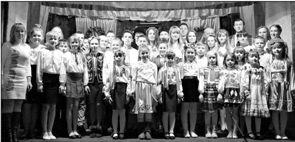
Учасники урочистостей з нагоди вшанування пам'яті Тараса Шевченка в клубі с. Чистилів.