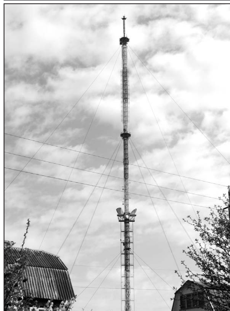
Телевежа в с. Лозова — найбільша вежа Тернопільської області.