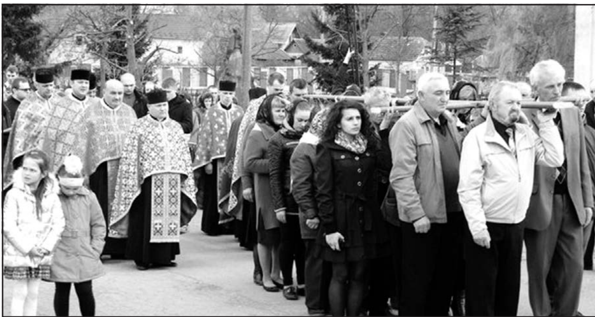
Під час Хресної Ходи у селі Настасів, 16 квітня 2016 року.