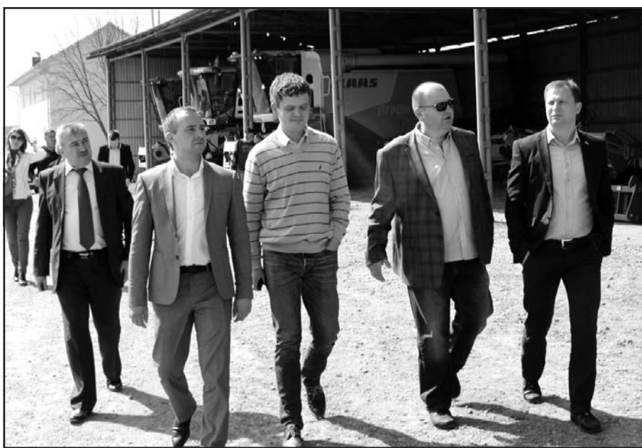
Під час візиту в ПП "Агрон" (зліва направо): голова Тернопільської районної ради Андрій Галайко, голова Тернопільської РДА Олександр Похилій, директор департаменту агропромислового розвитку Тернопільської ОДА Віталій Луй, виконавчий директор ПП "Агрон", заслужений працівник сільського господарства України, депутат Тернопільської обласної ради Юрій Березовський, голова Тернопільської ОДА Степан Барна.

Окрім цього, в рамках робочої поїздки голова Тернопільської ОДА