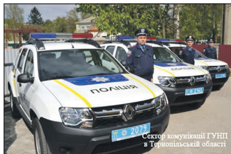
Сектор комунікації ГУНП в Тернопільській області