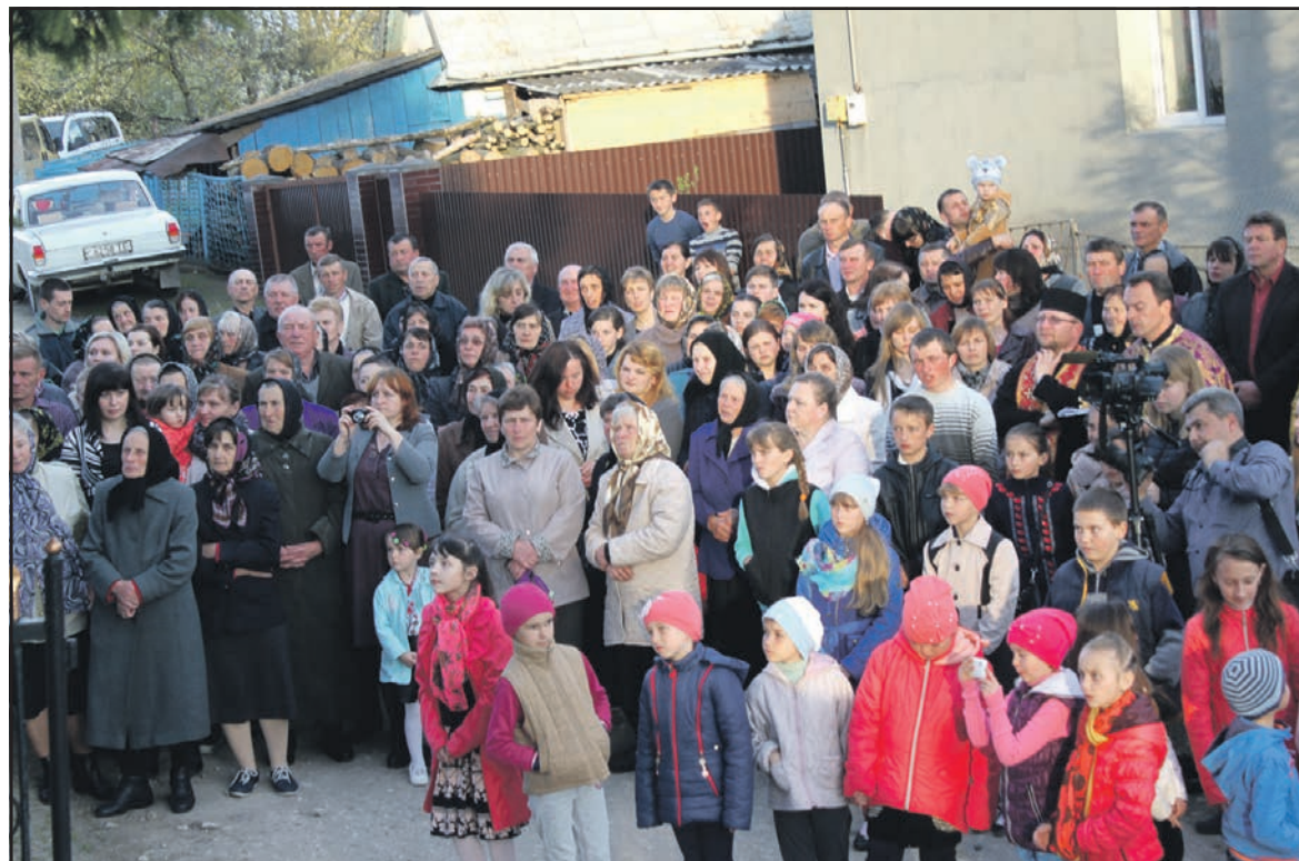
Учасники Хресної Дороги у селі Стегниківці роздумують над страстями Христовими.