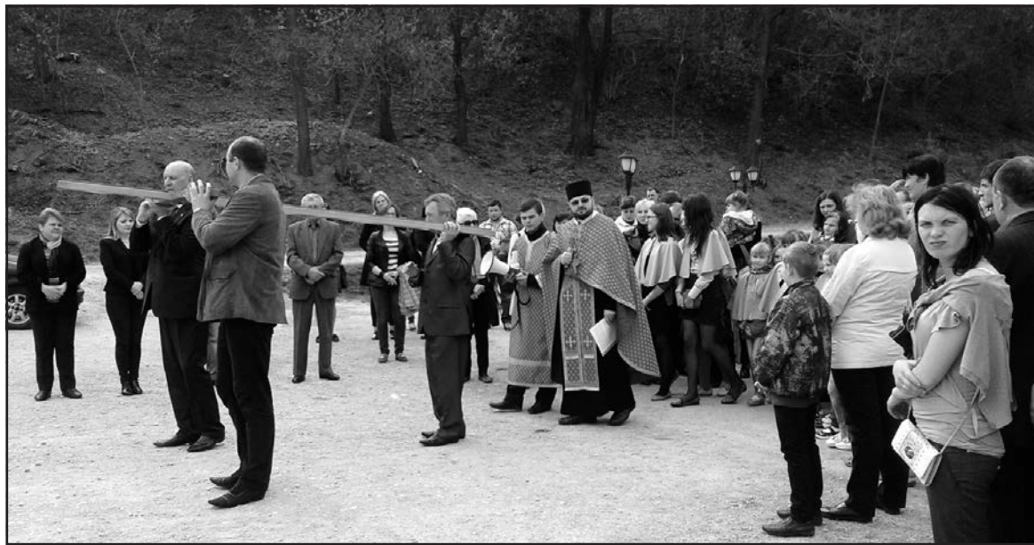
Під час Хресного Ходу в селі Ступки, 10 квітня 2016 року.

Роздумуючи над Христовими терпіннями, вслухаючись у кожне слово розважання і молитви, ступківчани кожної стації молилися за мир і спокій в Україні,