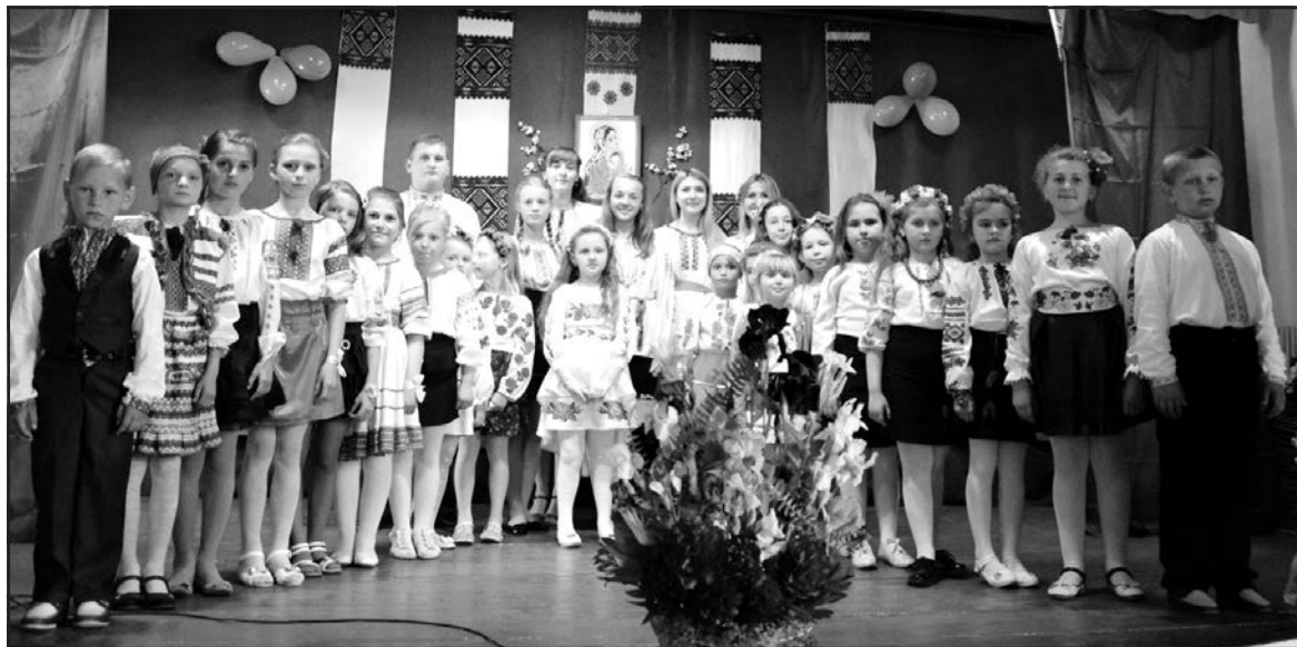
На сцені клубу села Дичків учасники святкового концерту "Довіку матінку шануйте — свій найсвятіший оберіг".