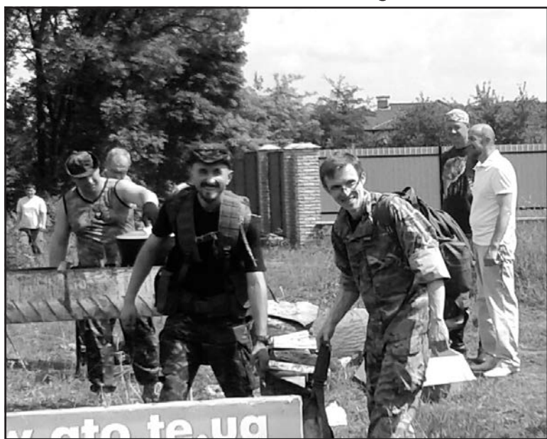
У військовому вишколі в Гаях Шевченківських “Захисти своїх” брали участь військові, представники громадських організацій, учасники АТО.

Оскільки ця подія — все ж-таки вишкіл, що має за основу військовий підтекст з ідеологічним вихованням, тому формування у потенційних захисників Вітчизни навичок поведінки зі зброєю різного типу стало приводом, з якого, зрештою, всі й зібратися. Майстер-клас із розбору і збору автомата, техніка кидання гранат, техніка пострілу з гранатомета, основи диверсійних навичок та рукопашного бою — всіх цих азів військової справи бажачучих навчали інструктори — представники