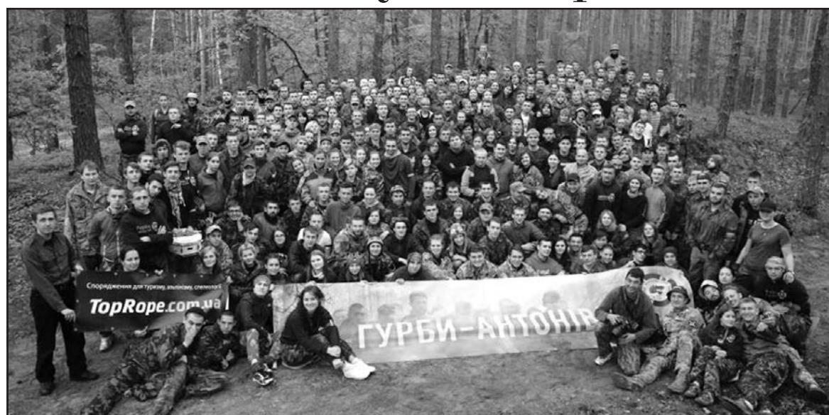
На чотирнадцяту спортивно-патріотичну теренову гру “Гурби-Антонівці” зібралася 400 патріотів з усієї України.

“Для нас пріоритетом є військово-патріотичне виховання молоді, оскільки триває війна. Саме тому ми підтримуємо заходи Молодіжного Націоналістичного Конгресу, — зазначив начальник