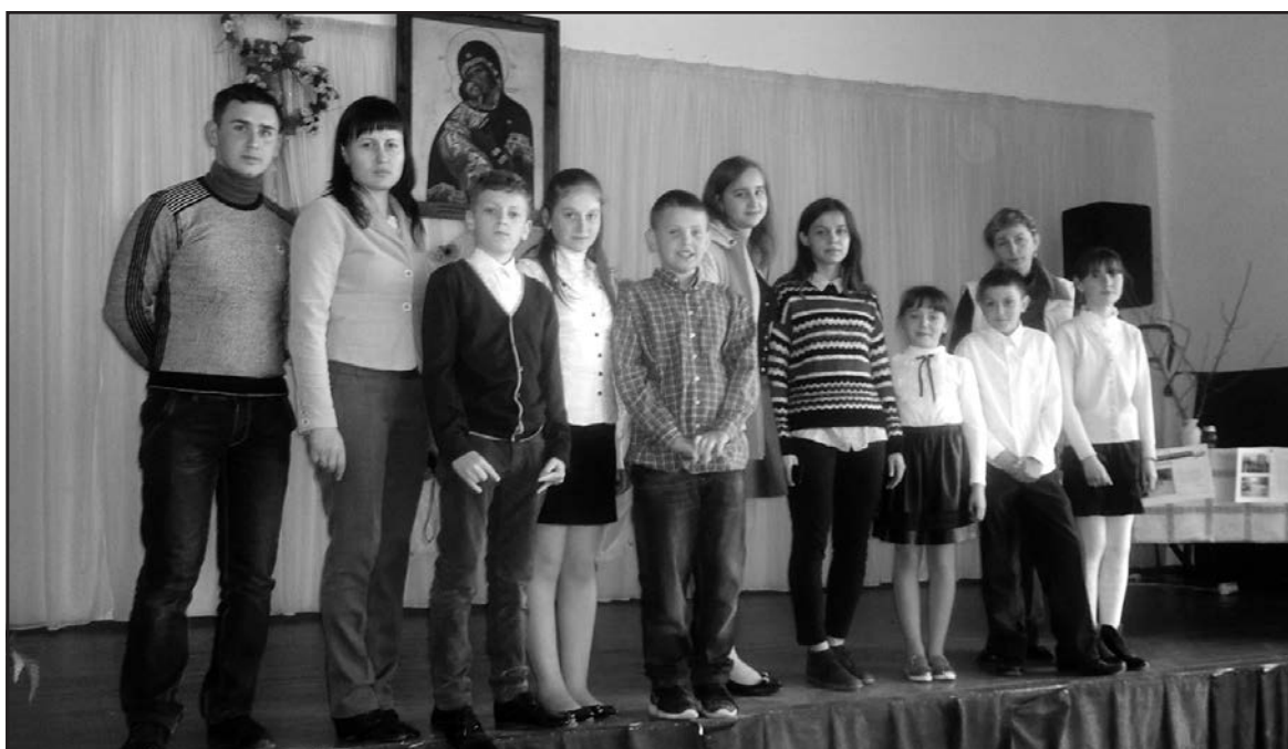
Учасники та організатори виховного заходу “Чорнобильська трагедія — одвічний слід на Україні: 30 років потому” в Острівській ЗОШ I-III ст.