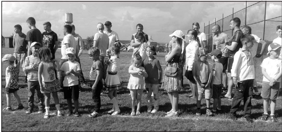
Юне покоління Гаїв Шевченківських уважно слідувало за бойовим вишколом на сільському стадіоні.