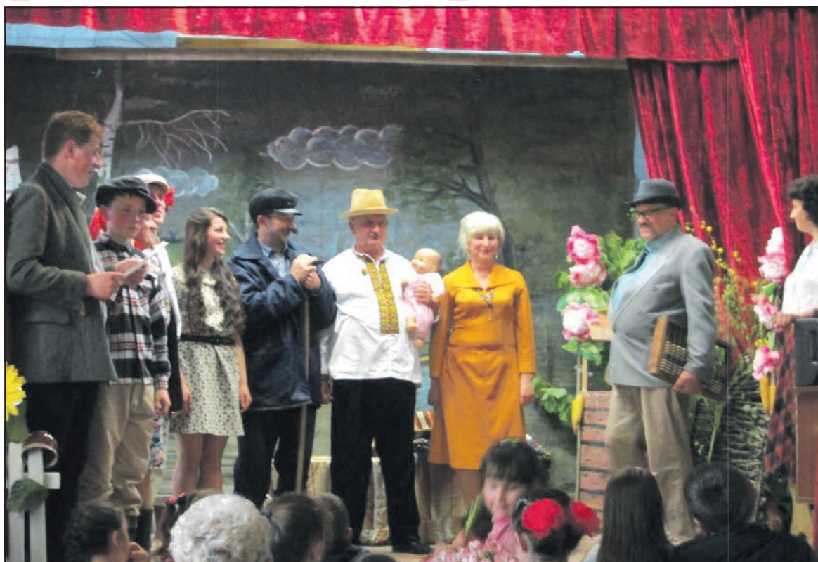
Самодіяльні актори с. Буцнів представили на суд глядачів виставу "Фараони" Олексія Коломійця.