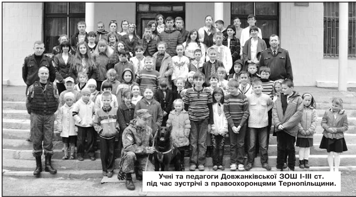
Учні та педагоги Довжанківської ЗОШ І-ІІІ ст. під час зустрічі з правоохоронцями Тернопільщини.