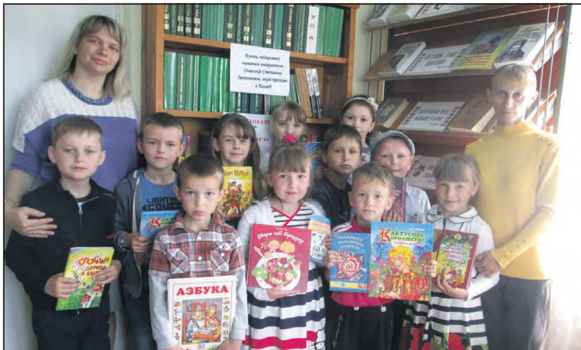
Учні 1-4 класів Домаморницької ЗОШ І-ІІ ст. зі своїми наставниками у бібліотеці-філії с. Домаморич.

Книгозбірня чекала на своїх маленьких читачів. Провідний бібліотекар використовувала сучасні методи та технології бібліотечної роботи: підготувала конкурси, загадки, прислів'я, скоромовки. Учні прочитали вірші, які вони складають самостійно. Бібліотекар спілкувалася з маленькими користувачами, хто чим займається у вільний час. Маленьким користувачам дуже сподобалася маленька книжкова виставка, що була оформлена у бібліотеці. Вони оглядали малюнки, читали казки, із захопленням розглядали нові книги. Найменшим учням сподобалася екскурсія, і вони вирішили стати читачами бібліотеки. Усі учасники екскурсії отримали маленькі подарунки.