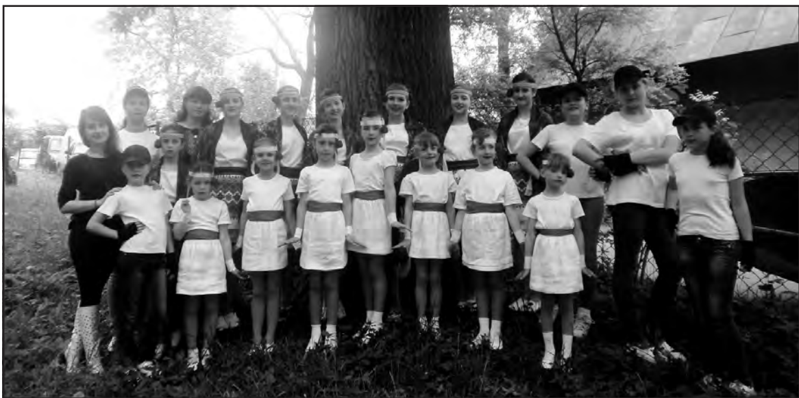
Учасники відзначення Дня матері у с. Товстолуг.