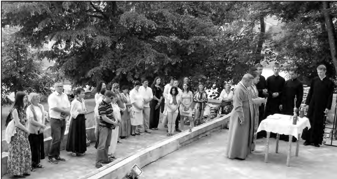
Представники ЗМІ Тернопільщини під час прощі у Марійському духовному центрі в Зарваниці, 5 червня 2016 року.