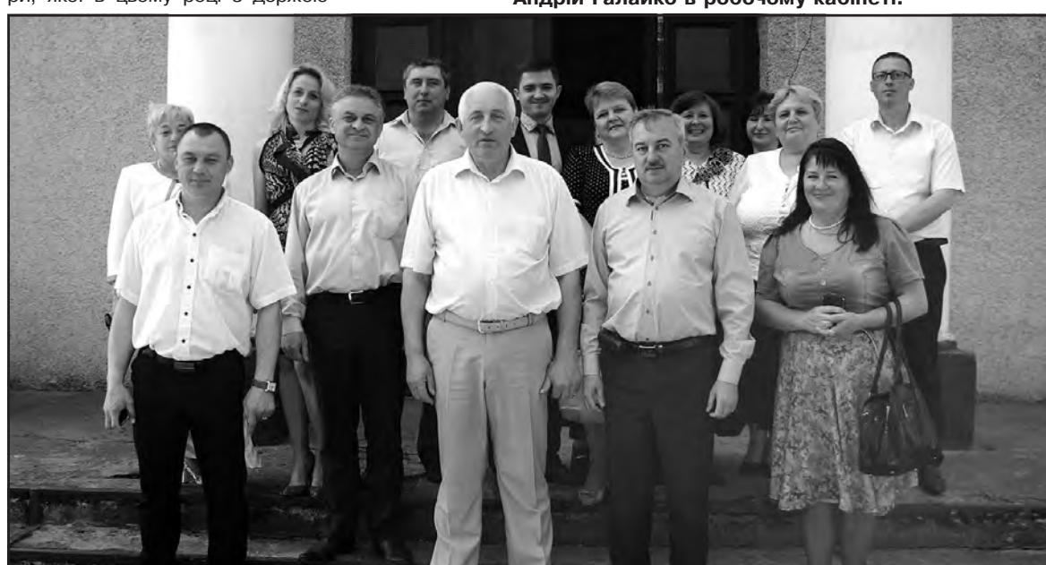
Делегація Тернопільського району у Привільненській об'єднаній територіальній громаді Дубенського району Рівненської області. В центрі — голова Дубенської районної ради Олександр Козак і голова Тернопільської районної ради Андрій Галайко.

джету виділено в розмірі мільярда гривень. Чим більша кількість жителів і площа території об'єднаної громади, тим більший обсяг субвенції. Тернопільська районна рада і Тернопільська районна державна адміністрація спілкуються з керівниками об'єднаних громад, допомагають вирішувати проблемні питання.