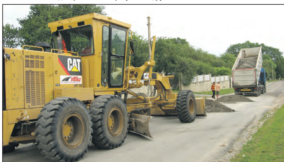
У Стегниківцях прокладають дорогу.