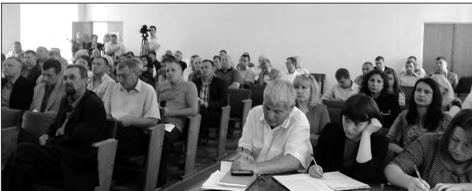
Учасники четвертої сесії Тернопільської районної ради VII скликання, 16 червня 2016 року.