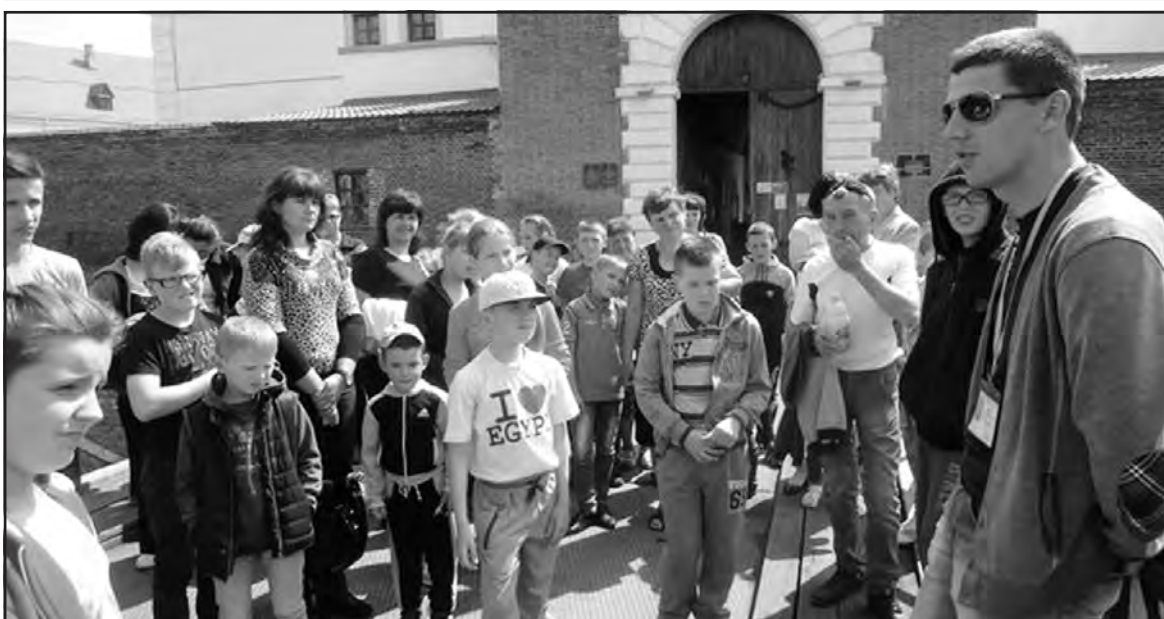
Під час екскурсії у Дубенський замок школярі Малоходачківської ЗОШ I-III ст. із педагогами та батьками.