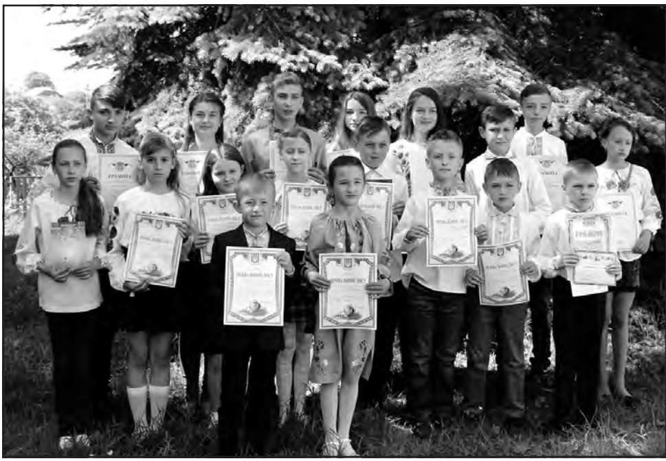
Лозівські школярі — переможці та призери предметних олімпіад і конкурсів.