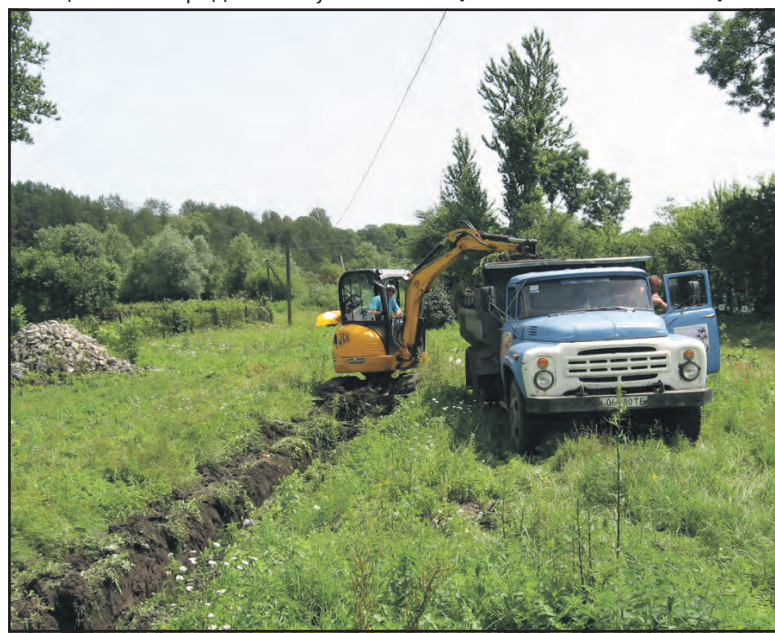
У Курниках копають канали для водовідведення.