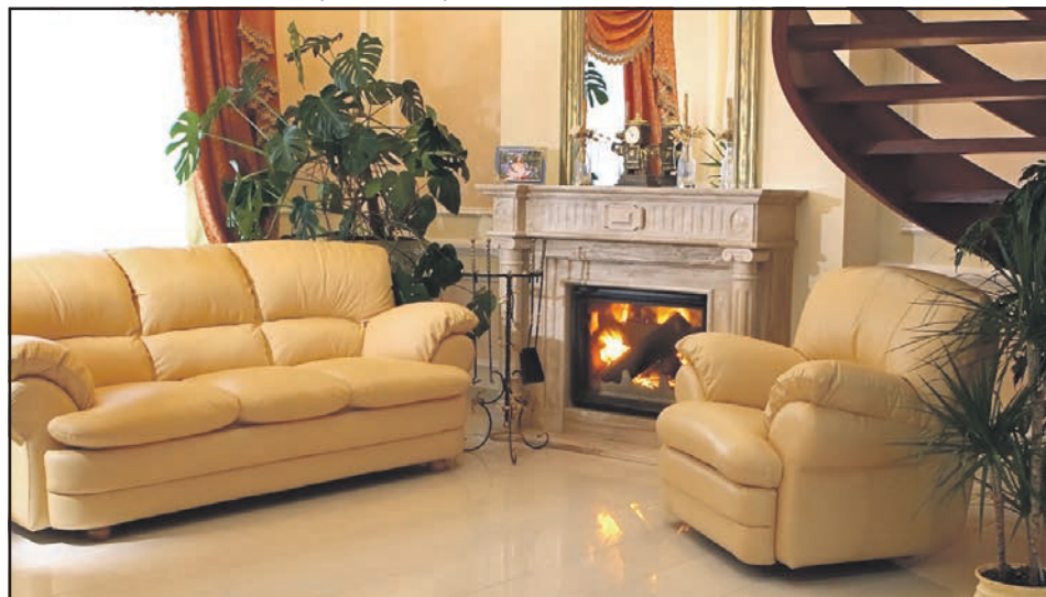
Елегантна модель м'якої частини “Орхідея” меблевої фабрики “Лісма” створює в домі затишок і комфорт.

Переглянути і замовити продукцію меблевої фабрики “Лісма” можна за адресою: с. Гаї Гречинські Тернопільського району, вул. Зелена, 3А. Телефон: (0352) 51-57-50.