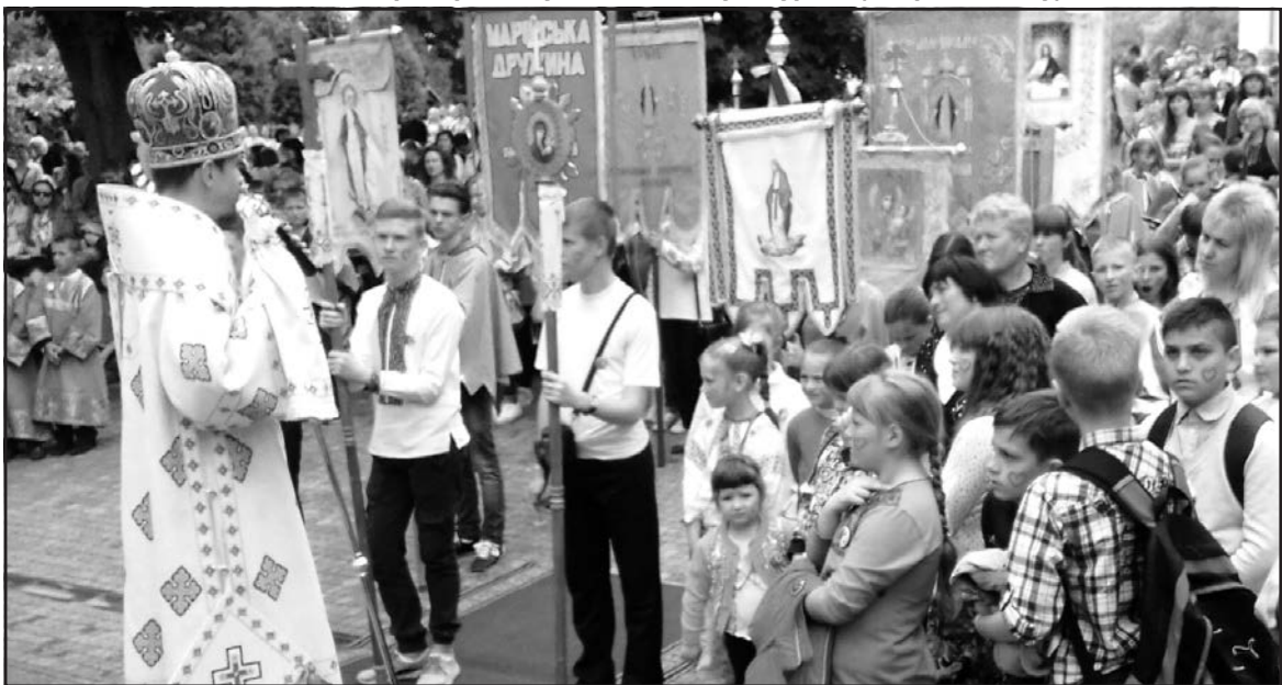
• Служба 101