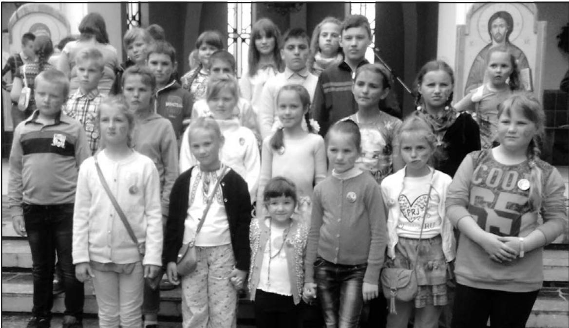
11 червня цього року в Марійському духовному центрі с. Зарваниця Теробовлянського району відбулася проца Марійських та Віктарних дружин. У паломництві взяли участь діти з сіл Чернелів-Руський та Соборне Тернопільського району (на фото). Діти та їх наставники слухають проповідь преосвященного владики Теодора, який очолив Архиерейську Божественну літургію (на фото внизу).