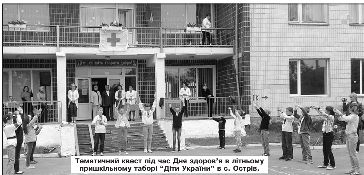
Тематичний квест під час Дня здоров'я в літньому пришкольному таборі “Діти України” в с. Острів.