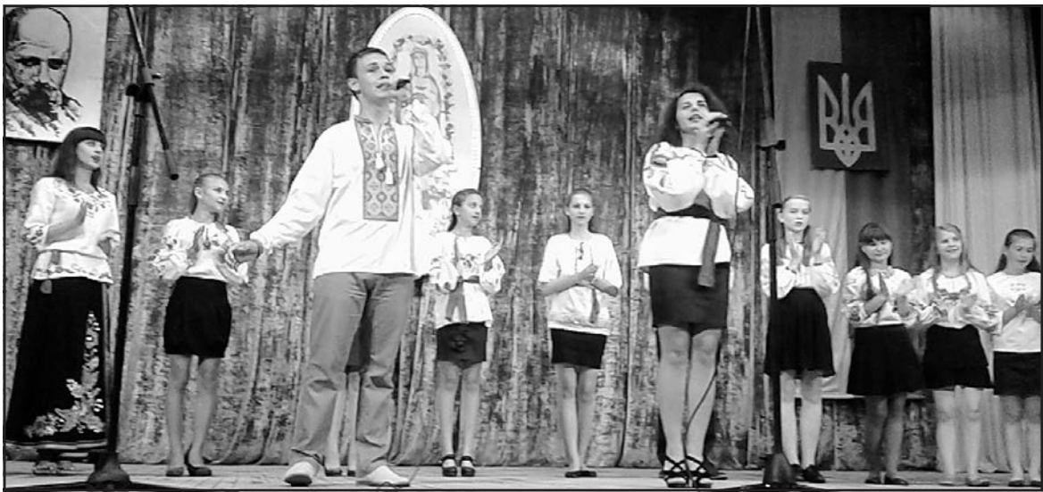
Учасники святкового концерту, присвяченого 20-й річниці Конституції України, в с. Настасів.