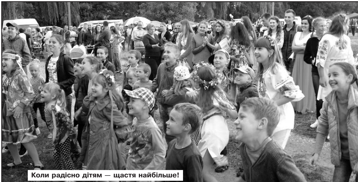
Коли радісно дітям — щастя найбільше!