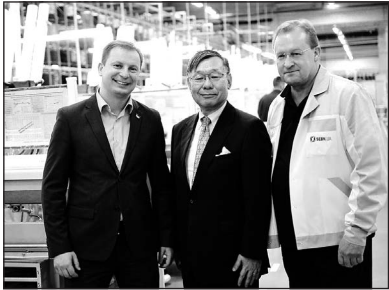
Голова Тернопільської обидержадміністрації Степан Барна під час зустрічі з іноземними інвесторами.

Медичні послуги на Тернопільщині повинні надаватися максимально якісно і бути доступні кожному жителю краю. На цьому постійно наголошує Степан Барна, голова Тернопільської ОДА під час робочих нарад, зустрічей у громадах, оглядів медичних об'єктів. У червні запрацювала станція "швидкої" допомоги у с. Струсів Тербовлянського району. З обласного бюджету для цього виділили 320 тис грн, сільська рада надала 80 тис. грн. Для 8 тисяч мешканців області відкриття станції є важливим, бо тепер медики зможуть надавати їм допомогу оперативніше. До кінця 2016 року заплановано відкрити ще три станції "швидкої" у Бережанському, Збаразькому та