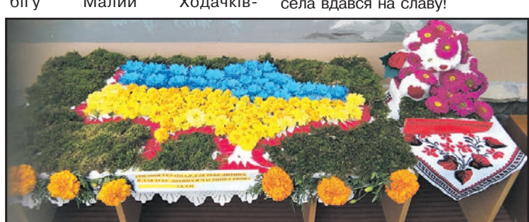
Оригінальні квіткові композиції, виконані учнями 2 класу Малоходачківської ЗОШ I-III ст.

Ну а "на десерт" — хедлайнери концерту — знаменитий співак Василь Хлистун із дочкою Іриною та відомий гурт із філармонії "Веселі Галичани", які подарували гостям незабутні емоції. І навіть холодна та похмура погода не зіпсувала свято, яке тривало до пізнього вечора і закінчилося запальними танцями під живу музику, що йшла луною ще за багато кілометрів і сповіщала — у Малому Ходачкові День села вдався на славу!