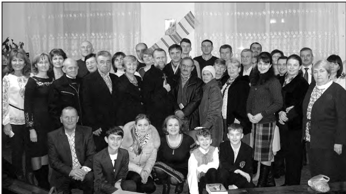
Учасники вечора пам'яті письменника, драматурга, журналіста, педагога, громадсько-політичного діяча Левка Крупи у бібліотеці-філії смт Велика Березовиця.