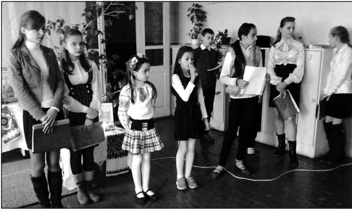
Учні НВК "Козівківська ЗОШ І-ІІ ст.-ДНЗ" читали вірші про Митрополита, про Божу любов до людей, про Україну.