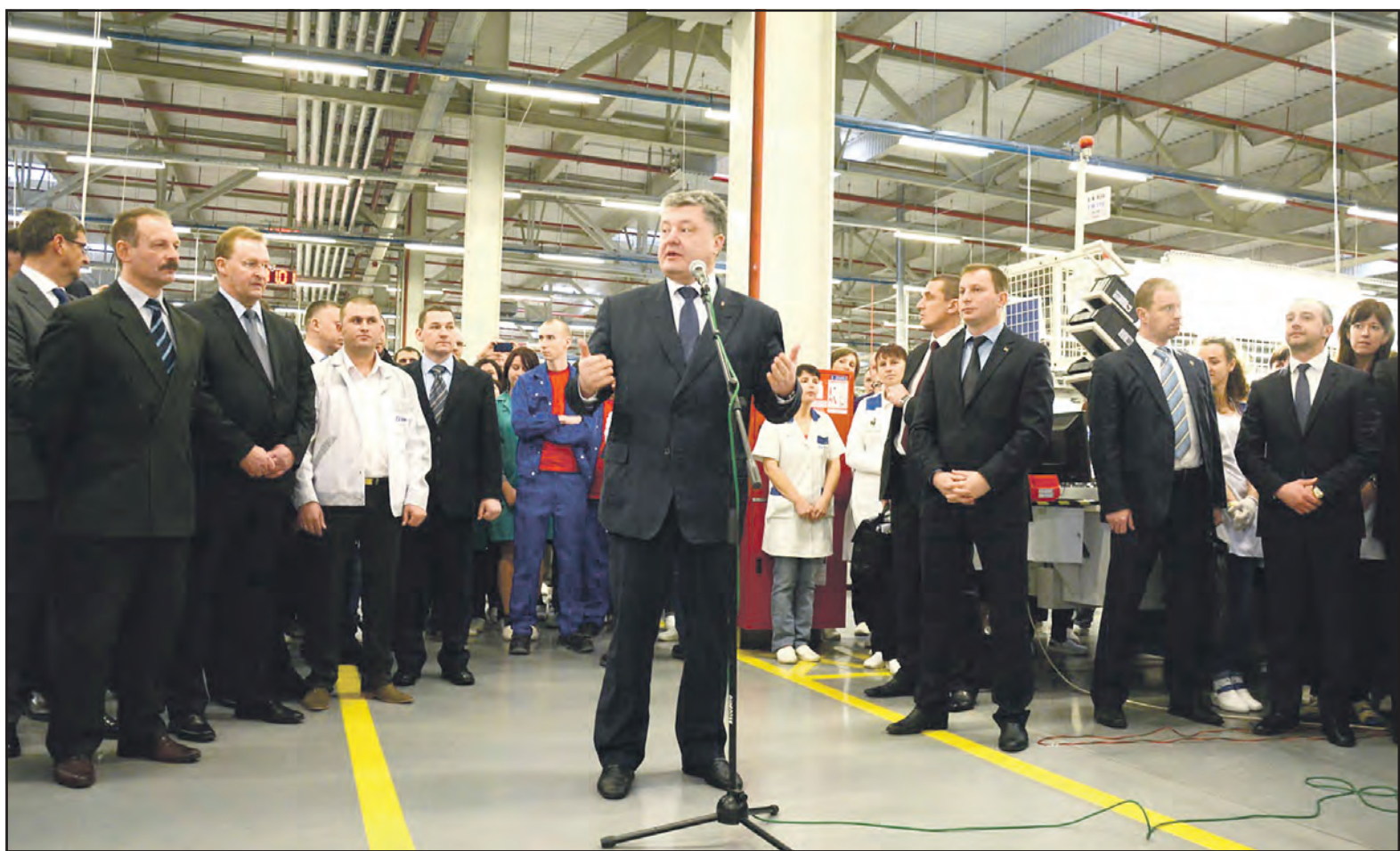
Президент України Петро Порошенко виступає перед колективом ТОВ "СЕ Борднетце-Україна", 11 січня 2016 р., с. Байківці Тернопільського району. Під час візиту на підприємство Президента супроводжували (на фото): голова Тернопільської ОДА Степан Барна, голова Тернопільської райдержадміністрації Олександр Похилий, народний депутат України Олег Барна, директор ТОВ "СЕ Борднетце-Україна" Екхарт Бістрем.

"Світильник істини" — урочиста академія з нагоди 150-ої річниці з дня народження митрополита Андрея Шептицького у Козівці.