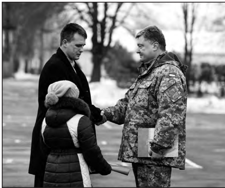
Петро Порошенко вручає ключі від квартири сім'ї Олександра Сеньовського, який отримав важке поранення під Дебальцевим.

Надвечір 11 січня Петро Порошенко зустрівся і з колективом 44-ої окремої артилерійської бригади в Тернополі. Це була перша зустріч