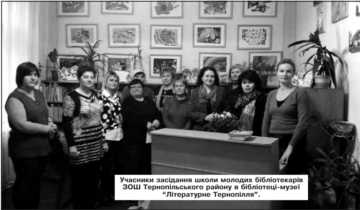
Учасники засідання школи молодих бібліотекерів ЗОШ Тернопільського району в бібліотеці-музеї "Літературне Тернопілля".