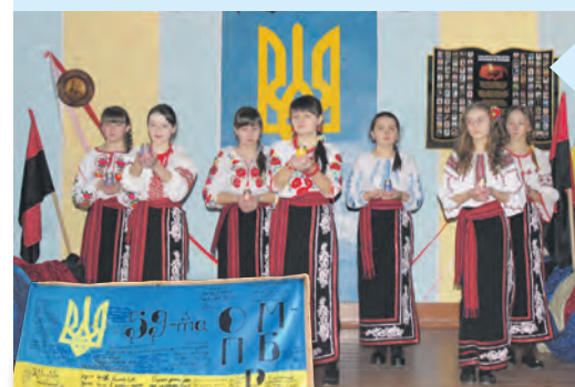
Тематичний вечір, приурочений пам'яті Героїв Небесної сотні.

Досягненням своїх вихованців учителі Почапинської ЗОШ дивують, як своїм, адже це — наслідки їхньої наполегливої праці з дітьми, які стабільно демонструють чудові результати у конкурсах районного та обласного рівнів.