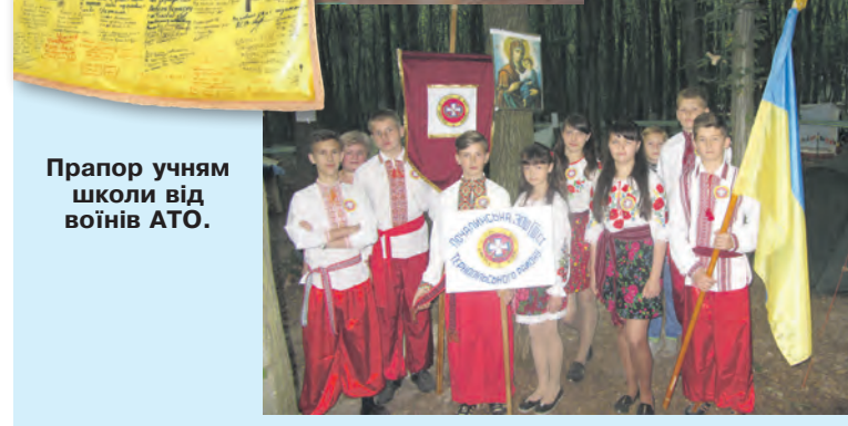
Прапор учням школи від воїнів АТО.