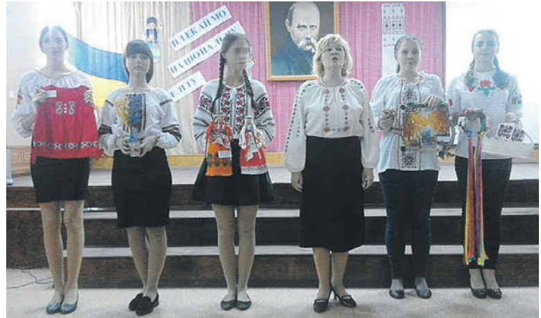
Концерт у гімназії міста Кременна

заків були осавули). Тут не чути української мови. А найгірше: так звані козаки носять георгіївські хрести, шапки-кубанки, шаровари, як російські казаки, які нині воюють на боці сепаратистів та російських окупантів. Це вже після наших захисників. Це вже пи-