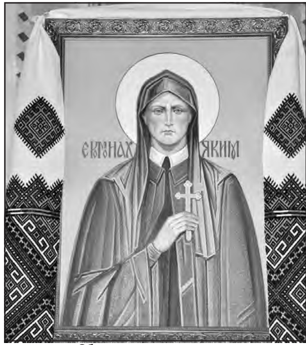
Образ священномученика Якіма Сеньківського у Великогаївській греко-католицькій церкві Ісусового Серця.

Щоразу під час літургій у Великогаївській греко-католицькій церкві Тернопільського району о. Володимир Хома згадує священномученика Якіма Сеньківського і просить його заступництва. Мало хто з тернополян знає, що майбутній святий народився у Великих Гаях в багатодітній сім'ї Сеньківських.