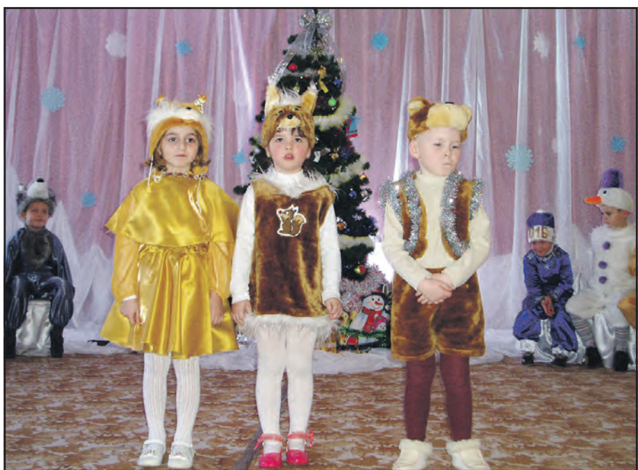
Під час новорічного дійства вихованці Великоберезовицького дитячого садка перевтілилися в казкових героїв.

Зима — найчарівніша пора року. Дерева вкрітає інес, морозне повітря, іскристість сліпучого снігу дарують зашишок і душевний спокій. Безкінечний білий океан дзвінко хрустить під ногами. Незважаючи на те, що взимку холоднішає температура, у новорічну ніч кожному охоплює передчуття дива. Морозець щипає за щічки, сніжинки сяють у світлі ліхтарів. У вікнах будинків мерехтять різнокольорові вогники.