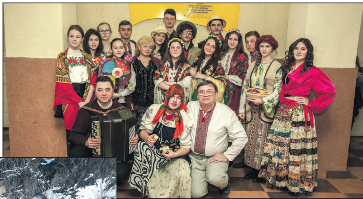
Колектив будинку культури селища Велика Березовиця майстерно виконав на сцені Тернопільського РБК обряд Маланки.