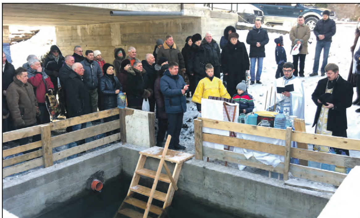
Під час освячення води біля каплички на честь ікони Матері Божої “Живописне джерело” у с. Гаї Гречинські, 19 січня 2016 року.

Залишається загадкою факт, що освячена на Йордан вода не псується, не набирає сторонніх запахів і зберігається тривалий термін. Вважається, що на Водохреще з опівночі до опівночі вода набуває цілющих властивостей і зберігає їх впродовж року, лікуючи людей тілесно і духовно.