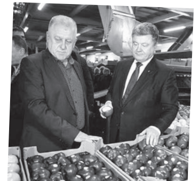
Голова фермерського господарства «Гадз» Петро Гадз та Президент України Петро Порошенко

До слова, серед пріоритетних планів на Тернопільщині — відновлення військової частини у