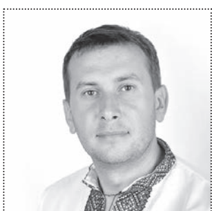
Тарас ЮРИЙ, народний депутат України («Блок Петра Порошенка «Солідарність»)

Щодо фінансування, то його завжди бракує, адже зростають потреби. Бюджет з року в рік залишає бажати кращого. Втім, ми вже акумулювали 26 мільйонів резервного фонду і будемо сприяти залученню цих коштів у пріоритетні напрямки. Сподіваємося, задумане вдасться реалізувати і 2017-й буде не лише активним роком, й прогресивним.