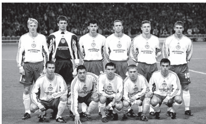
«Динамо 98»: Київське «Динамо» кінця 1990-их років — найпам'ятніша епоха в історії українського футболу.

В першому сезоні під керівництвом Лобановського, в 1997-му році, кияни нарobili галасу в Європі, двічі обігравши «Барселону» із загальним рахунком 7:0 у групі Ліги чемпіонів. Після цього про Шовковського почали говорити як про одного