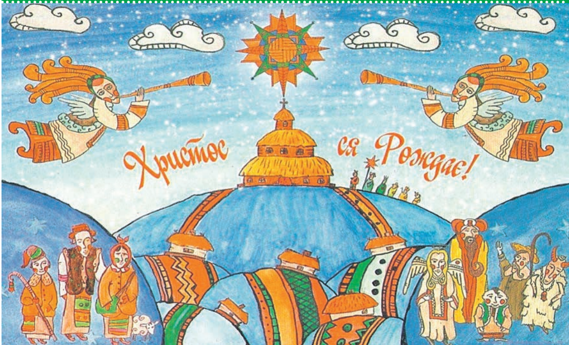
Не слід плутати колядки (народні пісні) та коляди (пісні релігійного змісту) — приурочені до одного з найголовніших християнських свят — Різдва Христового.

Згодом, із появою християнської релігії, обряд колядування був приурочений до Різдва Христового і в колядках з'явилися біблійні і світські мотиви. Традиція колядування збереглася й донині. Як тільки на небі з'являється перша зоря — розпочинається Свята Вечера, а діти збираються гуртом і йдуть вітати усіх колядками з народженням Христа!