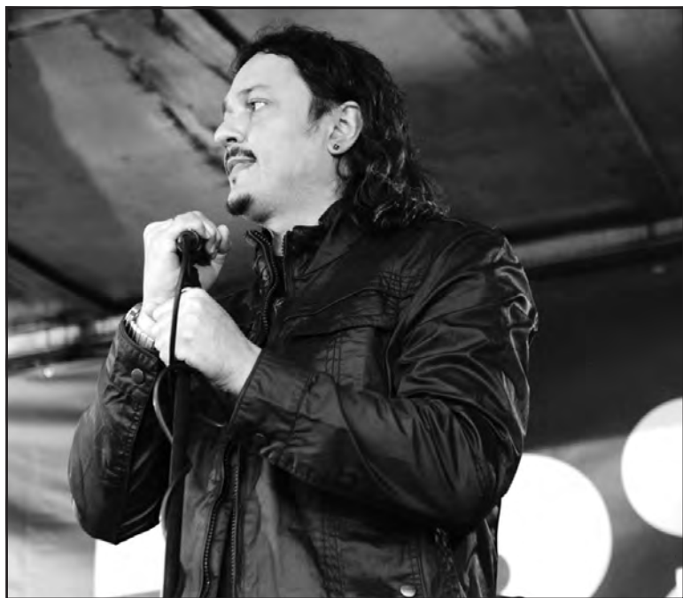
Телеведучий, продюсер, музикант, композитор Андрій Підлужний.

— Одним із перших поп-гуртів в Україні були “Канікули”, фронтменом яких був тернополянин Анатолій Крохмальний. Всі дівчата від нього шаленіли. Він розповів мені