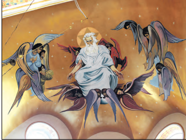
Фрагмент розпису церкви Різдва Пресвятої Богородиці у с. Стегниківці “Бог Саваоф”.

фіях чотирьох сіл у Тербовлянському районі. 10 лютого 1997 року розпочав службу на парафії храму Різдва Пресвятої Богородиці в Стегниківцях — невеличке село, де проживає майже сімсот людей. Все, що зараз має наша церква, її добротний стан — завдяки благородності і господарській жилці місцевих жителів. Це добрі, жертвні люди, завжди готові допомогти ближньому. У рідному селі на Івано-Франківщині наш храм названий на честь Благовіщення Пресвятої Богородиці, у Стегниківцях — Різдва Пресвятої Богородиці. Гадаю, доля не випадково веде мене храмами Богородиці”.