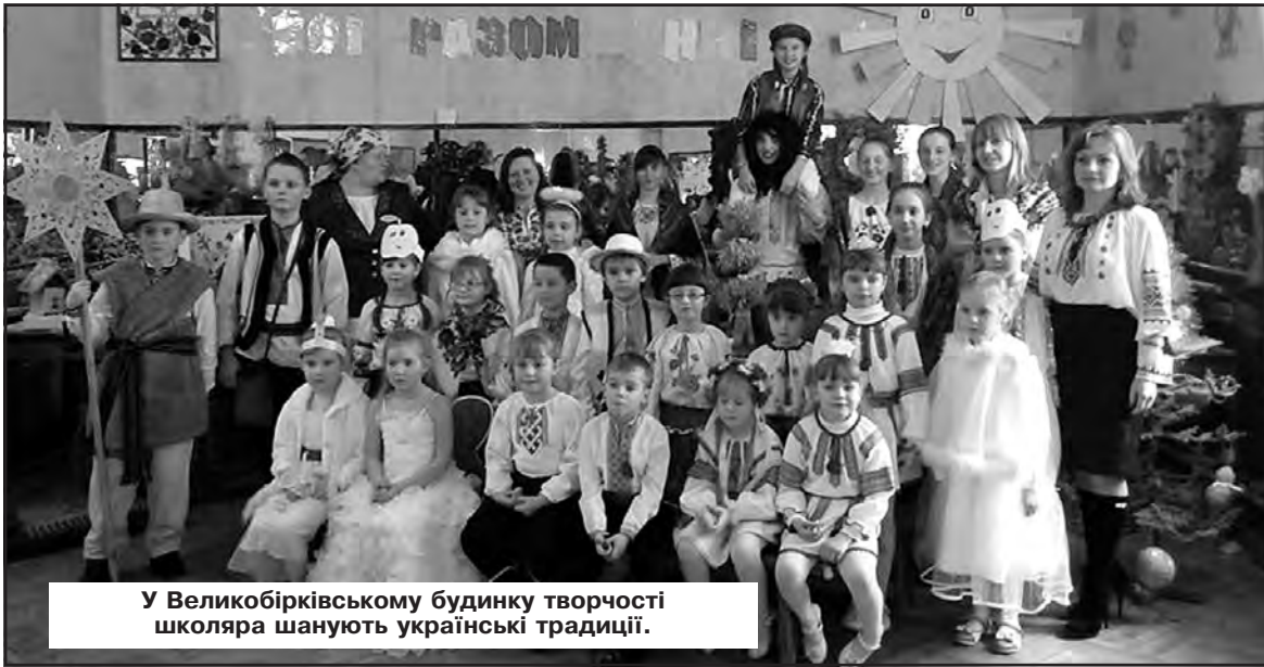
У Великобірківському будинку творчості школяра шанують українські традиції.