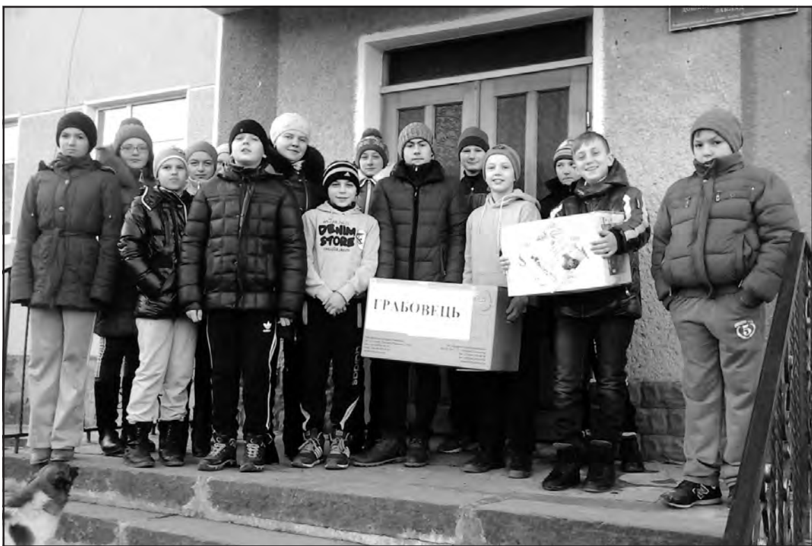
Учасники акції "Подарунок від Святого Миколая воїнам АТО" — учні НВК "Грабовецька ЗОШ I-II ст.-ДНЗ".