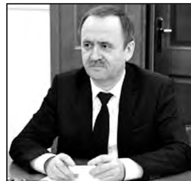
Перший заступник міністра регіонального розвитку, будівництва та житлово-комунального господарства України В'ячеслав Негода.

Проекти, які не були розміщені на онлайн-платформі, розглядаються Міжвідомчою комісією не будуть, зазначено у листі. “Маємо не декларувати, а забезпечити повну відкритість роботи обласних комісій з відбору проектів, дати змогу публічно обговорювати ці проекти і обирати ті, які найбільше потрібні людям”, — сказав В'ячеслав Негода.