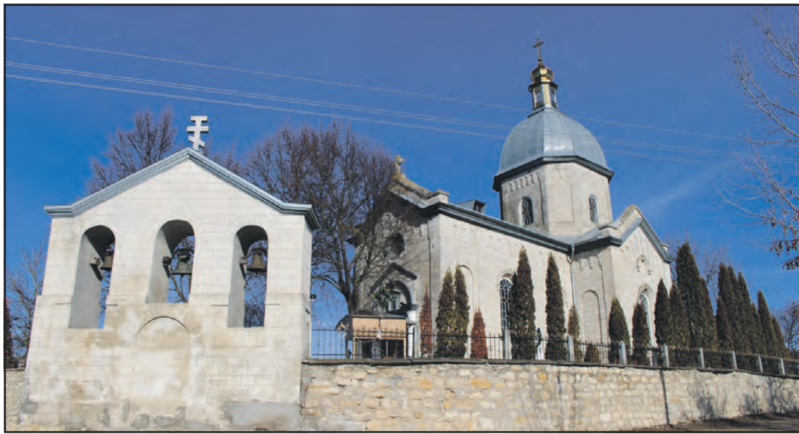
Церква Різдва Пресвятої Богородиці у с. Стегниківці.