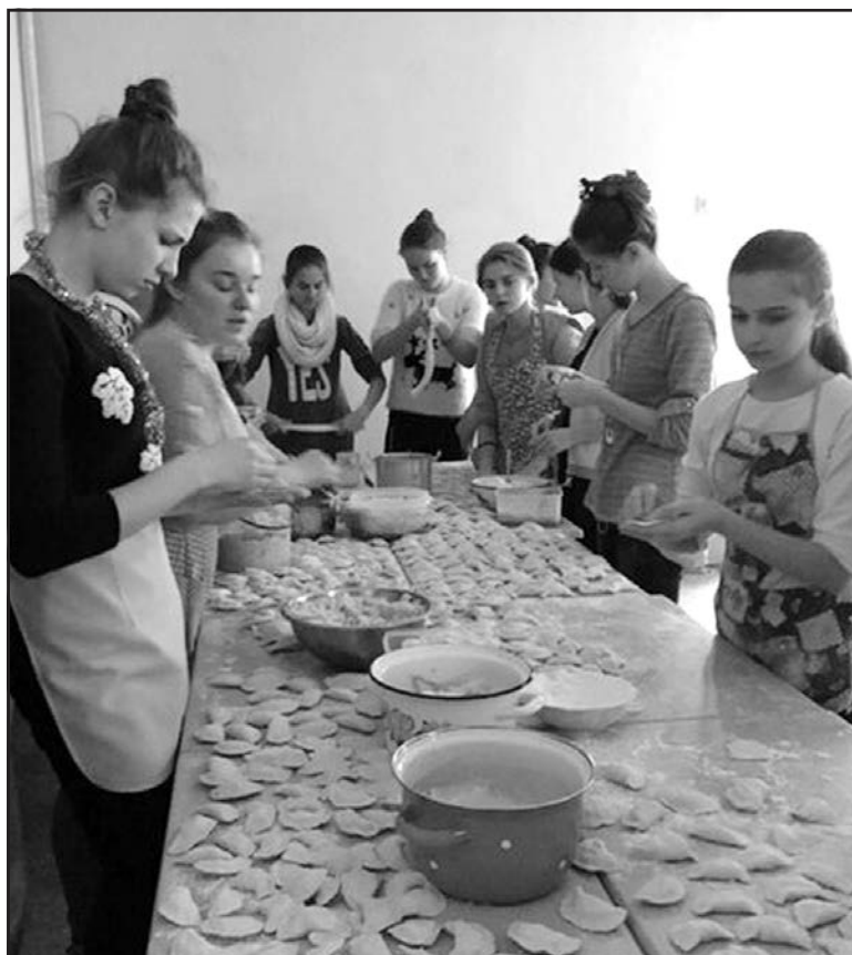
Жінки і дівчата з Великих Гаїв наліпили для бійців АТО 25 відер вареників.

Вертепне дійство мали змогу побачити бійці Правого Сектора, інші військові та добро-