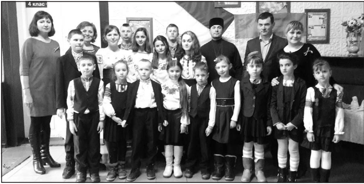
Учасники уроку-реквієму "Вони тримають небо" у Байковецькій ЗОШ I-II ст., 19 лютого 2016 року.