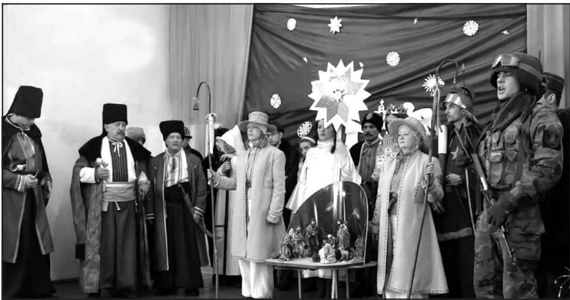
Вертеп із Великих Гаїв виступив перед бійцями АТО прифронтового Гранітного, Сартани, Великомихайлівки.