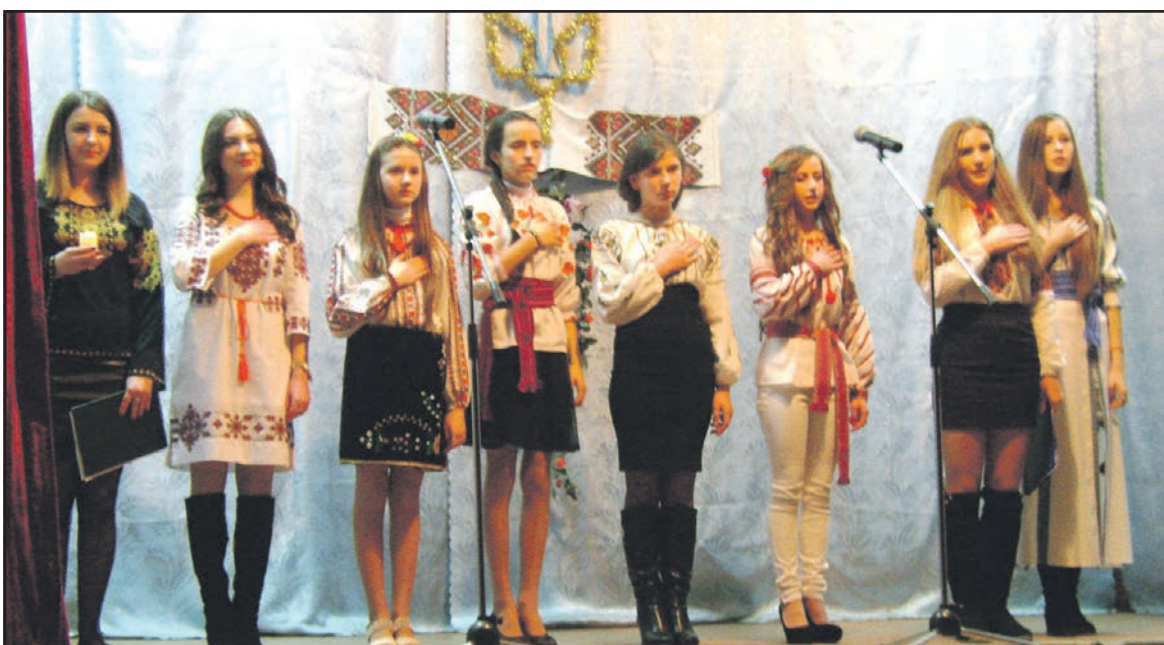
Учасники вечора пам'яті "Без Крутів не було би Злуки" у НВК "Козівківська ЗОШ І-ІІ ст.-ДНЗ".