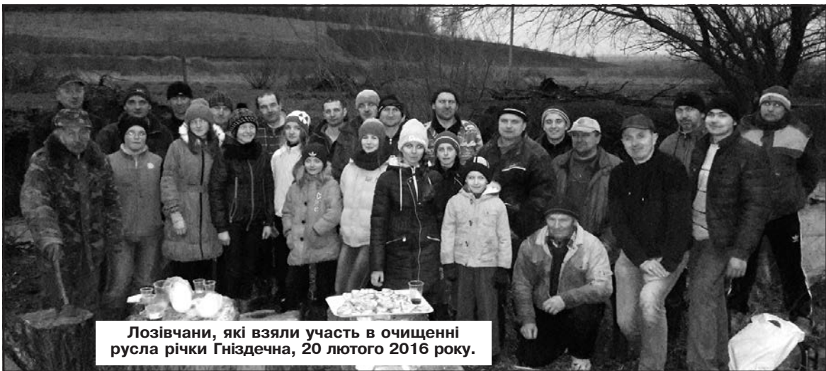
Лозівчани, які взяли участь в очищенні русла річки Гніздечна, 20 лютого 2016 року.