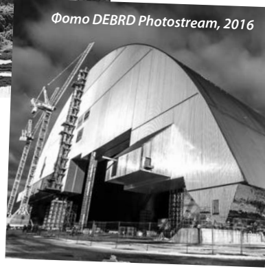
Фото DEBRD Photostream, 2016

Агробізнес | Європейські стандарти корпоративного управління