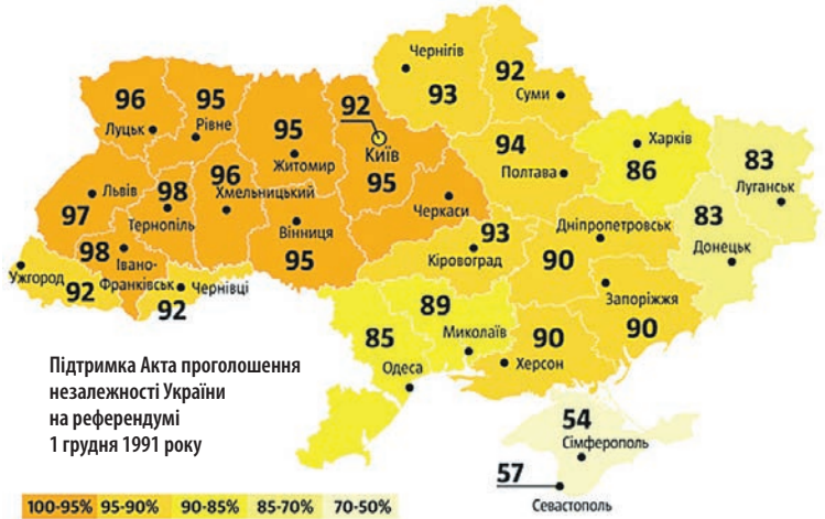
Підтримка Акта проголошення незалежності України на референдумі 1 грудня 1991 року

Референдум 1 грудня 1991 р. підтвердив Акт проголошення незалежності України від 24 серпня 1991 р. І якщо рішення Верховної Ради могла скасувати Верховна Рада іншого скликання, то рішення референдуму ска-