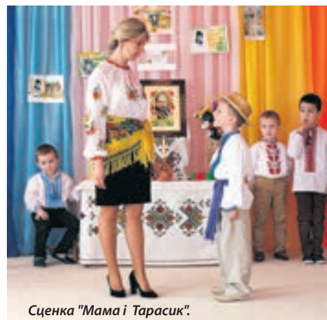
Сценка "Мама і Тарасик".

Стежки життя великого письменника та худочи ще з садка. Тому 10 березня 2017 року у Мишковицькому ДНЗ за участю дітей старшої групи відбулася виховна година на тему: "Ми пам'ятаємо тебе, Тарасе!"