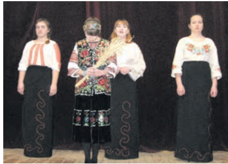
Літературна композиція «Моя Україно» у виконанні учасників аматорського гуртка художнього слова «Ранкові промені» будинку культури села Забойки