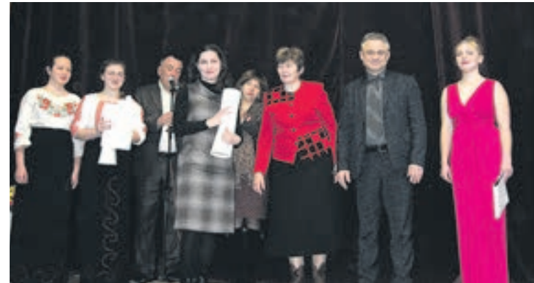
Приємна мить нагородження