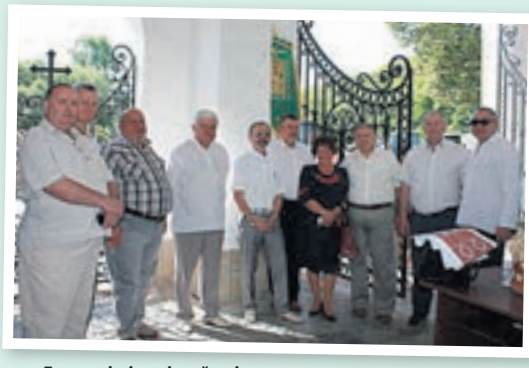
Головні лікарі районів

14 червня — Всесвітній день донора крові