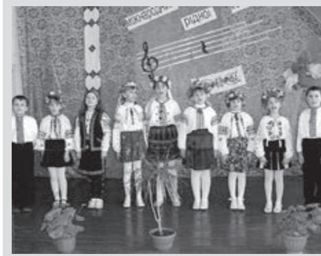
На святі рідної мови