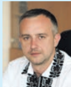
Олександр ПОХИЛИЙ, голова Тернопільської райдержадміністрації