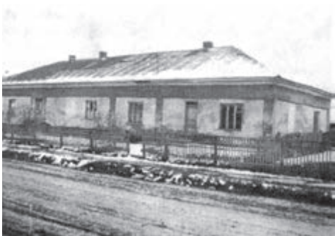
Українсько-польська школа, 1925 р.

Трохи історії. Школу з українською мовою навчання у Настасові було відкрито у далекому 1849 році з дозволу австрійських властей. Відомо, що у 1861-му її управителем був Іван Рогальський — син вон, крім навчання письма, математики та інших дисциплін, впровадив обов'язкові курси з ведення сільського господарства. У 1896 році у школі навчалися 305 учнів. У 1920-му в Настасові вже була чотирикласна школа з польською й українською мовами навчання. Через десятиліття село мало дві школи: двокласну початкову з польською мовою викладання і чотирикласну українську.