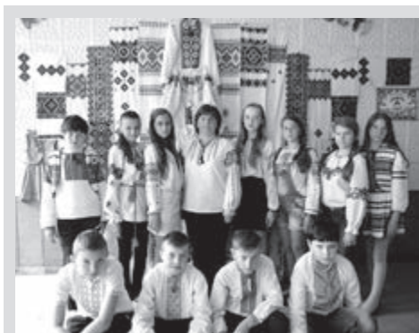
Тижень вишиванки, 2016 рік