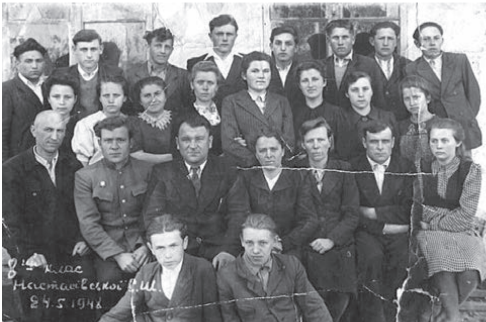
Перші випускники середньої школи

Нині у Настасівській ЗОШ І-ІІІ ст. навчають-ся 262 учні. Освітній процес здійснюють 33