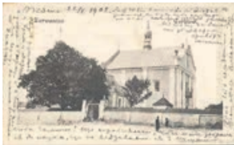
Парафіальна церква Пресвятої Тройці на листівці початку ХХ ст.

На жаль, оригінальні документи і свідчення учасників, які перебували у місцевому церковному архіві, не збереглися, оскільки були знищені радянською владою у 1940 роках. Відомо про цю важливу подію з пізніших переказів, зокрема в «Українському католицькому віснику» за 1938 рік читаємо: «Папа Пій IX поблагословив корону, що коштувала 83 золотих ринських.