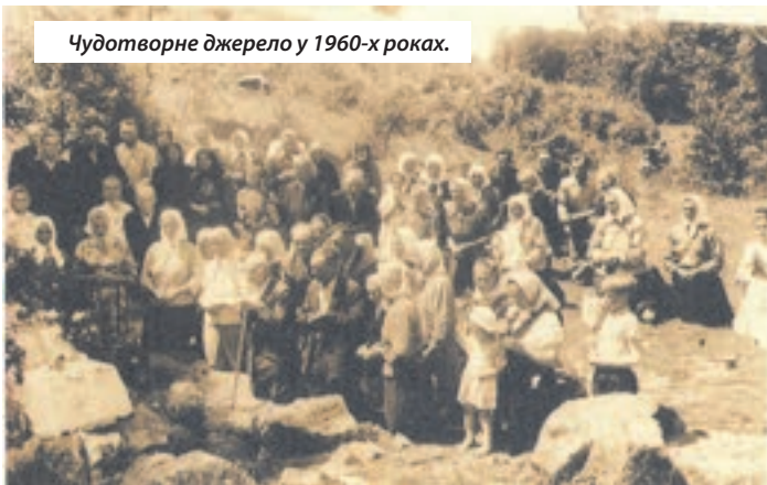
Чудотворне джерело у 1960-х роках.

Коронація відбулася в 1867 році. Мав її довершити митрополит Спиридон Литвиневич, але вели занедужав і вислався 80 делегатів. На цю велику процесію зібралось багато народу. Людей було так багато, що самі фіри стояли дорогою на довжині 2 км. Коронаційні торжества тривали три дні...»