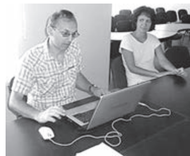
Візит фахівців Тернопільського міського району до Байковецької ОТГ

У рамках роботи виїзних дистанційних майданчиків та з метою поглиблення співпраці з територіальними громадами відбулися чотири виїзні акції в Байковецькій сільській раді та дві — на території Великогаївської сільської ради. У другому півріччі цього року виїзди до територіальних громад відбуваються щомісяця.