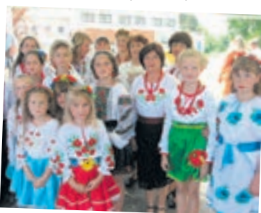
Артисти-аматори зі Скоморох

Традиційно в кінці липня — на початку серпня у Тернопільському районі святкують Дні села. 30 липня такі заходи відбулися у Скоморохах та Дичкові.