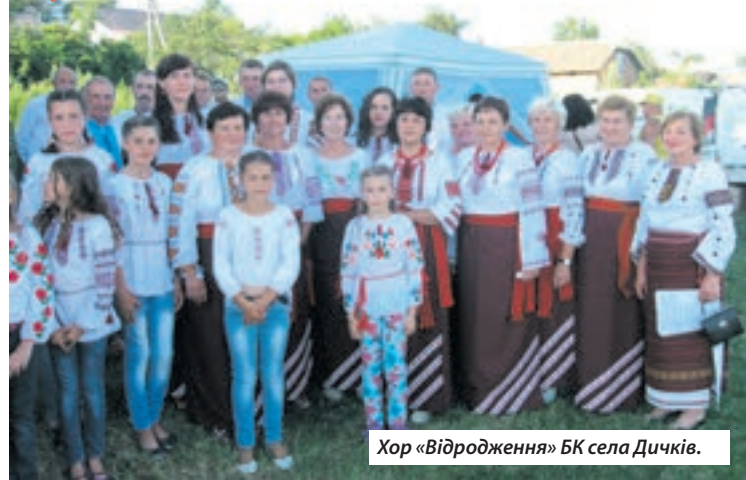
Хор «Відродження» БК села Дичків.