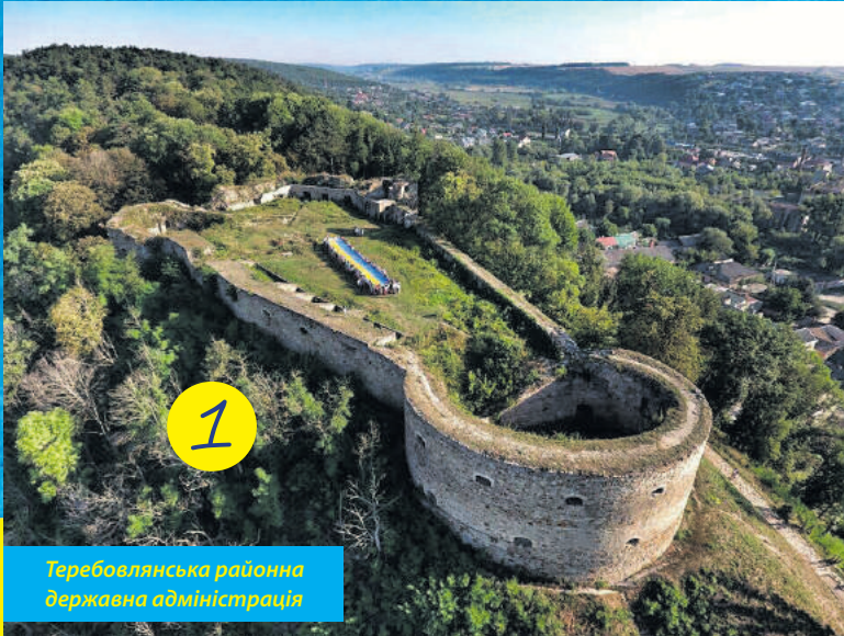
Теребовлянська районна державна адміністрація