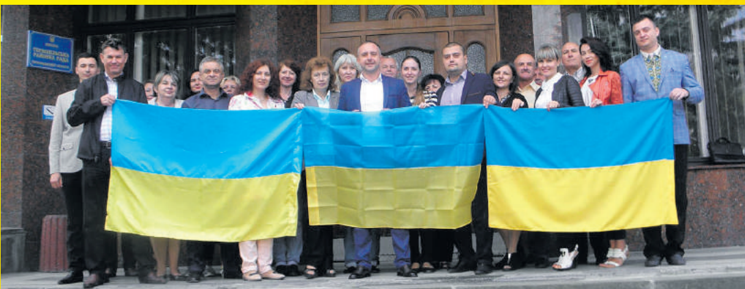
Біля адмінкорпусу районної державної адміністрації проведено флешмоб до Дня Державного Прапора України «Селфі з прапором», в якому взяли участь працівники апарату та структурних підрозділів РДА.