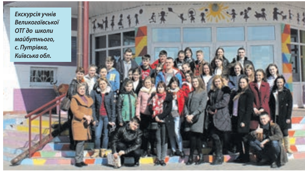
Екскурсія учнів Великогаївської ОТГ до школи майбутнього, с. Путьрівка, Київська обл.

Цьогоріч відбулася зустріч учнів громади з зірками мадридського «Реалу», під час якої відомі футболісти Іван Перес та Франсіско Павон провели майстер-клас для юних футболістів.