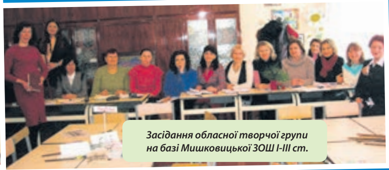
Засідання обласної творчої групи на базі Мишковицької ЗОШ І-ІІІ ст.