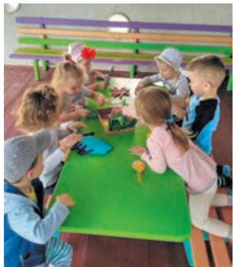
Заняття на відкритому повітрі з вихованцями комунального дошкільного навчального закладу «Ясла-садок «Країна дитинства» с. Великі Гаї»

Виховання активних громадян починається вже з дитячого садка. Педагоги дошкільних закладів використовують для цього різноманітні методи, прийоми, а деякі здійснюють навіть дослідно-експериментальну діяльність.