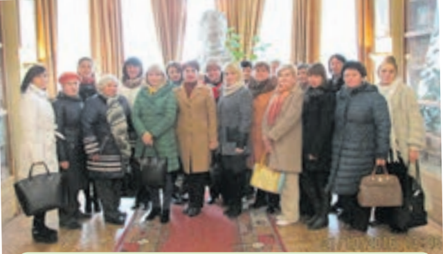
Вчителі української мови і літератури Тернопільського району на виїзному семінарі «Іван Франко — інтелектуальний геній нації» на базі Львівського національного літературно-меморіального музею Івана Франка.