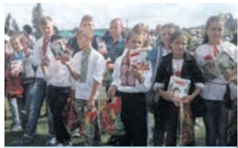
Спортивна естафета учнів Великогаївської ОТГ на День Незалежності України, с. Товстолюг

Щороку на стадіоні села Великі Гаї відбуваються Сільські спортивні ігри, в яких 2017-го взяли участь усі команди сіл Великогаївської громади та команди Тернопільського району. Особливо захоплюючими були змагання спортивних сімей.