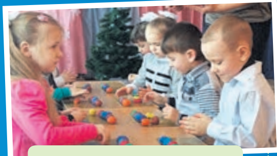
Семінар-практикум для практичних психологів та соціальних педагогів "Робота з педагогами щодо усвідомлення причин девіантної поведінки" на базі Почапинської ЗОШ І-ІІІ ст.