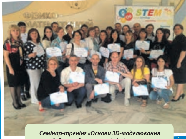
Семінар-тренінг «Основи 3D-моделювання та 3D-друку» для вчителів інформатики Тернопільського району, Великогаївської та Байковецької ОТГ у STEM-центрі «Цифрові ерудити».