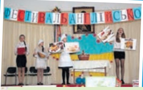
12 учнівських колективів загальноосвітніх шкіл району взяли участь у районному фестивалі англійської культури, на якому представляли традиції, мистецтво та культуру англійських країн.