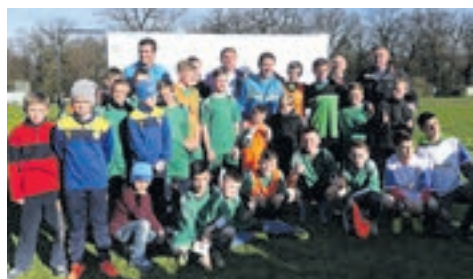
Майстер-клас з відомими футболістами мадридського «Реалу»

Учнівська молодь Великогаївської громади є успішною не лише у навчанні та різноманітних конкурсах, а й активною у житті громади та в спорті. Юні спортсмени представляли громаду в обласних змаганнях із баскетболу (комунальний заклад «Загальноосвітня школа I-III ступенів с. Великі Гаї») та у чемпіонаті України зі стрітболу (комунальний заклад навчально-виховний комплекс «Загальноосвітня школа I-II ступенів – дошкільний навчальний заклад с. Дичків»). Багратозовими призерами районних і обласних змагань з легкої атлетики та легкоатлетичного кросу стали учні загальноосвітніх шкіл сіл Товстолюг, Скоморохи, Дичків та Прошова.