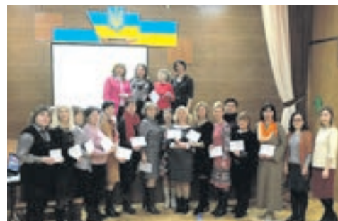
Педагоги Великогаївської громади під час Ярмарку педагогічних ідей

Педагоги Великогаївської громади дбають не лише про успіхи своїх вихованців, а й постійно працюють над самовдосконаленням, відвідують різноманітні семінари, тренінги, майстер-класи. Осинуло року мав традицію — проведення Ярмарку педагогічних ідей «Розвиток компетентностей учнів».