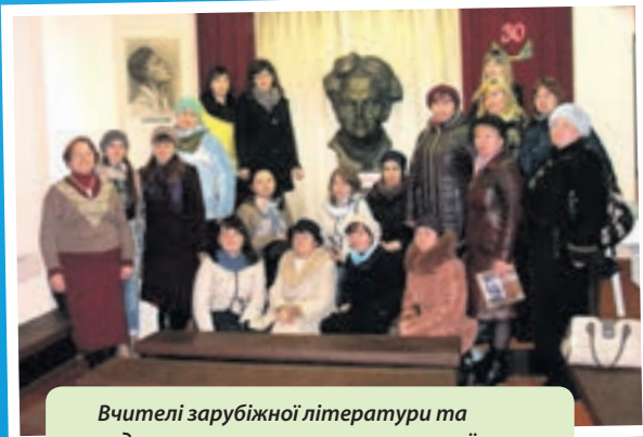
Вчителі зарубіжної літератури та художньо-естетичного циклу на виїзному семінарі у музеї-садибі Леся Курбаса в селі Старий Скалат Підволочиського району.