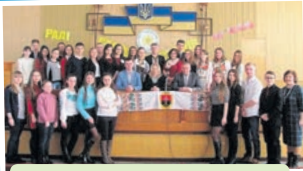
Уроцисте зібрання лідерів району та представників законодавчої і виконавчої влади з нагоди 10-річчя Ради старшокласників "Діти сучасності".