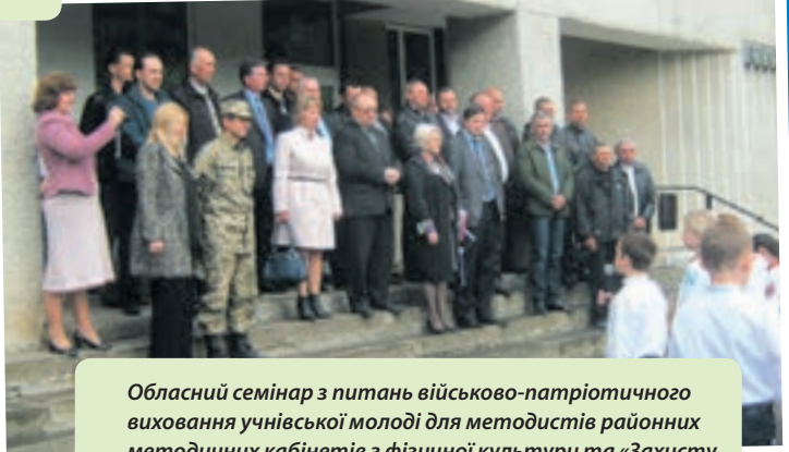
Обласний семінар з питань військово-патріотичного виховання учнівської молоді для методистів районних методичних кабінетів з фізичної культури та «Захисту Вітчизни» на базі НВК «Мишковицька ЗОШ І-ІІІ ст.-ДНЗ».