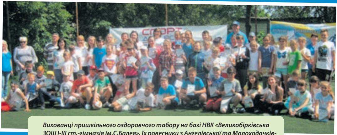
Вихованці пришікльного оздоровчого табору на базі НВК «Великобірківська ЗОШ І-ІІІ ст.-гімназія ім.С.Балея», їх ровесники з Ангелівської та Малоходачківської ЗОШ І-ІІІ ст. під час Олімпійського дня.