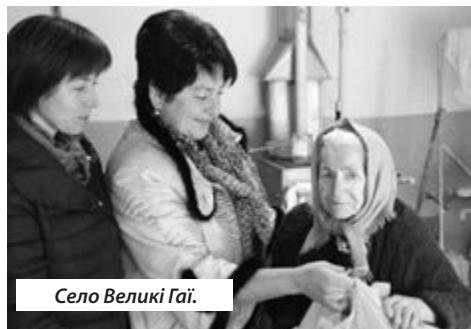
Село Великі Гаї.