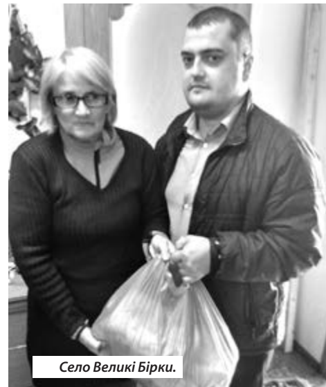
Село Великі Бірки.