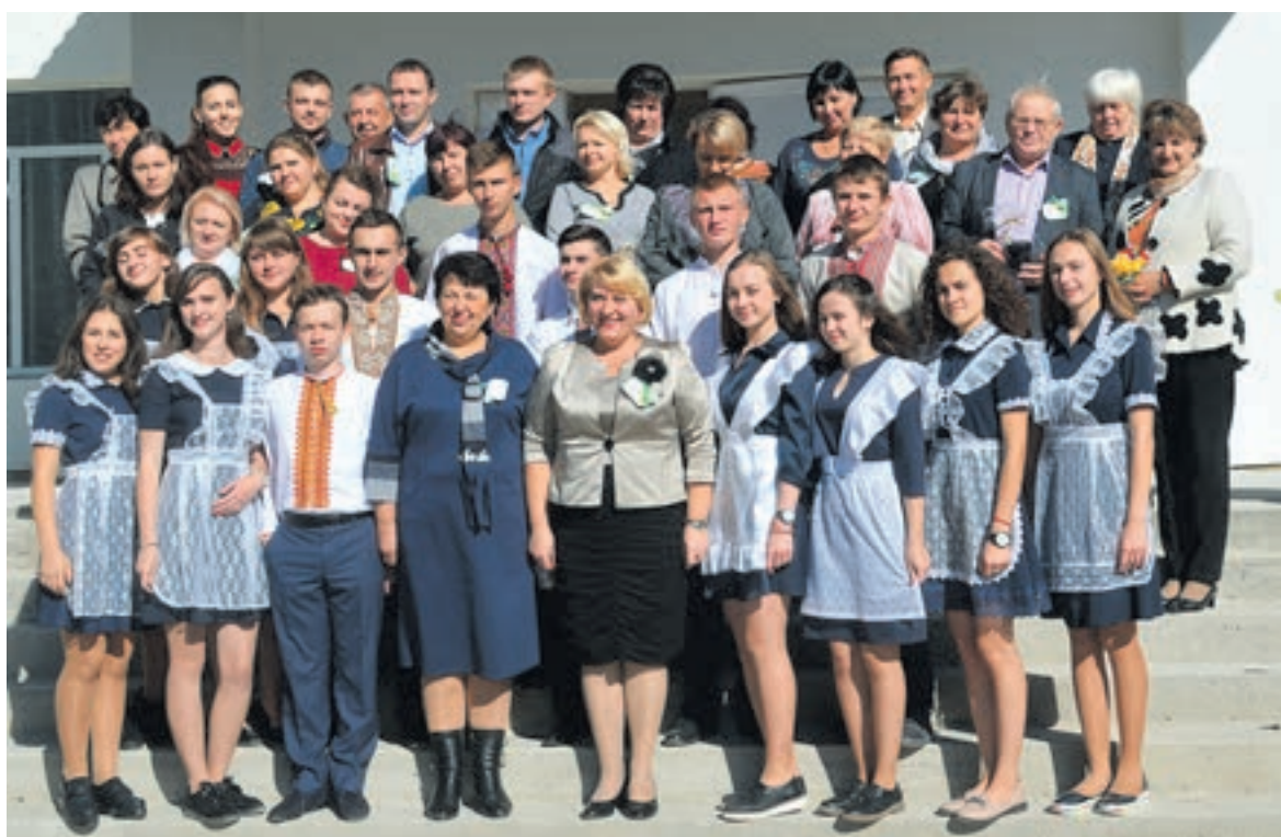
Учні 11 класу та педагогічний колектив Почапинської ЗОШ I-III ст

Традиційно уроки для молодших учнів проводили одинадцятикласники. Зізнаюсь, це було не просто! Одна справа вчити домашнє завдання, зовсім інша — викладати матеріал, зацікавлюючи дітлахів, підтримувати увагу,