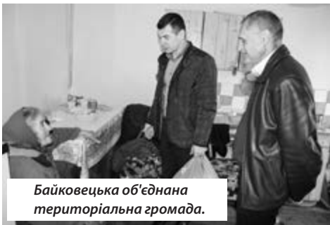
Байковецька об'єднана територіальна громада.

У більшості сільських рад району, в новостроях територіальних об'єднань громадах побудованих, щоб допомогти людині не залишитися поза увагою. Проте є такі, хто досі не забрав продуктів набори, які зберігаються в приміщенні районної організації Товариства Червоного Хреста.