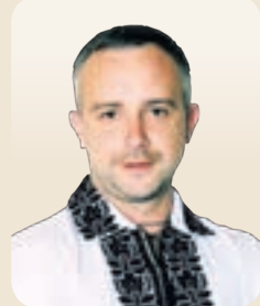
Олександр ПОХИЛИЙ, голова Тернопільської райдержадміністрації