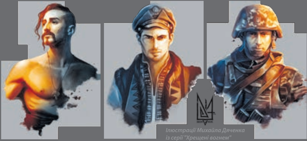
Ілюстрації Михайла Дяченка із серії "Хрещені вогнем"

14 жовтня — значуща дата, яка щорічно переповнює гордістю та хвилюваннями серця мільйонів громадян України. Цього дня країна відзначає День захисника України — свято звияги українського лицарства, а також день пам'яті та пошани всіх, хто впродовж століть боровся за державний суверенітет нашої держави. Окрім цього, на це число припадають ще три великі свята: Покрови Пречистої Богородиці, 75-та річниця створення Української повстанської армії (УПА) та День Українського козацтва.