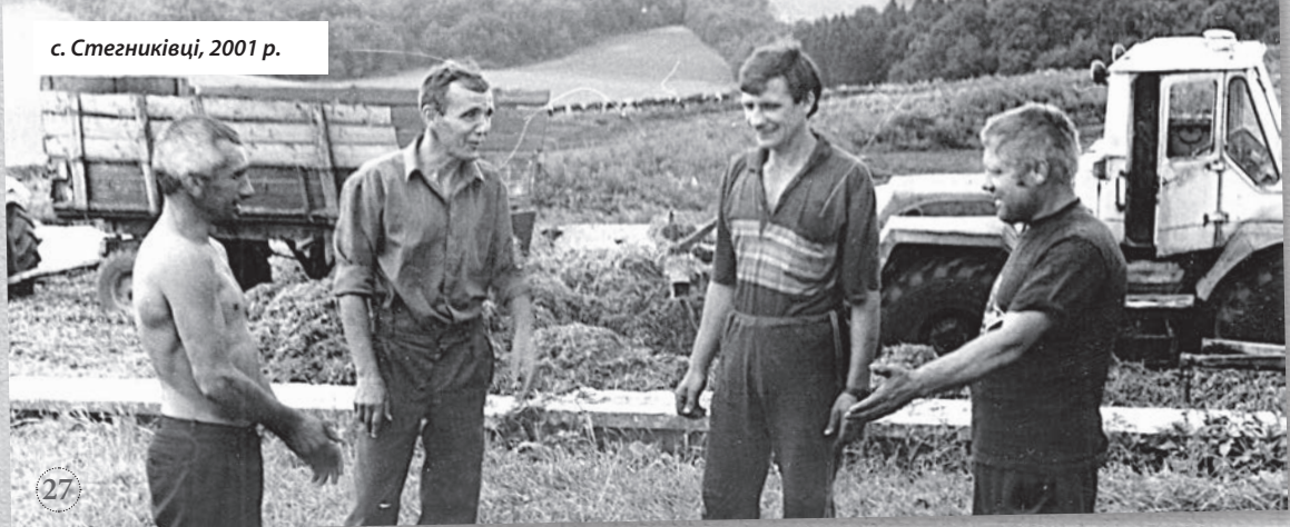
с. Стегниківці, 2001 р.