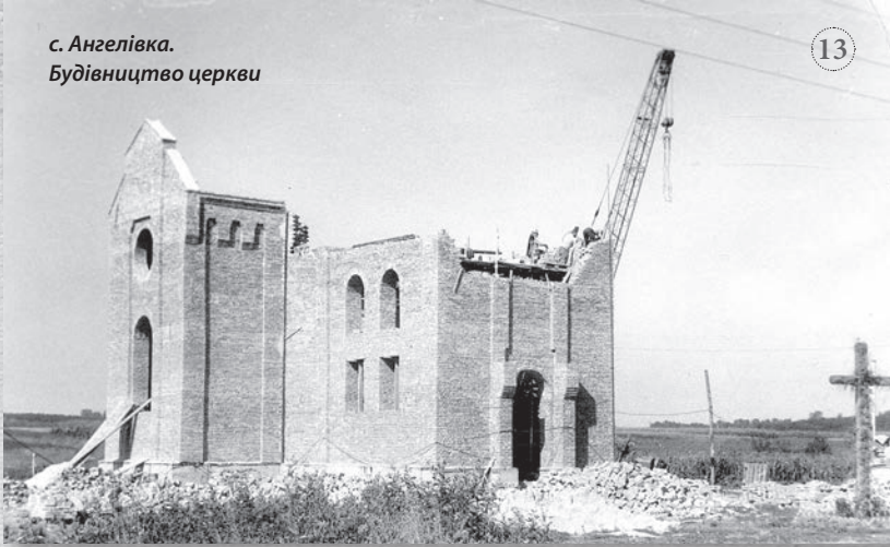
с. Ангелівка. Будівництво церкви