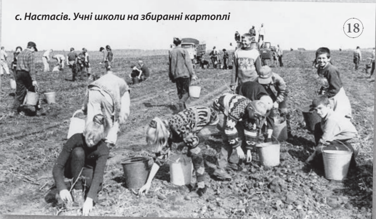
с. Настасів. Учні школи на збиранні картоплі