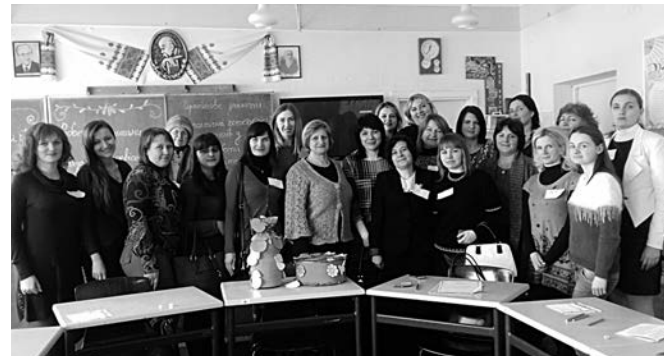
Районні практичні психологи та соціальні педагоги

практикум для практичних психологів та соціальних педагогів із проблеми "Робота з педагогами щодо усвідомлення причин девіантної поведінки". На початку семінару в. о. завідувача центру практичної психології та соціальної робо-