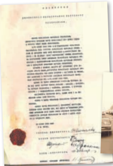
Універсал проголошення злуки УНР і ЗУНР

Вже через рік після кривавого бою, 22 січня 1919 року, на Софійському майдані в Києві Директорія УНР проголосила Акт злуки Української Народної Республіки і Західно-Української Народної Республіки в єдину соборну Україну.