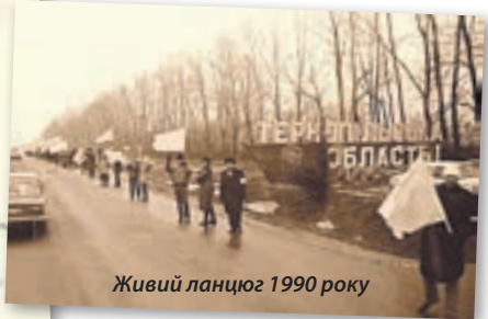
Живий ланцюг 1990 року

А 21 січня 1990 року з нагоди 71-ї річниці проголошення Акта злуки Народний Рух України організував «живий ланцюг», що уособлював Соборність радянських українців узялися за руки від Києва до Львова на знак єднання й прагнення до незалежності. Ця мрія стала реальністю дуже скоро — 24 серпня 1991 року. Тоді у щиро дивувалися, як безкровно Україна здобула самостійність.