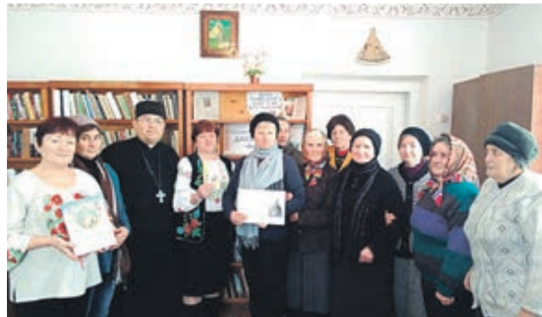
Учасники заходу у бібліотеці-філії села Довжанка

Година пам'яті Йосифа Сліпого під гаслом «Хресний шлях Патріарха» відбулася 7 лютого у бібліотеці-філії села Довжанка. У рамках заходу презентували виставку «Життя Йосифа Сліпого — подвиг в ім'я Бога і України».